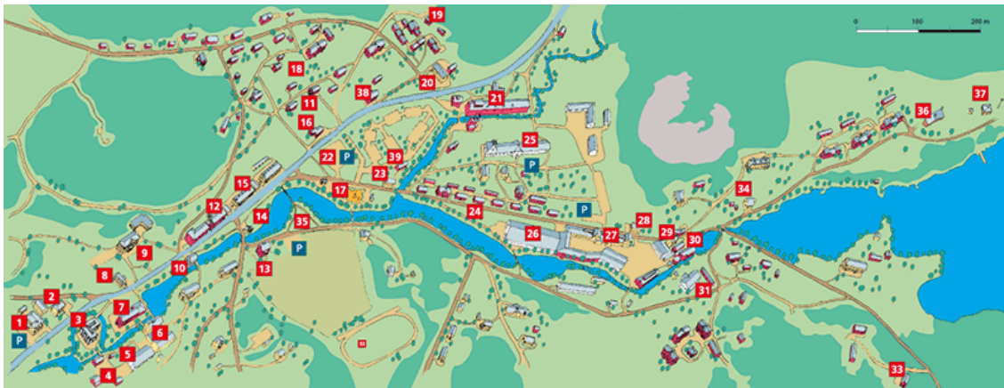
Kuvio 3 Rakennuskartta

Kuviossa 3 on Fiskarsin markkinointimateriaaleissa esitetty piirroskartta, joka havainnollistaa hyvin kylän toimintojen sijainnin ja sisällön. Verkkosivuilla toiminnot on jaettu viiteen ryhmään jotka ovat 1) pajat ja myymälät, 2) ravintolat ja juhlatilat, 3) majoitus, 4) aktiviteetit ja 5) muut. Liitteissä (Liite 3) on lueteltu tarkemmin kaikki kartalta löytyvät toimijat ja niiden sijainti kartalla.