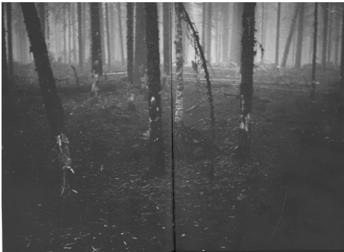
Kuva 4: Valokuva sodassa vaurioituneesta metsästä (K, 66–67).

lehmästä osan taloudellista tuotantoketjua. (Kaarlenkaski 2012, 20.) Tätä vähittäistä muutosta kohti nykyaikaista karjataloutta Väylän lopussa ennakoidaan.