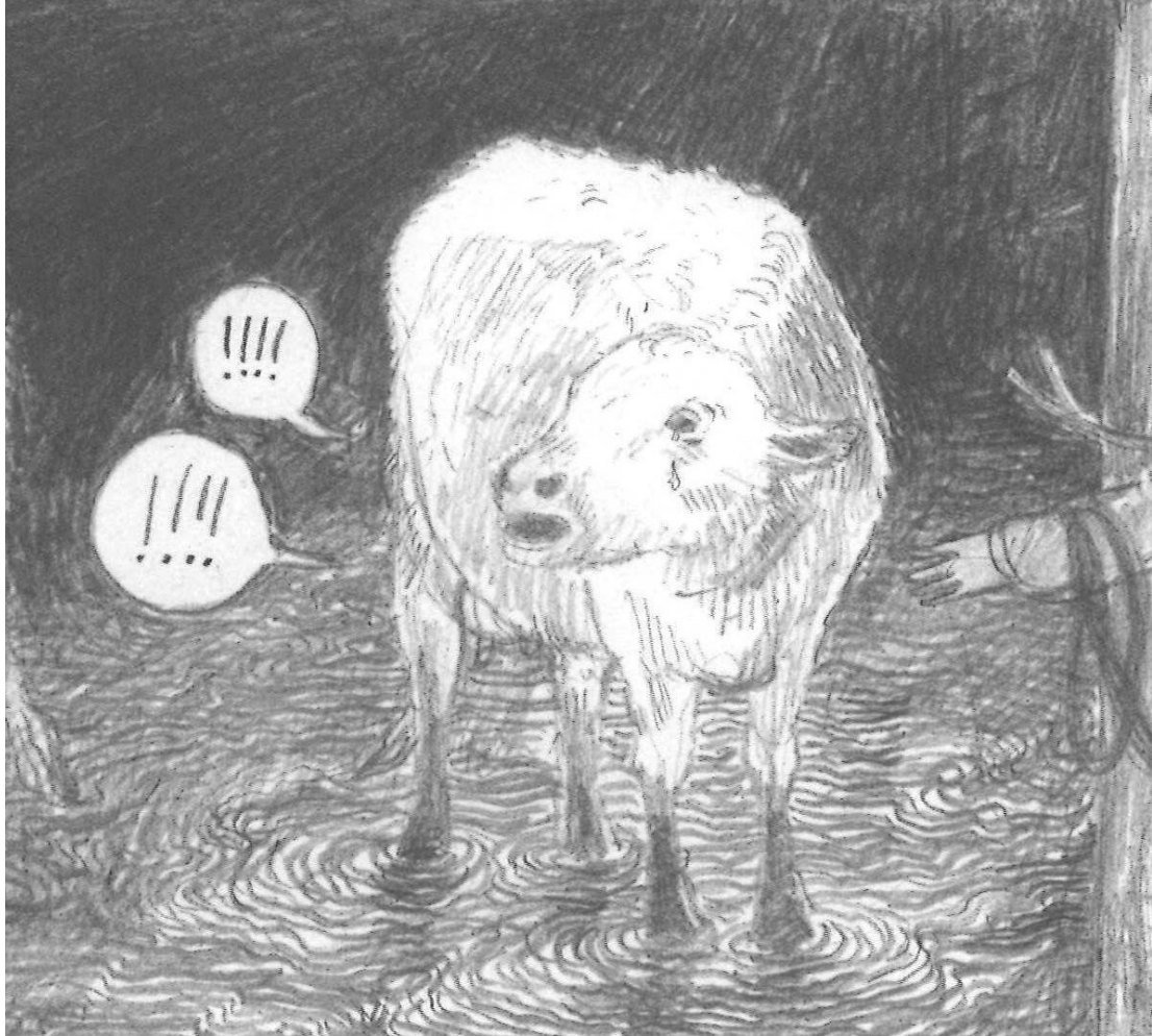
Kuva 3: Lehmä suree kuollutta vasikkaansa Kannaksessa . Yksityiskohta sarjakuvaruudusta (K, 148). © Hanneriina Moisseinen.

Väylän vasikka syntyy, kun ollaan jo evakkomatalla. Lehmän poikiminen on etenkin romaanin nuorille henkilöhahmoille rankka kokemus, mutta teosten kuvaukset vasikoiden syntymisestä luovat kuitenkin tunnetta elämän jatkumisesta poikkeusoloista huolimatta. Mutta siinä missä Väylän uusi vasikka nostetaan syntymänsä jälkeen kärryille, koska se ei jaksaisi vielä itse kävellä, Kannaksen vasikka lopetetaan heti ensimmäisen ruokailunsa jälkeen, koska isä ei usko sen selviytyvän matkasta (K, 146–147). Tässä kohdassa kuvataan surevaa lehmää, jonka silmistä valuu kyyneliä, ja huutomerkki lehmän puhekuplissa kuvaavat kovaäänistä ammutusta (K, 146–149). (Kuva 3.)