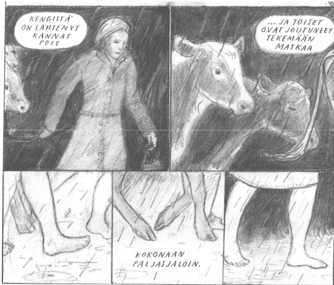
Kuva 1. Ihmisiä ja lehmiiä Kannaksen evakkotiellä (K, 25).