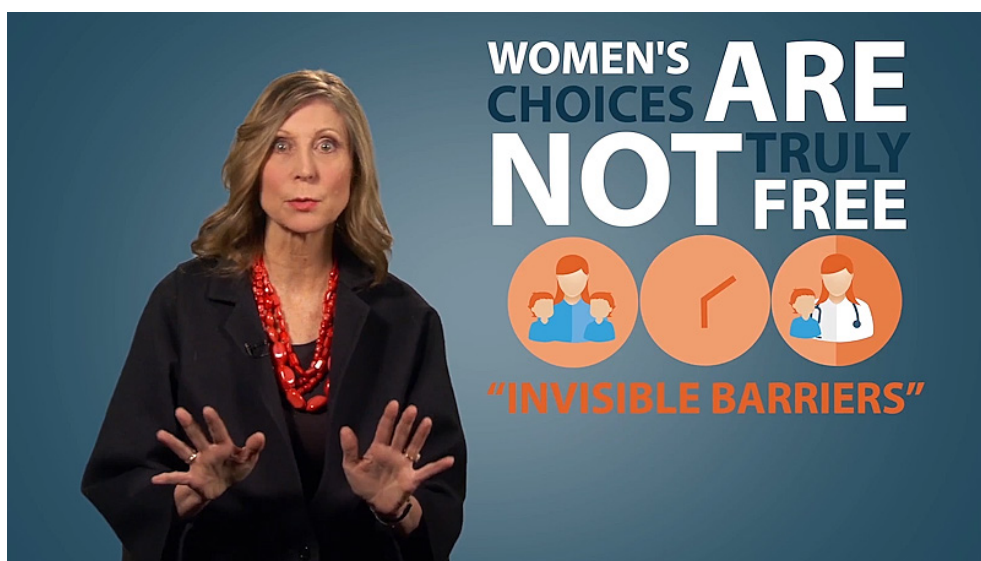
Kuva 2. Christina Hoff Sommers dramatisoi feministien argumentteja (Hoff Sommers 2014a, 3:31). Kuvakaappaus videolta.

Vertaamalla molempien videoiden suosituimpia kommentteja Youtube-sivulla voimme saada kuvaa siitä, miten videoiden poikkeava kehystys samalle sisällölle vaikuttaa vastaanottoon. Vuoden 2017 videon ylimmät