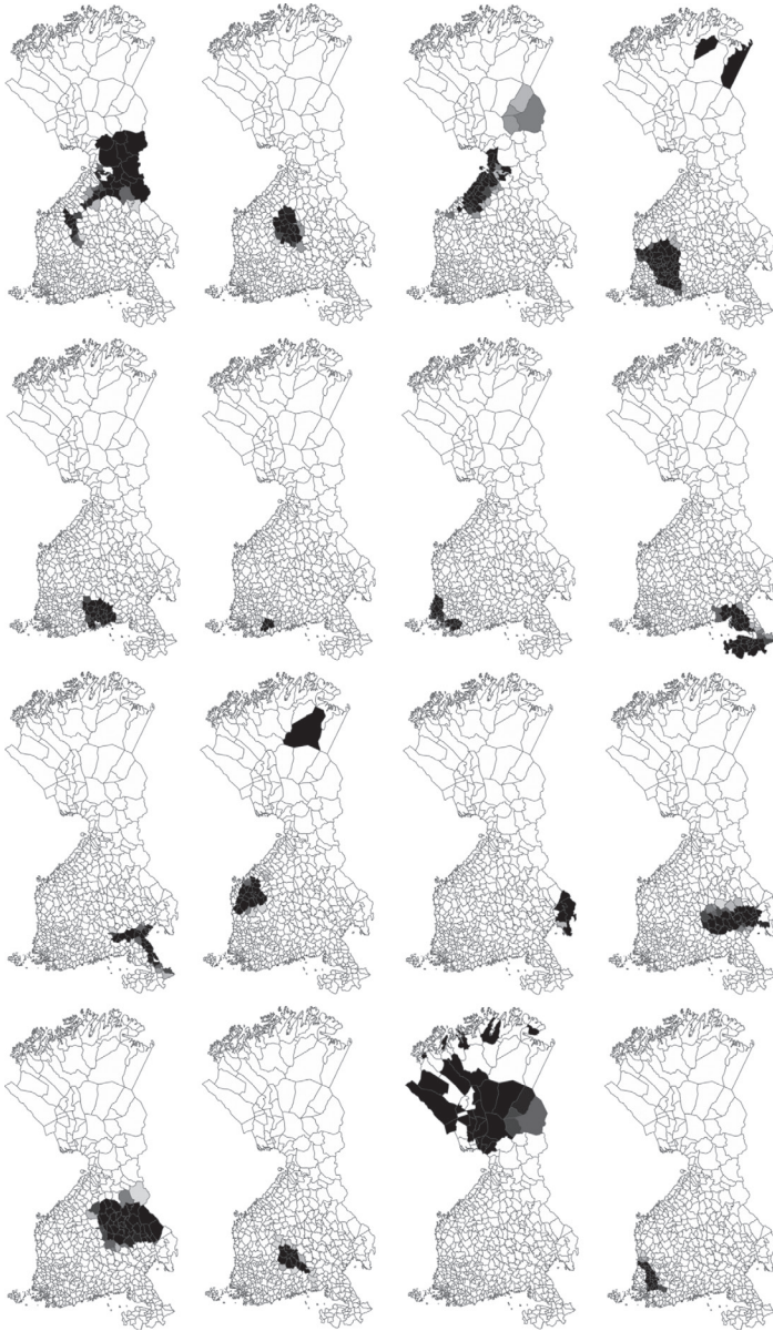
Kuva 3. Kettusen murrekartaston aineiston jako 16 murrealueeseen BAPS-ohjelmistolla (Santaharju ym. 2024). Pohjoisimpien pitäjien yhdistyminen hämäläismurteiden kanssa samaan klusteriin liittyyne siihen, että Lapin pitäjistä Kettunen keräsi vain vähän aineistoa (joitain kymmeniä kielenilmiöitä 213 sijaan; Honkola ym. 2018). Värien koodit, ks. kuva 2