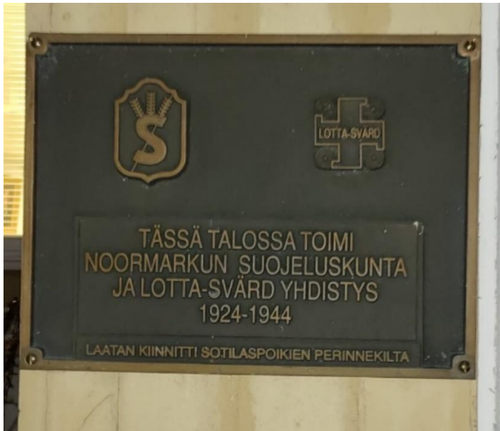
Kuva 6. Kuvassa Noormarkun Klubin seinään kiinnitetty laatta, jolla halutaan kunnioittaa Noormarkun suojeluskunnan ja Lotta Svärd -yhdistyksen muistoa.

vuonna 1944 on vaikuttanut suuresti Klubin historiaan. Klubin seinään on kiinnitetty myöhemmin alemman kuvan laatta kunnioittamaan muistoa Suojeluskunta ja Lotta Svärd- yhdistyksistä.