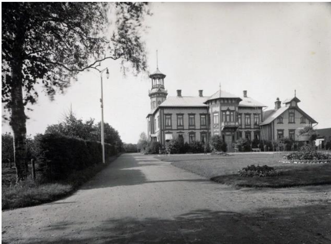
Kuva 3. Isotalo sisäänkäynnin puolelta. Kuvausaika 1905. Isotalo on noin 2000 neliötä kattava rakennus. AAHA.

Päärakennuksen lisäksi oli rakennuskantaa ruukissa ollut jo ennen Antti Ahlströmiä, sillä ensimmäinen työväenasunto ruukkiin rakentui jo 1860-luvulla. Tämä rakennus nimettiin Seppäläksi. Rakennus oli nimensä mukaisesti tarkoitettu seppien asuinpaikaksi. Ruukkialueelle ruvettiin rakentamaan Seppälän lisäksi enemmän työväelle tarkoitettuja taloja 1800-luvun lopulla. Seppälän mukaan aluetta, johon työväenasunnot sijoitettiin, kutsuttiin Seppäinmäeksi tai Pruukinmäeksi. Työväenasunnot olivat vaatimattomia punamullattuja puutaloja, joissa saman katon alla asui yleensä monta perhettä. Asunnot kattoivat pääsääntöisesti vain hellahuoneen. 133