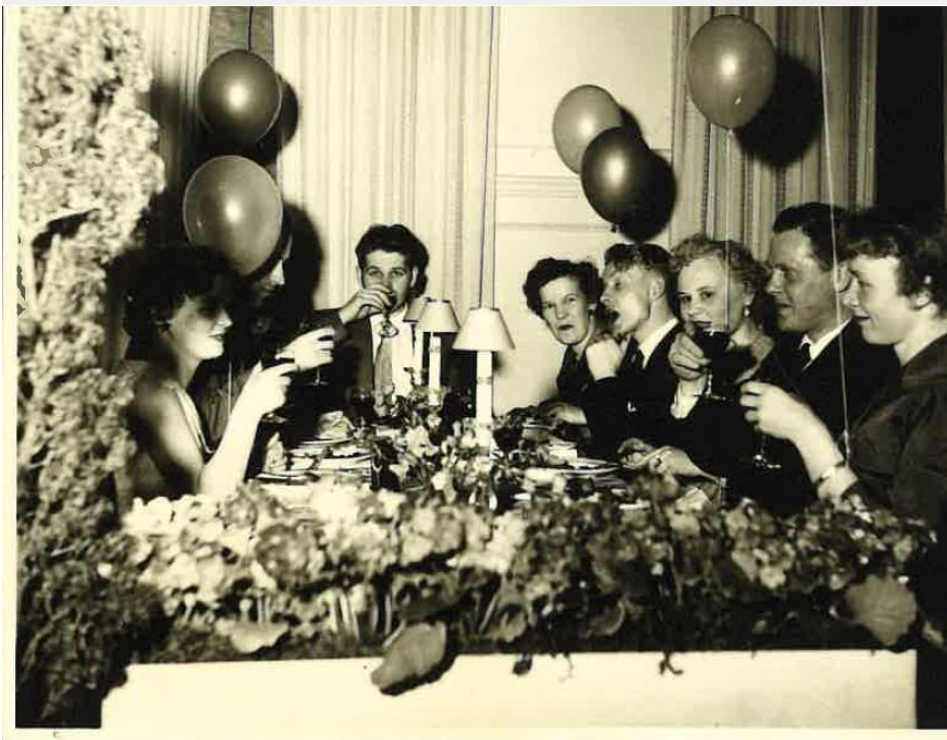
Kuva 9. Vappujuhlat Noormarkun virkailijakerholla 1956. Vappujuhlat olivat pitkään virkailijakerholla traditio. Vaikka virkailijakerho oli pääsääntöisesti vain yhtiön virkailijoiden käytössä, vappujuhlassa oli tietynlainen erityispiirre, sillä juhliin sai aina tuoda perhettä ja ystäviä. 202 Yksityisarkisto.