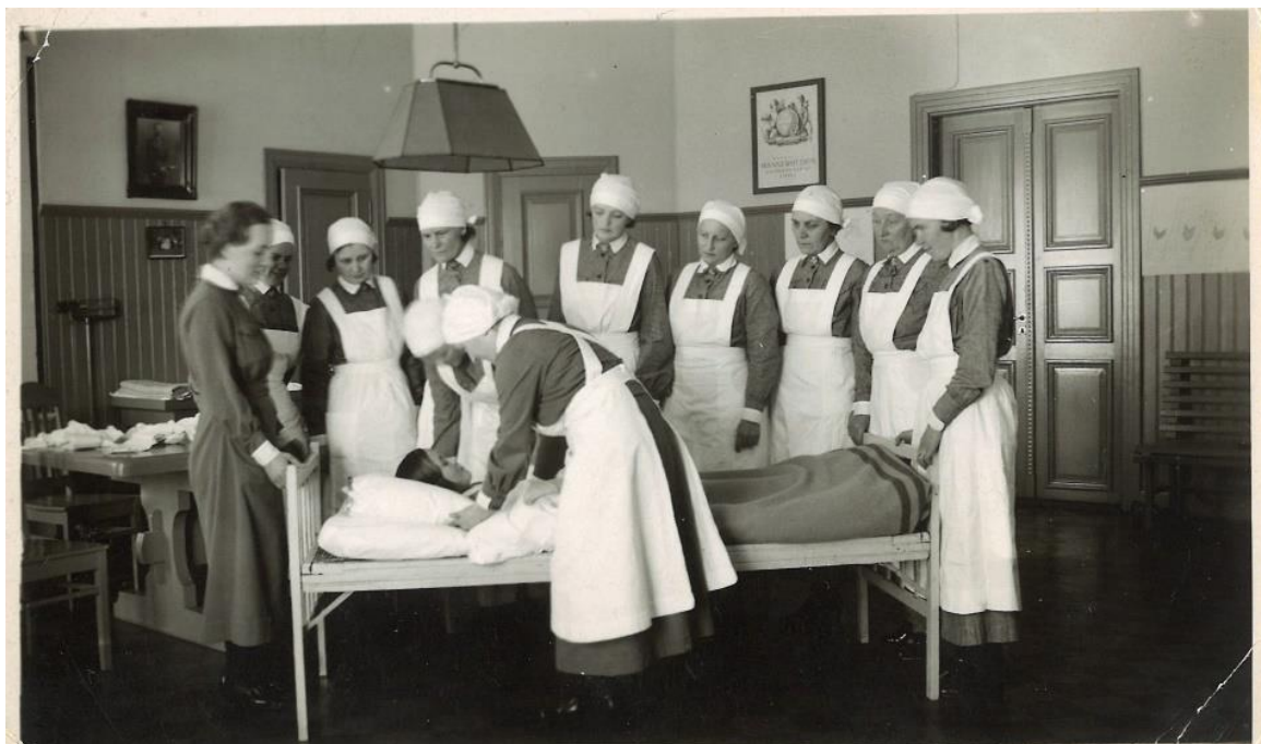
Kuva 7. Noormarkun lotat harjoittelemassa potilaanhoitoa Klubilla. Kuvan ajanottoa ei ole jäänyt tietoon, mutta voidaan olettaa, että kuva on otettu vuosien 1920 ja 1944 välillä.

katsomaan, kun sotaan lähteviä joukkoja koottiin seuratalon pihaan ja marssitettiin sieltä edelleen Poriin. 180