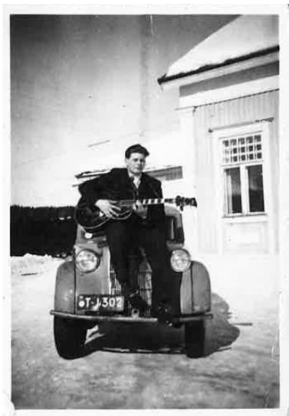
Kuva 11. Kuvassa Ahlström-yhtiön työntekijä Noormarkun virkailijakerhon edessä vuonna 1952.

Yhdistysten perustaminen kertoo myös vahvasti siitä, millaisia arvoja Klubiin on liitetty. Lisäksi muistelutilaisuudessa nousi vahvasti esiin tieto siitä, että Noormarkussa ei ole ollut juuri muita paikkoja, jossa kokoontua. Klubi on siis keskeisenä kokoontumispaikkana ollut tärkeä niin toimihenkilöille, kuin paikkakuntalaisillekin. 221 Yhdessä haastattelussani nousi myös erittäin hauska tarina yhdistyksen perustamisesta, joka on samalla tärkeä tarina ja kuva Klubiin liittyen. Olen liittänyt kertomuksen ja kuvan alle.