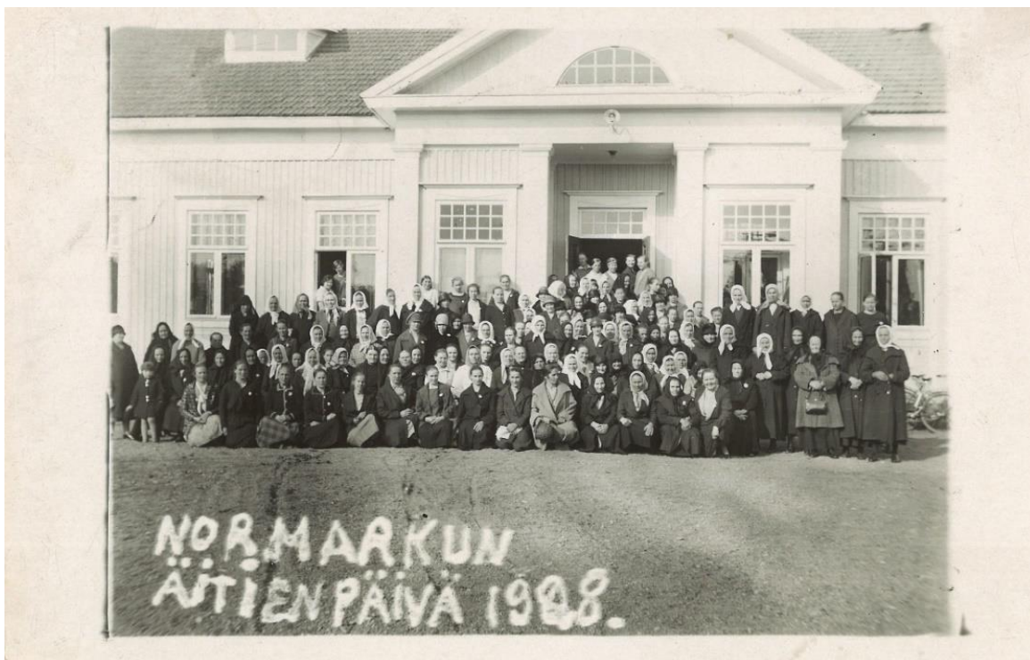
Kuva 8. Noormarkun seuratalolla vietettiin Nuorisoseuran järjestämänä äitienpäivää useampana vuonna. Kuvassa äitejä ja nuorisoseuran järjestämistoimikuntaa vuonna 1928. Taustalla Noormarkun Klubi.

Nuorisoseuran toiminta on kuitenkin loppunut Klubilla sanomalehtiaineiston mukaan vuonna 1932. Voidaan olettaa, että nuorisoseura on kokenut luultavasti sisäisiä vaikeuksia, joiden vuoksi toiminta on hiipunut. Syynä toiminnan loppumiseen voi esimerkiksi olla, että tapahtumien pitoon ei ole saatu kerättyä tarpeeksi järjestäjiä. Vaikka siis Klubi on mahdollistanut omalta osaltaan tämänkin yhteisön olemassaolon, on se oletettavasti Klubista riippumattomista syistä lakannut olemasta tai lakannut kokoontumasta Klubilla.