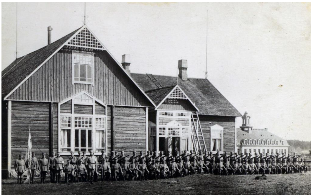
Kuva 1. Kuva 1900-luvun alussa rakennetusta palokunnantalosta. Palokunnantalons edessä on suojeluskuntalaisia. Takana oikealla näkyvä rakennus on Noormarkun ruukissa sijaitseva Pääkonttori. AAHA.

Noormarkun Klubi täysin uusi rakennus vai onko se kunnostettu rakennus, joka on alkuperäisesti jo 1907 vuodelta, kun paikalle rakennettiin palokunnantalo. Tarkkaan ei tiedetä, kuinka paljon alkuperäistä palokunnantaloa on purettu Klubia rakentaessa, mutta voidaan todeta, että rakennus on kokenut suuren uudistuksen niin ulko- kuin sisätiloiltaankin. 83 Vertailun vuoksi olen lisännyt valokuvan palokunnantalosta ja Lindahlin piirtämän Klubin alkuperäisen julkisivupiirustuksen. Kuvista näkee rakennuksen suuren muutoksen palokunnantalosta Klubiksi.