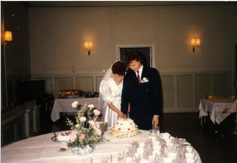
Kuva 12. Hääjuhlat Noormarkun virkailijakerholla 1989. Kuva on otettu Klubin juhlasalista, joka on yhä alkuperäisessä muodossaan ja yhtiössä sisäisesti suojeltu. Yksityisarkisto.

Fazer Catering -yrityksen alla Virkailijakerhon toiminta jatkoi samankaltaisena kuin aikaisempinakin vuosina. Virkailijat kävivät kerholla ruokailemassa, juhlimassa ja seurustelemassa. Yksi haastateltavista kertoo poikansa hääjuhlista virkailijakerholla vuonna 1989 eli Fazer Cateringin ollessa vielä Kerhon toiminnan vetäjänä. Poika ei ollut yhtiön palveluksessa, mutta sai pitää tilaisuuden kerholla, sillä hänen isänsä oli yhtiössä töissä. 240