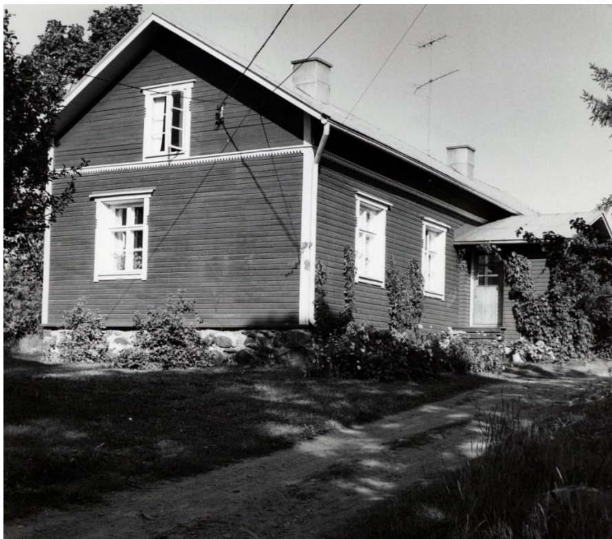
Kuva 4. Työväen Ilola. Ilola on rakennettu paritaloksi. Kuvausaika 1970. AAHA.

Tehdasyhteisöissä vallinneet hierarkiaerot ovat olleet aikoinaan hyvin suuret. Tehdasyhteisössä korkeimmassa asemassa oli pääjohtaja, jonka jälkeen seuraava oli tehtaan isännöitsijä. Isännöitsijän jälkeen tulivat osastopäälliköt, insinöörit, virkailijat ja työnjohtajat. Viimeisenä hierarkiassa on tehtaan työväki. 134 Hierarkian katsotaan olevan suoraa seurausta aiemmin vallinneista säädyistä. Vaikka säädyistä 1900-luvun alussa luovuttiin, luokkaerot vallitsivat Noormarkussa pitkälle 1900-luvun loppuun. Osittain hierarkiaerot ovat alueella ja yhteisössä vieläkin havaittavissa. Klubi on kuitenkin ollut keskeisessä asemassa luomassa, sekä purkamassa hierarkiaeroja.