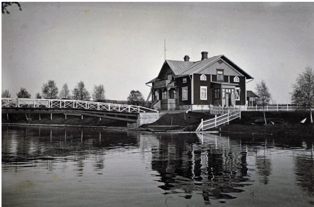
Kuva 5. Isännöitsijälle rakennettu virka-asunto Vainiola. Rakennus on kokenut 1940-luvulla suuren muutoksen, kun arkkitehti Alvar Aalto suunnitteli rakennuksen peruskorjauksen. Rakennus onkin siitä syystä nykyään hyvin erilainen. Kuva on otettu oletettavasti 1890—1910-vuosien välillä.