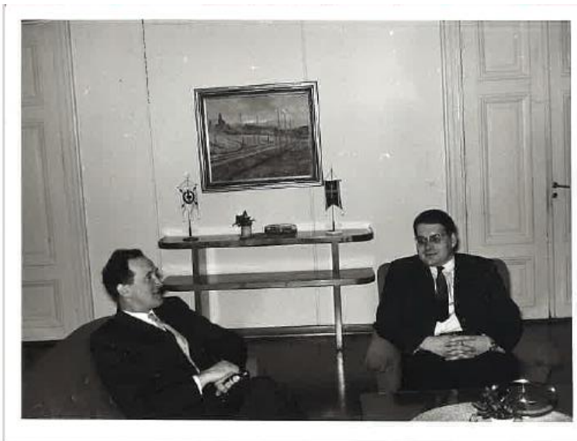
Kuva 10. ”Tämä kuva henkii sellaista hienoa ilmapiiriä, joka Klubilla voi olla. Siellä pääsi myös täyteen rauhaan.” 203 Noormarkun virkailijakerho 1958. Kuvassa kaksi virkailijaa kerholla seurustelemassa.

Kulttuuri on ollut Ahlströmin suvussa ja yhtiössä yhdistävä tekijä aina Antti Ahlströmin ajoista asti. Fennomanian nostaessa päätään Antti Ahlström lahjoitti rahaa suomalaiskansallisiin suunnitelmiin ja tarkoituksiin. Ahlström lahjoitti esimerkiksi 1870-luvun alussa tuhat markkaa Suomalaiselle teatterille, joka nykyään tunnetaan Kansallisteatterina. Suurin syy näissä lahjoituksessa oli suomen kielen ja kulttuurin kohottaminen ruotsin kanssa samalle tasolle, ellei jopa korkeammallekin. 204 Sen vuoksi yhtiössä onkin alusta asti nautittu erilaisista juhlista ja tapahtumista. Niiden päällimmäinen tarkoitus on ollut nostaa suomalaista kulttuuria.