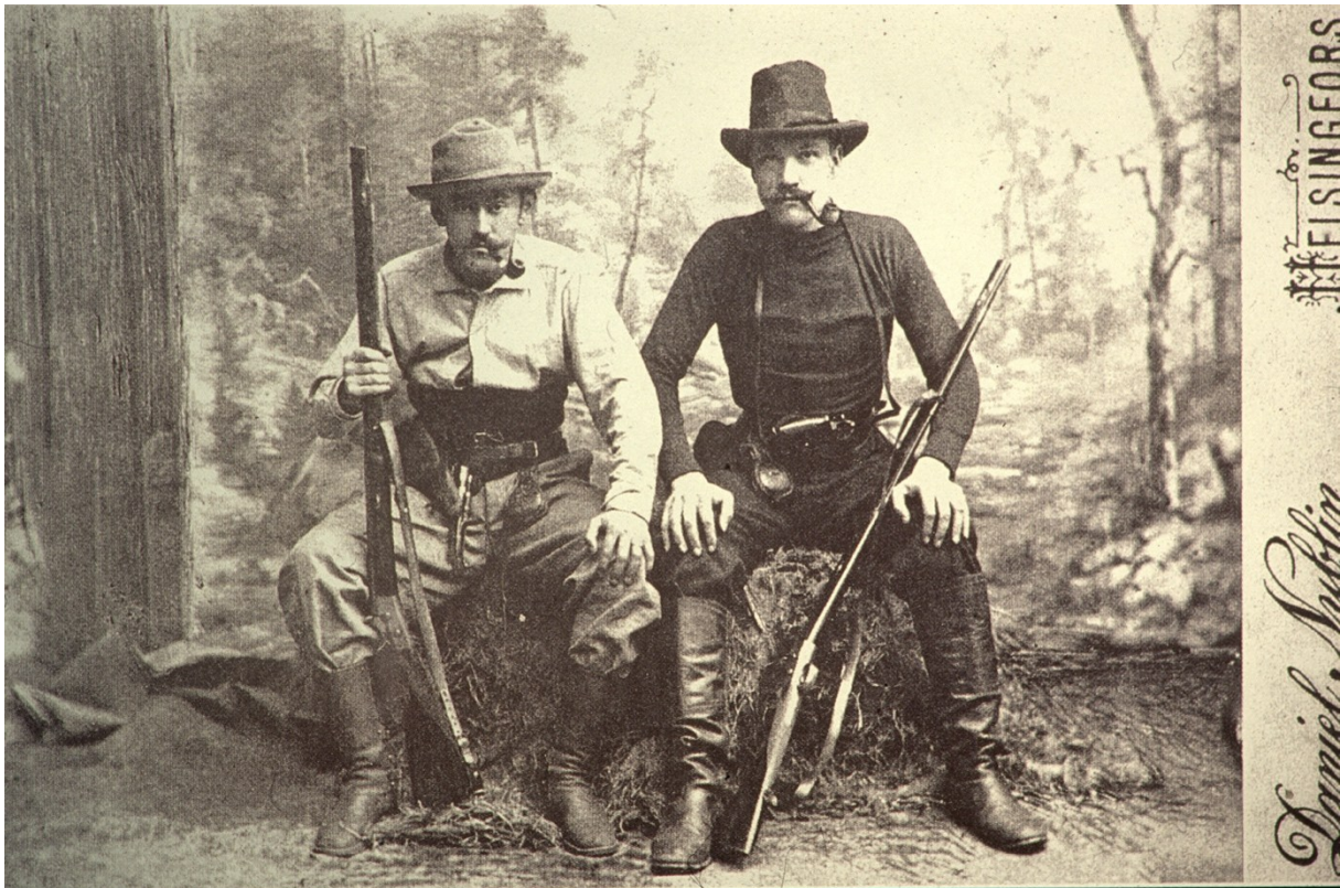
Kuva 1 Louis Sparre (vas.) ja Axel Gallen-Kallela (oik.) erämaalavasteissa vuonna 1890.

Valokuva toimii siten kiinnostavana esimerkkinä siitä, miten suomalainen erämaa ei ollut Sparrelle pelkästään konkreettinen matkakohde, vaan myös mielikuvien ja odotusten rakentama tila, johon liittyi sekä seikkailun että taiteellisen inspiraation ulottuvuuksia.