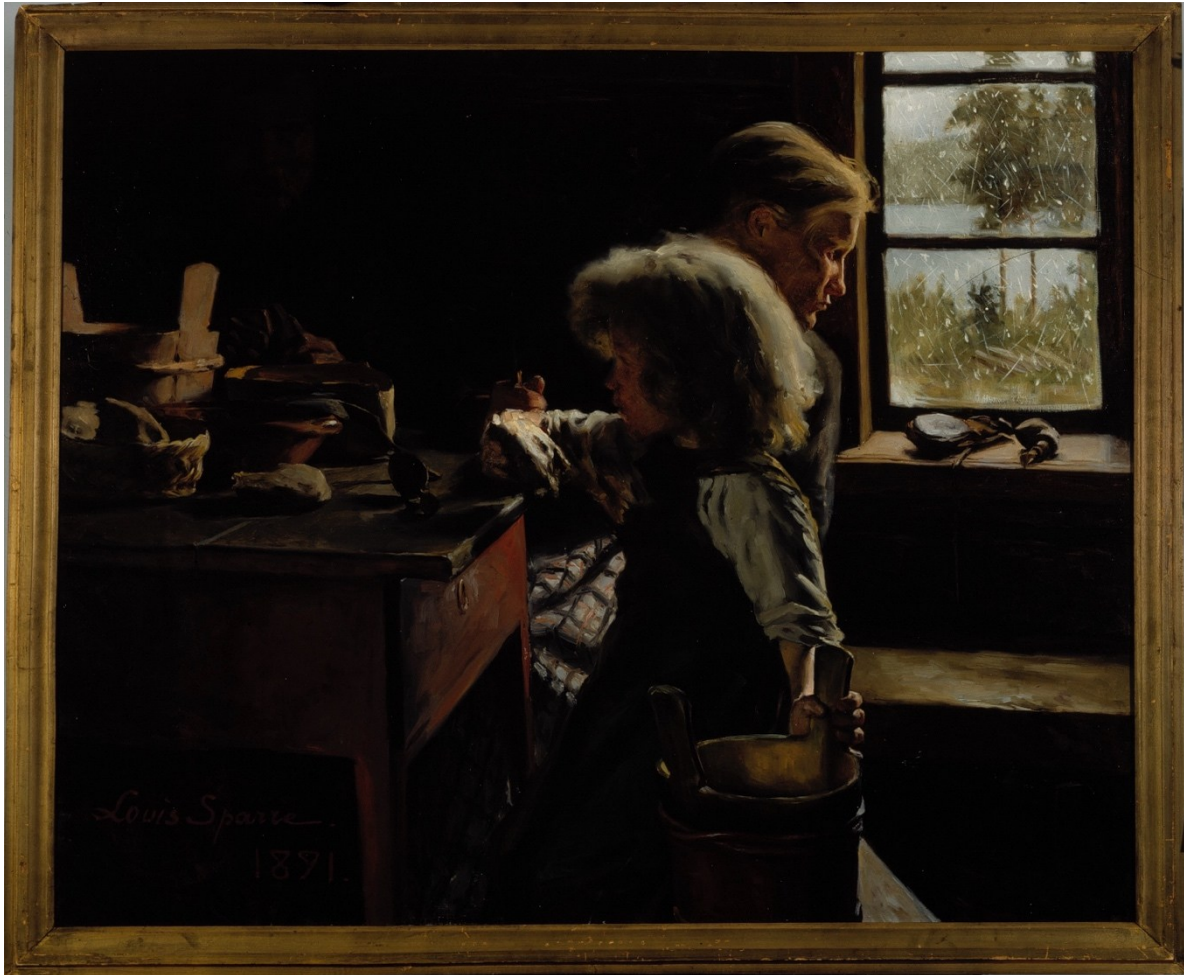
Kuva 5 Ensi lumi -teos valittiin Pariisin salonkiin, ja raati arvosti teoksen "suomalaisuutta".

Louis Sparren taiteilijauran alkuvaiheen tunnetuimpia teoksia on Ensi lumi ( Första snön ) (1891) (kuva 6). Maalaus esittää kahta henkilöä hämärässä sisätilassa. Etualalla nuori tyttö istuu pöydän ääressä nojaten oikeaa kättään pöytää vasten ja pitäen vasemmalla kädellä kiinni saavista. Tytön takana istuu aikuinen, joka on kumartunut katsomaan ulos ikkunasta. Ikkunasta näkyy maisema, jossa ensilumi pyryttää ja puut ovat vielä lumettomat. Ikkunasta tuleva valo osuu henkilöiden kasvoihin, hiuksiin ja käsiin, kun taas muu huone jää varjoon. 103