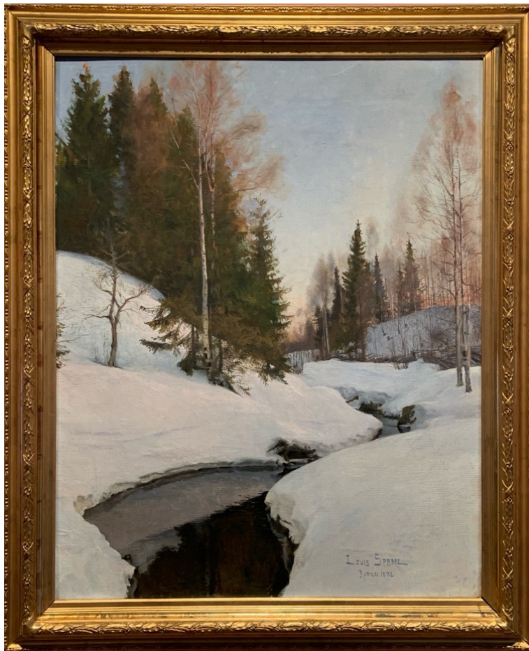
Kuva 3 Ruovedellä vuonna 1892 maalattu Kevätpuro (Värbäcken) herätti Eva Mannerheimin kiinnostuksen Ateneumissa.

Matkoillaan 1890-luvulla Kainuussa ja Vienan Karjalassa Sparre myös valokuvasi. Hänen ottamansa lasinegatiivit tarjoavat arvokasta tietoa alueen elämästä ja elinkeinoista. Vuosina 1892–1894 otetut kuvat esittävät muun muassa tervanpolttoa, tervaveneiden kuljetusta sekä Kajaanin kaupunkimaisemaa. Kuvat havainnollistavat tervakaupan keskeistä merkitystä alueelle. Hänen toimintansa ei ainoastaan tallentanut paikallista elämää, vaan myös vaikutti muiden taiteilijoiden kiinnostukseen Karjalaa kohtaan. 30