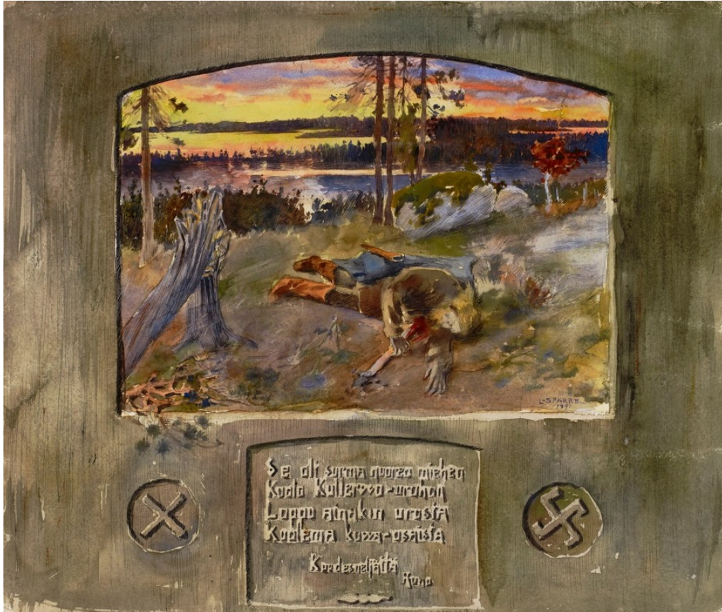
Kuva 12 Kullervon surma (1891) oli yksi kuudesta Sparren tekemästä teoksesta kilpailuun.

Sylen, kehno, kelkkahasi, retkale, rekosehesi! Vilu on olla viltin alla, kolkko korjassa eleä.