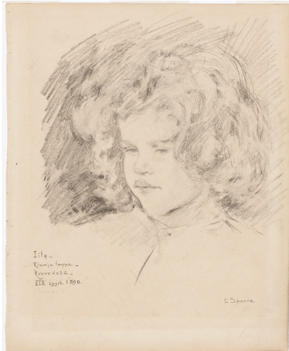
Kuva 6 Kansallisgallerian kokoelmassa on luonnos Rimmin Iitasta vuodelta 1890.

mielestä aikuisen kasvot olisi pitänyt maalata peittoon ja tytön käsi oli epäonnistunut. Taulusta kuitenkin näki, että se oli Suomesta, joka oli raadin mieleen, ja suurin osa jäsenistä äänesti taulun puolesta. 104 Kirjeestä ei selviä, mikä raadin mielestä teki taulusta suomalaisen. Mahdollisesti maalauksen synkkä tunnelma ja väritys, ulkona pyryttävä lumi tai vaaleahiuksinen lapsi.