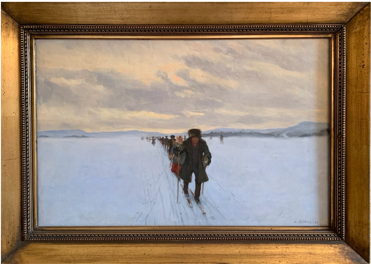
Kuva 5 Sparre teki monta versiota kyseisestä aiheesta. Kyseinen versio Kirkkoväestä jäällä on vuodelta 1896.

Teoksessa Kirkkoväkeä jäällä ( Hemvändande kyrkofolk ) (1894) Vuokatinvaara kohoaa taustalla. Sparre palasi aiheeseen useissa versioissa (kuva 5). Erityisesti pukujen yksityiskohtainen kuvaus osoittaa Sparren kiinnostusta kansanelämän esittämiseen. Maalaus