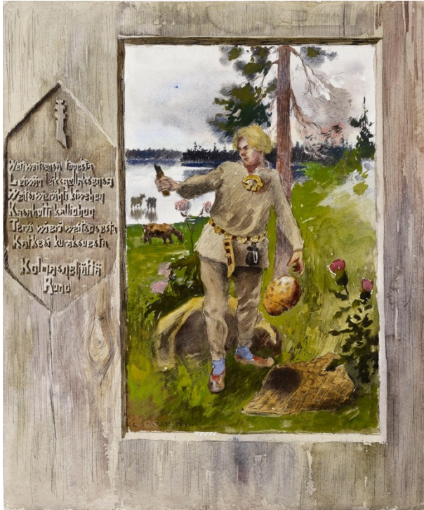
Kuva 9 Kullervo katkaisee veitsensä kiveen (1891)

Sparren kuudesta teoksesta, neljä on lahjoitettu Kansallisgalleriaan, nämä ovat Kullervo katkaisee veitsensä kiveen , Kullervo ja ”siniviitta viian eukko” , Kullervo ja hänen sisarensa reessä ja Kullervon surma , kaikki maalattuja vuonna 1891. 119