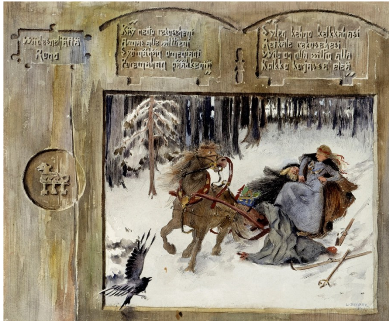
Kuva 11 Kullervo ja hänen sisarensa reessä (1891) Kuva: Kansallisgalleria / Janne Mäkinen.

Tuollapa sinun isosi, tuolla kaunis kantajasi Lapin laajalla rajalla, kalalammin laitehella.