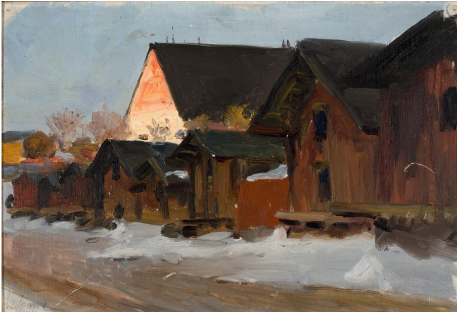
Kuva 4 Porvoo oli keskeinen motiivi Sparren teoksissa. Etenkin Porvoon kirkko toistuu hänen teoksissaan usein.

Sparre osoitti syvällistä ymmärrystä Porvoon rikkaaseen historialliseen perintöön ja sen kulttuuriseen merkitykseen. Hän ei ainoastaan tarkastellut kaupunkia esteettisestä näkökulmasta, vaan hahmotti sen osana laajempaa kansallista ja kulttuurihistoriallista kokonaisuutta. Tässä hengessä hän viittasi Porvooseen nimityksellä Runebergin kaupunki (Runebergstad) 42 , korostaen kaupungin yhteyttä Johan Ludvig Runebergiin ja tämän perintöön.