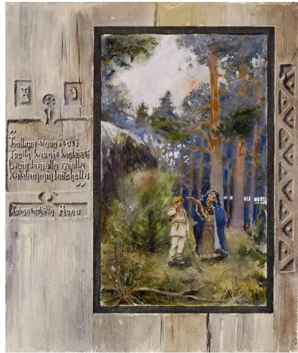
Kuva 10 Kullervo ja ”siniviitta viian eukko” (1891)

Kullervo katkaisee veitsensä kiveen (kuva 9) esittää hetkeä, jossa Kullervo huomaa veitsensä katkenneen yrittäessään leikata leipää, jonka sisään on kätkeyty kivi. Kohtaus sijoittuu järvimaisemaan, jossa taustalla näkyy laiduntavia eläimiä. Etualalla on eväskori ja maahan putoava leipä. Kullervon asu on pelkistetty, mutta sisältää koristeellisia osia, kuten vyön ja rintakorun. Runo kuvan vieressä on: