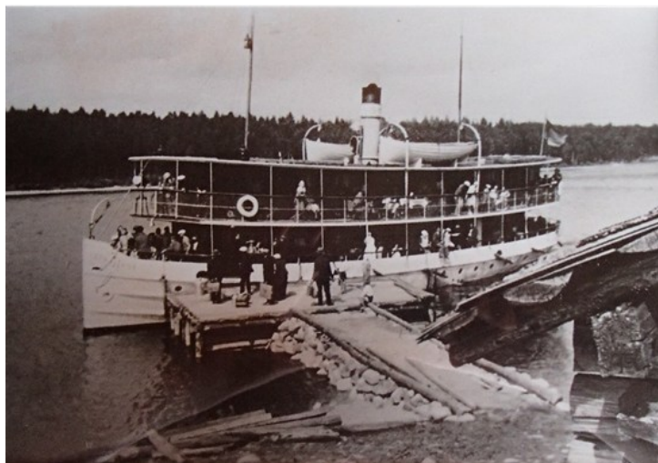
Kuva 3. Höyrylaiva Ruunaniemen laivalaiturissa Hännilässä. Kuvausvuosi tuntematon.

Katkelmassa korostuvat kiire ja hälinä, joita kirjoittaja vertaa markkinoiden hektiseen ilmapiiriin. Hän kuvaa matkustajien olleen jo menomatalla väsyneitä ja tunteneensa itsekin olonsa koitiin päästyään tavattoman väsyneeksi. Vaikuttaisi siltä, että kirjoittaja kokee kirkkomatkan mielekkyyden ja merkityksen – yhteiseen määränpähän kuljettaneen omakätisen työn ja sitä siivittäneen yhteishengen – kärsineen koneellistumisesta. Tämä saa hänet kyseenalaistamaan modernin kehityksen tarkoituksenmukaisuutta: kenen etua kehitys palvelee, jos sen intressit eivät tue inhimillistä hyvinvointia?