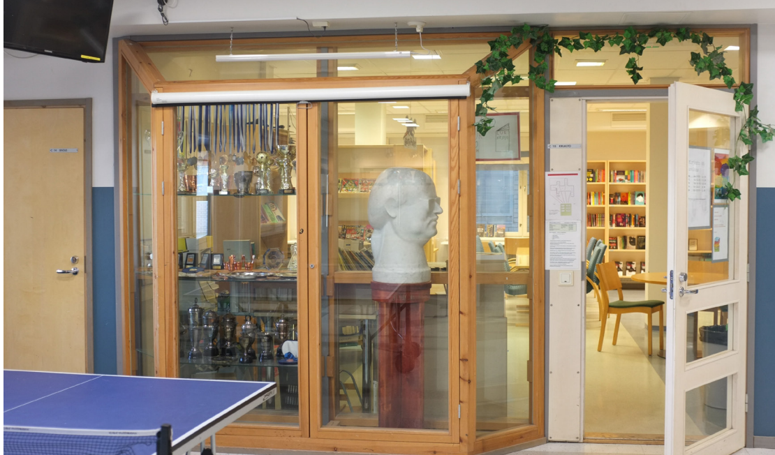
Kuva 6. Juice Leskisen muotokuva jäi Nokialle.

aineettomien käytäntöjen ja tiedon häviämiseen niin, että niistä on mahdotonta jälkepäin muodostaa kokonaisvaltaista käsitystä.