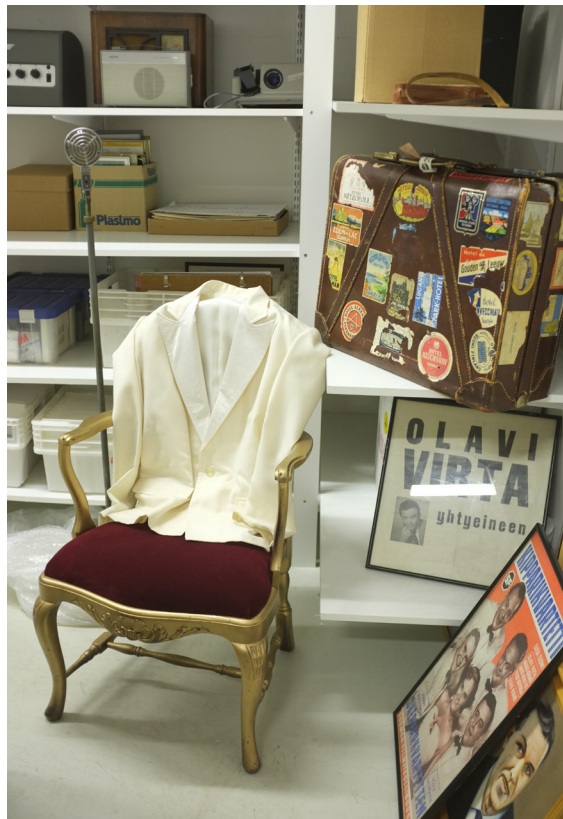
Kuva 1. Seinäjoen Tangomarkkinoiden kokoelma sisältää muun muassa laulaja Olavi Virralle kuuluneen valkoisen puvuntakin sekä ruskean matkasalkun. Esillepano kirjoittajan.

Jatkoin tekstitiedostojen rajaamista ja ryhmittelyä valitsemieni analyysikeinojen mukaisesti. Tarkastellessani musiikkikeskusten identiteetinmuodostusta hyödynsin historian tutkimukselle perinteistä kontekstualisoivaa analyysitapaa (Saarelainen 2012). Etsin tekstiaineistosta viitteitä musiikkikeskusten organisatorisista kytköksistä sekä muutoksista, jotka koskettivat hankkeiden perustamisajankohtien kulttuuriperintökenttää. Keskusten toimintaa tarkastellessani sovelsin teemoittelevaa analyysimenetelmää (Braun ja Clarke 2006). Erottelin tekstimassasta kuvauksia, jotka liittyivät musiikkikeskusten tehtäviin ja ryhmittelin näitä kuvauksia laajempiin kokonaisuuksiin. Yhdistelemällä tutkimusaineistosta tekemiäni havaintoja aikaisempaan tutkimuskirjallisuuteen muodostin lopulta kolme teemaa, joilla kuvaan artikkelissa musiikkikeskusten toimintaa (Vaismoradi ym. 2016, 106).