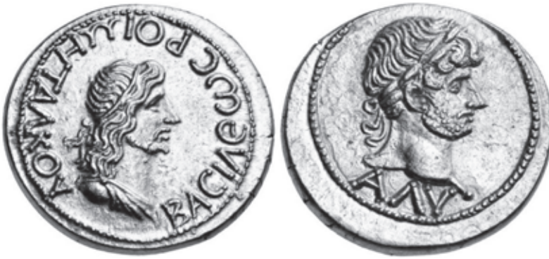
Kuningas Rhoimetalkeen kultakolikko, n. v. 134: teksti ΒΑΣΙΛΩΣ ΡΟΙΜΗΤΑΛΚΟΥ diadeemipäisen ja pitkähiuksisen profiilimuotokuvan ympärillä; kääntöpuolella keisarin Hadrianuksen profiili. RPC III 915.

oli Rooman vasalli, jonka hallitsijat olivat myös Rooman kansalaisia ja nauttivat roomalaisten varuskuntien tuomasta suojasta. Hallitsijoiden virallisessa tituluurissa esiintyivät lähes poikkeuksetta aina 300-luvulle jaa. asti nimet Filokaisar ('Caesarin ystävä') ja Filoromaioi ('roomalaisten ystävä').