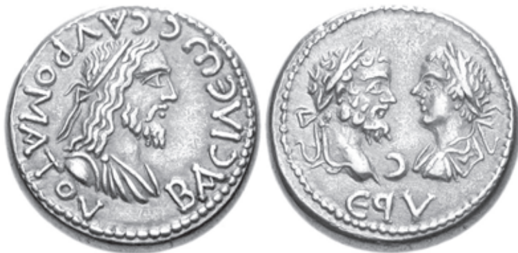
Sauromates II:n kolikko Bosporksen kuningaskunnasta, n. v. 196–197: teksti ΒΑΣΙΛΕΥΣ ΣΑΥΡΟΜΑΤΟΥY kuninkaan pitkähiuksisen ja seppelöidyn profiilimuotokuvan ympärillä; kääntöpuolella keisari Septimius Severus ja nuori Caracalla.

esiintyy hänen pitkähiuksinen ja parrakas profiilimuotokuvansa.