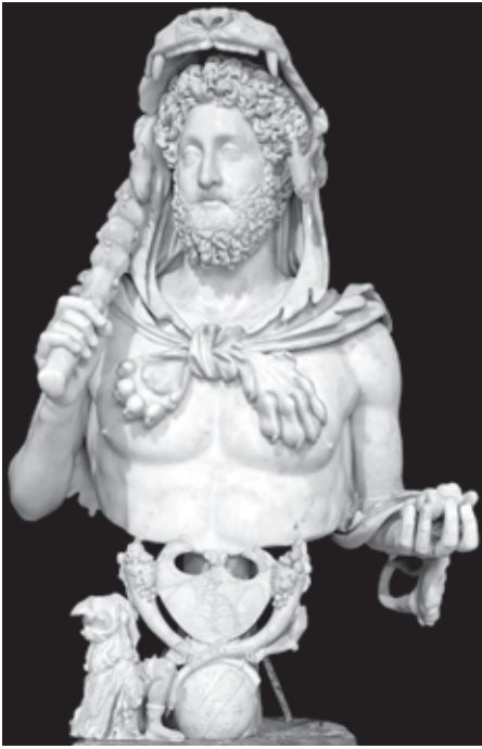
Commodus Herculeena, n. v. 192 valmistettu marmoririntakuva, Musei Capitolini (Palazzo dei Conservatori), inv. MC1120.

massa tiedossa, emme voi käyttää kaivausdataa apuna yrittäessämme tarkentaa sen ajoitusta. Akropolis-museon omassa datassa sanotaan, että se löytyi joko Dionysoksen teatterista tai laajemmin “Akropoliin juurelta” 1870-luvulla. Tarkempaa tietoa on vaikea löytää, sillä tuolloiset kaivauskäytännöt eivät juurikaan suosineet pikkutarkan – eikä aina edes summittaisen – informaation tallentamista. Joka tapauksessa Akropoliin etelärinnettä Dionysoksen teatterin ja Herodes Attikoksen odeionin välillä muokattiin ja uudelleenrakennettiin ahkerasti etenkin Hadrianuksen ja Marcus Aureliuksen hallituskausien välisenä aikana.