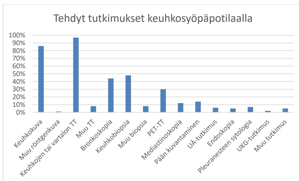
Kuva 2. Tehdyt tutkimukset ja niiden yleisyys keuhkosityöpäpotilailla.

Tutkimuksessa selvitettiin, kuinka kauan kestää ensimmäisestä lääkärikäynnistä keuhkosityöpädiagnoosiin. Arvoista laskettiin mediaani, koska yksittäiset pitkittyneet diagnoosit suurentavat keskiarvoa merkittävästi. Mediaani ensimmäisestä käynnistä diagnoosiin oli 82 vuorokautta ja läheteestä diagnoosiin oli 59 vuorokautta. Mediaani ensimmäisestä käynnistä läheteeseen oli 15 vuorokautta. (Taulukko 2.)