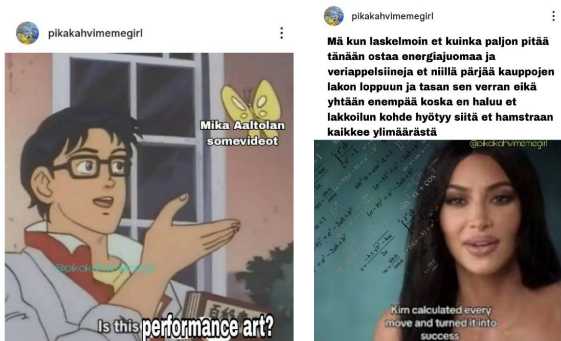
Kuvat 3 ja 4: 1. heinäkuuta 2025 julkaistu meemi ja 28. joulukuuta 2024 julkaistu meemi

Keskeistä internetmeemille on käyttäjien omien versioiden luominen jostakin, usein viraalista, sisällöstä (Shifman 2014, 42–43). Sisällön omiminen ja kierrättäminen näkyy esimerkiksi muodon ”omimisena”. Usein kuvameemeissä viraali, eli paljon jaettu ja versioitu tunnistettava meemin ulottuvuus, muodostuu meemin visuaalisesta osuudesta (Shifman 2014, 65). Esimerkiksi 1. heinäkuuta 2025 julkaistun meemin (ks. kuva 3) muoto on kuvameemi, englanniksi image macro meme , joka koostuu kuvankäsittelyohjelmalla muokatuista kuvan ja tekstin yhdistelmästä (Shifman 2014, 111). Meemissä imitoitu ulottuvuus on muoto eli kuva- ja tekstipohja: alkuperäisessä kuvassa alareunan tekstissä lukee ”Is this a pigeon?”, mutta meemin muunnelmassa on erilaisia, kontekstikohtaisia intertekstuaalisia viittauksia merkin ”pulu” kohdalla. @pikakahvimegirl-tilillä julkaistussa muunnelmassa nauretaan europarlamenttikko Mika Aaltolan droneilla kuvatuille somevideoille. Meemipohjaa 4 on käytetty kuvaamaan hämmennystä tai itsestään selvien vastausten absurdiutta, ja @pikakahvimegirl-meemi asettuu meemin jatkumoon kysymällä ironisesti, ovatko Aaltolan kotikutoiset somevideot performanssitaidetta.