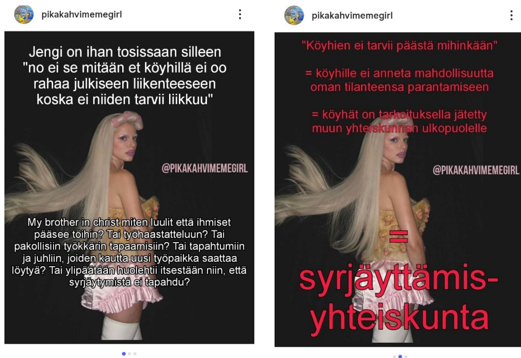
Kuvat 14 ja 15: Kuvakaappauksia 1.huhtikuuta 2025 julkaistun päivityksen meemistä (3. kuva on vaalimainos)

@pikakahvimegirl-meemeissä tuodaan esiin arkipäiväisiä vähäosaisuuden kokemuksia ja tarve, joka meemeissä usein artikuloidaan, on yhteiskunnan tuki niille, joilla on vähiten. 27. tammikuuta 2025 julkaistu meemin (ks. kuva 10, s. 39) lisäksi 1. huhtikuuta 2025 julkaistu meemi (ks. kuvat 14 ja 15) neuvottelevat siitä, mitä hyvinvointivaltion tulisi merkitä. Meemin kuvapohjana on kuva vaaleanpunaiseen asuun pukeutuneesta Julia Foxista, joka on yhdysvaltalainen näyttelijä, malli ja seurapiirijulkimo. Meemi käsittelee julkista liikennettä, köyhyyttä ja työttömyyttä.