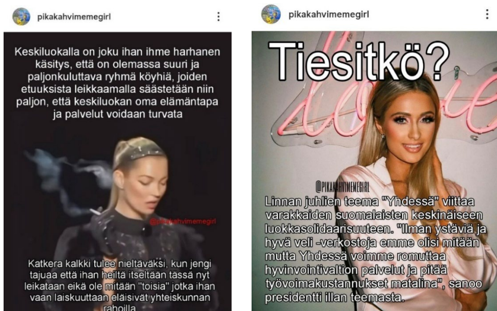
Kuvat 10 ja 11: 27. tammikuuta 2025 julkaistu meemi ja 6. joulukuuta 2024 julkaistu meemi

”Katkerä kalkki tulee nieltäväksi, kun jengi tajuaa että ihan heiltä itseltään tässä nyt leikataan eikä ole mitään ”toisia” jotka ihan vaan laiskuuttaan eläisivät yhteiskunnan rahoilla”