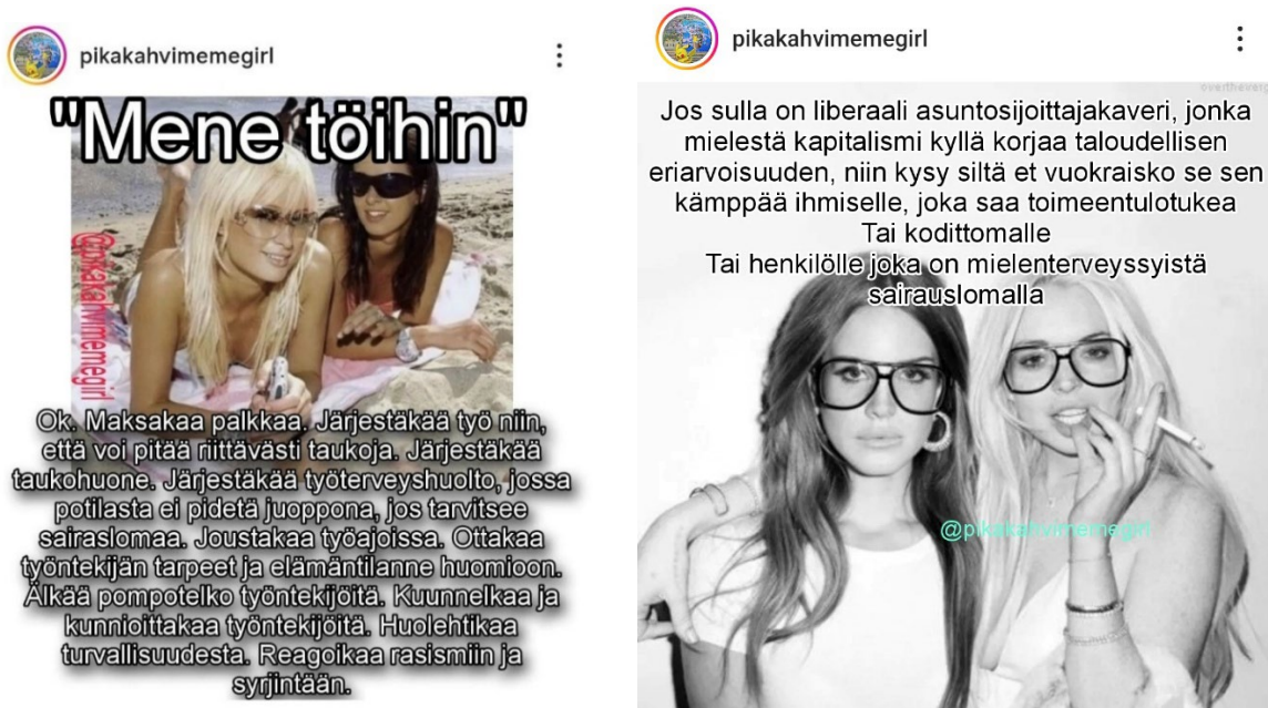
Kuvat 19 ja 20: 13. joulukuuta 2024 julkaistu meemi ja 25. tammikuuta 2025 julkaistu meemi

Meemin edustama kuvasto näennäisesti suhteellisen vaivatonta, kiireetöntä ja helppoa elämää elävistä rikkaista naisista, jotka kuitenkin ovat hyvin menestyneitä, on provokatiivista erityisesti suomalaisen yhteiskunnan ja työntekoa, ahkeruutta ja nöyryyttä arvostavan työkuulttuurin kontekstia vasten tarkasteltuna. Varsinkin lausahdus ”Mene töihin” yhdistettynä Paris Hiltonin ja Kim Kardashianin estetiikaltaan tyttömäiseen kuvaan on ristiriitaisuudessaan humoristinen ja provokatiivinen, sillä esimerkiksi Hilton nousi julkisuuteen The Simple Life -tosi-tv-ohjelman (2003–2008) myötä. Siinä Hilton ja Nicole Richie menevät esimerkiksi maatilalle ”oikeisiin” töihin. ”Mene töihin” -meemissä hemmotellut tytöt latovat kovia faktoja pöytään, ja siten esimerkiksi Paris Hilton merkitsijänä ja tämän edustama tyttömäinen toimijuus merkittynä näyttäytyy vakuuttavana ja tosissaan otettavana. Meemi luettelee esimerkkejä niistä asioista, joiden katsotaan olevan työelämässä puutteellisia työntekijän näkökulmasta, kuten esimerkiksi tauot, työterveys sekä rasismiin ja syrjintään reagointi. Osa esimerkeistä, kuten työntekijöiden kuuntelu ja kunnioittaminen tai riittävä palkka, ovat asioita, joita voisi pitää itsestäänselvyytenä. Koska meemi kuitenkin mainitsee ne, vastaanottajalle asetetaan kysymys, voiko niitä pitää sellaisina ja onko työntekijän asemassa jotain parannettavaa?