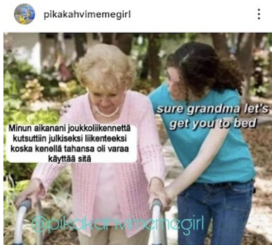
Kuva 5: 29. lokakuuta 2025 julkaistu meemi

itseironista: meemi käsittelee kaupanalan lakkoja, ja kuvailee liioittelun avulla minäkertojan äänellä miten vähäisillä eväillä pärjätä lakkojen yli käymättä kaupassa. Affiliatiivisen ja itsenironisen huumorin tavoite on ryhmän yhteishengen vahvistaminen. Affiliatiivisen huumorin ja aggressiivisen huumorin kohteet ja funktiot eroavat toisistaan, sillä aggressiivinen huumori kohdistuu johonkin toimijaan, vastustajaan, ja sitä käytetään vastustajan legitimeetin horjuttamiseksi. (Koivukoski ym. 2024, 75–78.)