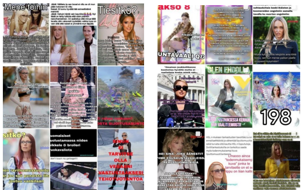
Esimerkkejä @pikakahvimegirl-tilin esteettisestä ilmeestä. Ensimmäisessä kuvakaappauksessa on meemejä ajalta 26.3.2024 – 13.12.2024, toisessa kuvakaappauksessa ajalta 27.2.2025 – 24.3.2025.