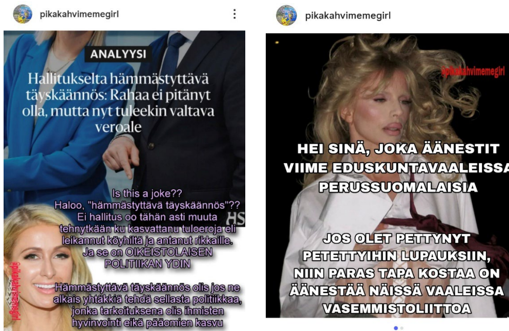
Kuvat 23 ja 24: 24. huhtikuuta 2025 julkaistu meemi ja 11. maaliskuuta julkaistu meemi

merkityksen taakse. Myytti puolestaan voi tarvittaessa ”piiloutua” objektikielen merkityksen taakse. Myytti ja sen toimintalogiikka ovat rinnastettavissa hegemonian ja diskurssin käsitteisiin. 27. helmikuuta 2025 julkaistu meemi nimeää hegemonisen diskurssin – ”keskiluokkanormin” – jota se kritisoi. @pikakahvimegirl-meemit purkavat hegemonisen diskurssin argumentaation logiikkaa, jota voisi @pikakahvimegirl-meemien omin sanoin kutsua keskiluokkanormiksi. Meemit toimivat mytologin tavoin: ne purkavat porvarillisia myyttejä, tai keskiluokkaisia ja neoliberaalin diskurssin kyllästämiä merkityksenantoja, ja tekevät käsitteen merkitykseen kohdistuvan vääristymän näkyväksi. (Barthes 1994/1957, 189, 204–205.)