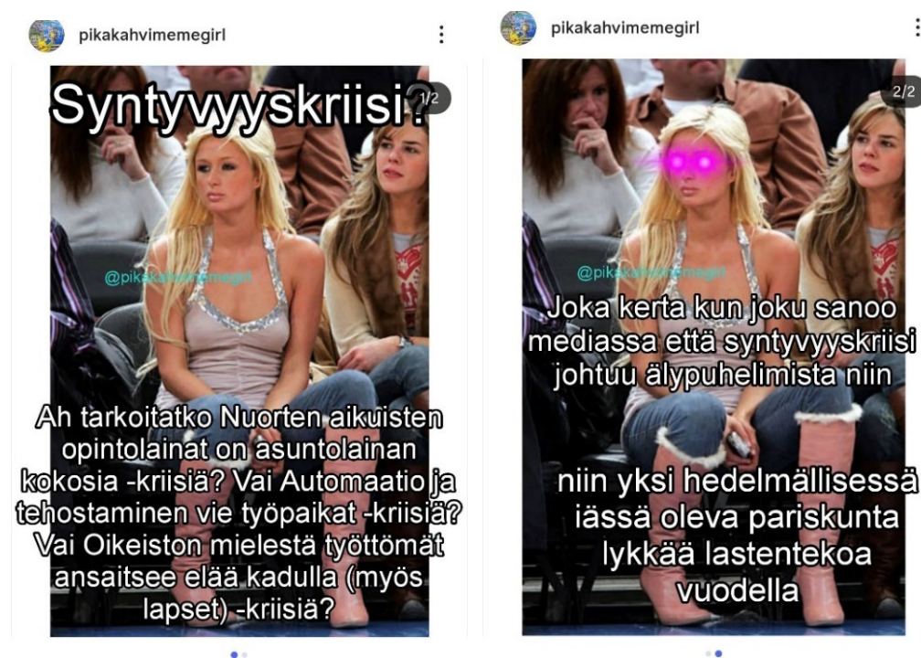
Kuvat 21 ja 22: 22. syyskuuta 2025 julkaistu meemi

Näitä ovat esimerkiksi huumeiden käyttöhuoneet, jota käsitellään 27. helmikuuta julkaistussa meemissä (ks. kuvat 8 ja 9, s. 37), tai 22. syyskuuta 2025 julkaistussa meemissä purettu ”syntyvyyskriisi”. Kommentoidessaan yhteiskunnallisia keskusteluja @pikakahvimegirl-meemit haastavat valtakurssia esimerkiksi nimeämällä sen mukaisen tulkinnan määrittämät ilmiöt uusiksi. 22. syyskuuta 2025 (kuvat 21 ja 22) julkaistussa meemissä otetaan kantaa ”syntyvyyskriisiin” eli syntyvyyden laskuun.