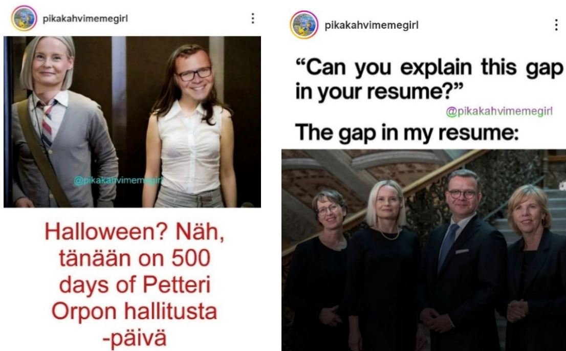
Kuvat 12 ja 13: 29. lokakuuta 2024 sekä 23. syyskuuta 2025 julkaistut meemit

29. lokakuuta 2024 julkaistussa meemissä (ks. kuva 12) pohjana on kuva ”500 Days of Summer” -elokuvan (2009) kohtauksesta, jossa päähenkilöt ovat hississä. Näyttelijöiden päiden kohdalle on kuvankäsittelyllä ”lätkäisty” Riikka Purran ja Petteri Orpon hymyilevät kasvot. Kuvan alla on valkoisella pohjalla oranssi teksti: ”Halloween? Näh, tänään on 500 days of petteri orpon hallitusta -päivä”. Kuvateksti jatkaa: ”Tai ainakin mun kalenterissa luki niin”. Meemissä kritisoidaan hallitusta ironian ja analogian keinoin.