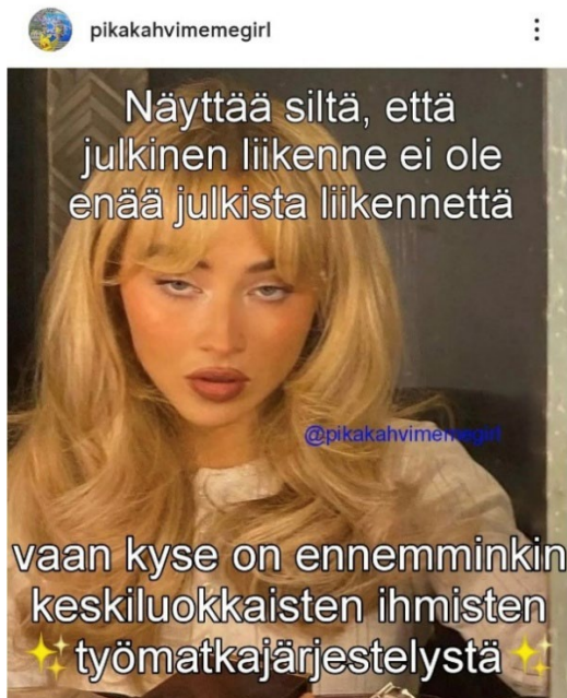
Kuva 16: 31. lokakuuta 2024 julkaistu meemi

teemoista (ks. esimerkiksi 17.3.2025 julkaistu Instagram-päivitys). Luvussa 2 käsitellyn, 29. lokakuuta 2025 julkaistun meemin (ks. kuva 5, s. 21) lisäksi esimerkiksi 31. lokakuuta 2024 (ks. kuva 16) ja 28. helmikuuta 2025 (ks. kuvat 17 ja 18, s. 47) julkaistut meemit käsittelevät julkista liikennettä. Meemit ovat usein liittyneet keskusteluun Helsingin seudun julkisen liikenteen lippujen hinnankorotuksista (ks. esimerkiksi Oksanen 2025).