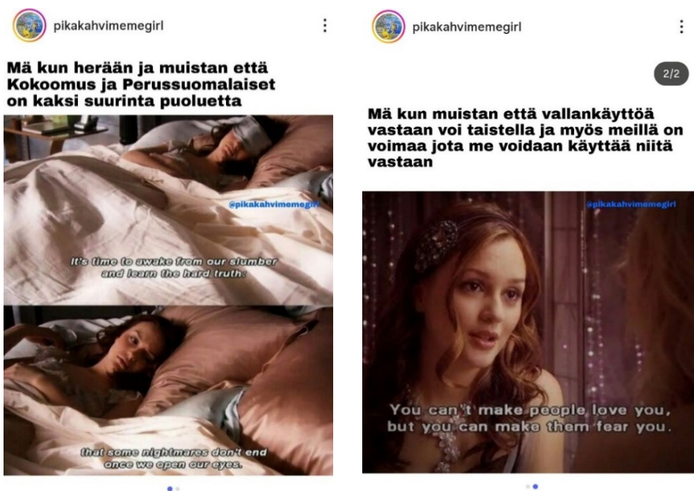
Kuvat 1 ja 2: 3. huhtikuuta 2023 julkaistu meemi