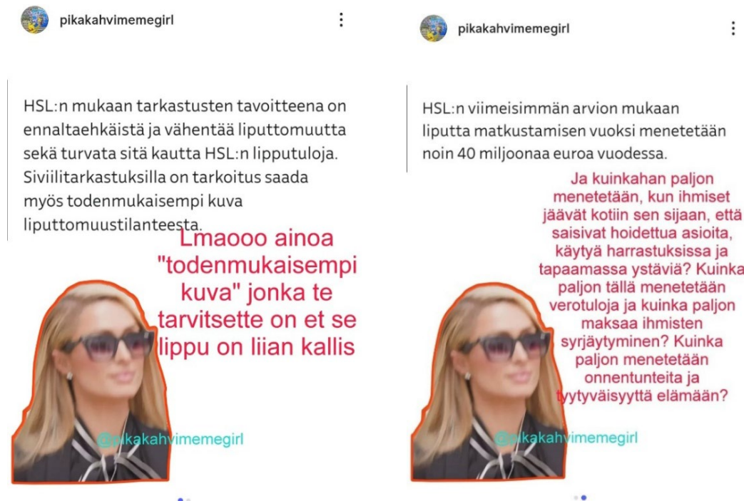
Kuvat 17 ja 18: 28. helmikuuta 2025 julkaistu meemi