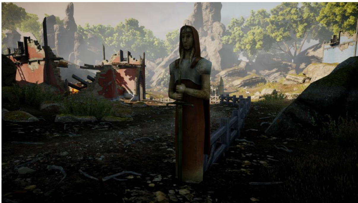
Kuva 1. Pyhimys Andrasten patsas Orlais'n maaseudulla.

Käsiteltävistä patsaista ensimmäinen sijaitsee Orlais'n valtakuntaan kuuluvalla Exalted Plains -nimisellä alueella. Ennen ihmisten asuttama maaseutu on nyt sisällissodan myötä lähes kokonaan autioitunut ja monin paikoin tuhoutunut (Bioware 2015, kuvaus alueesta; Gelinas et al. 2013, 273).