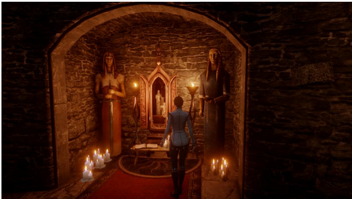
Kuva 2. Pelaajan hahmo yksityisen rukousalttarin ääressä.

Toisessa kuvassa näkyvä yksityinen kotialttari koostuu kahdesta Andrastea kuvaavasta patsaasta sekä koristeellisesta alttarikaapista, ja se on sijoitettu syvästi uskonnollisen ja järjestäytyneen kirkon parissakin toimineen Leliana-hahmon työhuoneen oheen (Gelinan et al. 2015, 86). Kuva on otettu pelattavan hahmon väliaikaisena kotina ja tukikohtana toimivassa Skyhold-linnakkeessa, joka sijaitsee maantieteellisesti Orlais'n ja Fereldenin valtakuntien välimaastossa.