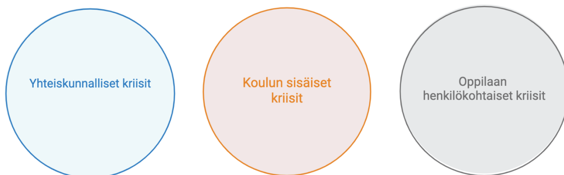
Kuvio 1. Kriisitilanteiden kolmijakoisuus

Tässä tutkimuksessa kriisitilanteet on jaettu teoreettisessa taustassa kolmeen eri yläteemaan, yhteiskunnallisiin kriiseihin, koulun sisäisiin kriiseihin ja oppilaan henkilökohtaisiin kriiseihin. Tutkimuksen teoreettisen taustan kolmijako on esitetty alla olevassa kuviossa 1 ja niitä avataan seuraavissa alaluvuissa.