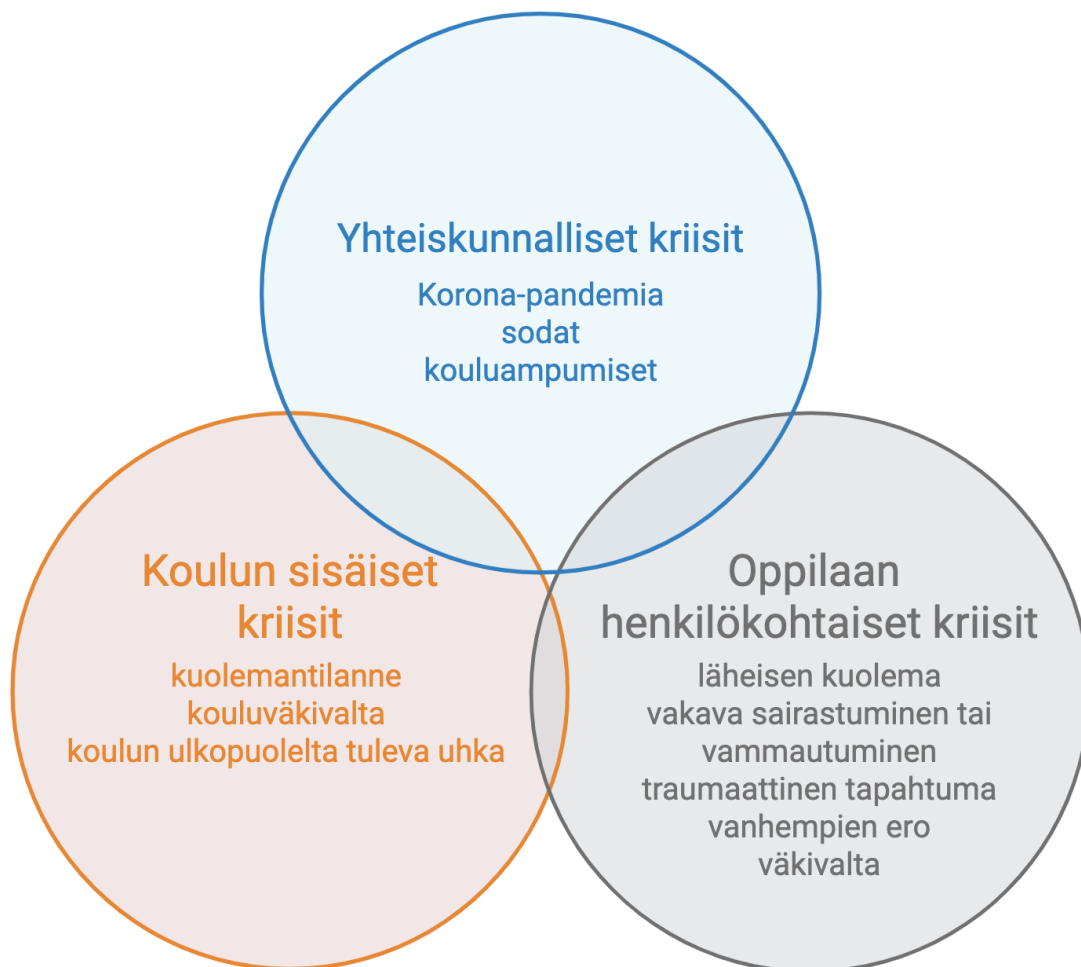
Kuvio 3. Tutkimuksessa havaitut oppilaan elämän kriisitilanteet ja niiden sekoittuvuus toisiinsa.

kokemuksia, jotka usein näkyvät myös koulussa ja ovat merkityksellisiä myös oppimisen kannalta (Greiner ym., 2022, s. 2).