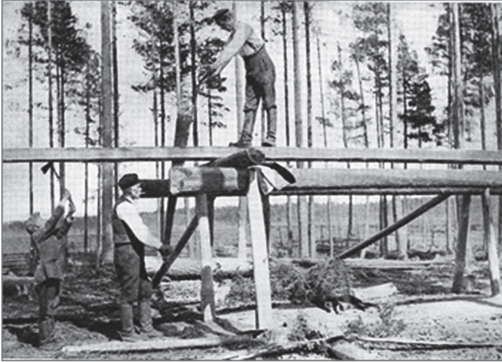
Lankkujen sabausta Laviassa Keskimäen talon luona. Kuvassa näkyvät ylä- ja alasahuri. Yläsahurin tarkoituksena oli pitää huoli siitä, että saba kulki suoraan.

tehokas, sillä kuljetuskustannukset nostivat helposti puiden hankintahinnan niin korkeaksi, että se söi jo alun perin pienen voittomarginaalin olemattomiin. Näin ollen vuokratyömiesten käyttö oli mahdollista ainoastaan kaupungin välittömässä läheisyydessä, josta puutavarantuotantoon soveltuvat metsät alkoivat hiljalleen huveta. 26