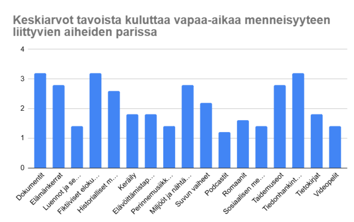
Kuvio 2. Keskiarvot tavoista kuinka usein osallistajat kuluttavat vapaa-aikaansa menneisyyteen liittyvien aiheiden parissa. Kuvioiden alla selitteet tavasta kuluttaa aikaa.

Kuviosta huomattavissa, että osallistujien useimmiten käyttämä tapa kuluttaa vapaa-aikaansa historian parissa on hakea tietoa liittyen historiallisiin tapahtumiin, sekä henkilöihin. Keskiarvo tällä tavalla oli hieman yli kolme, joka tarkoitti, että osallistajat kuluttavat vapaa-aikaansa tämän parissa keskimäärin hiukan alle joka kuukausi. Muita osallistujien useammin käyttämiä tapoja olivat dokumenttien ja fiktiivisten elokuvien katselminen. Osallistujien selkeästi harvimminkin käytettävät tavat olivat jo aikaisemmin esiin nousseet menneisyyteen sijoittuvien videopelien pelaaminen ja perinmemusiikin kuunteleminen/perinnetanssien tanssiminen, sekä historian aiheisiin liittyvien podcastien kuunteleminen.