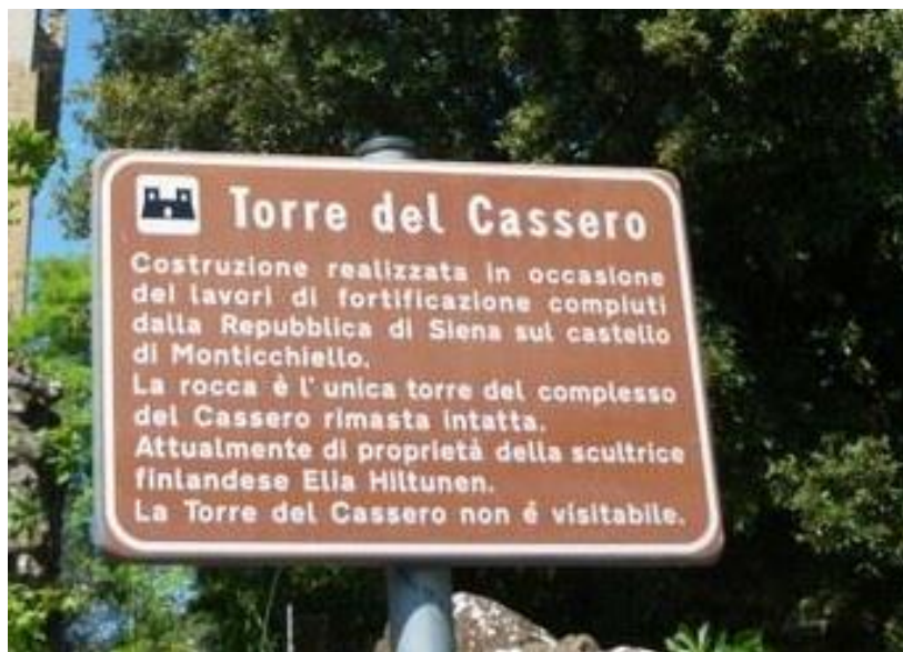
Fig. 16. La torre del cassero non è visitabile.