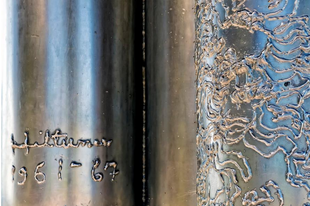
Fig. 22. Firma d'autore, nell'acciaio.

persone sperimenta nella propria esistenza. Che io abbia o no successo nel mio lavoro, le mie opere rimangono per le generazioni a venire. Così mi viene data un'altra opportunità, anzi molteplici opportunità, per continuare a vivere tramite il mio lavoro, anche quando non ci sarò più. 293