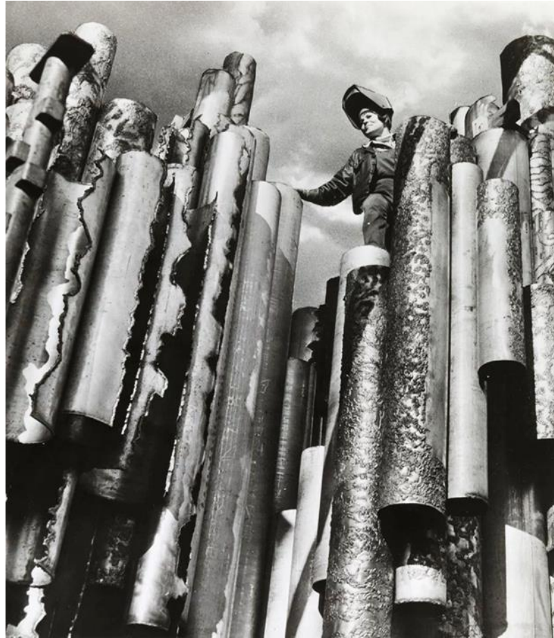
Fig. 7. Tutti gli elementi della scultura saldati insieme.

La Fiat Pininfarina Coupé 1965 102 e la scultrice vestita di una elegante salopette da lavoro furono viste nel parco Sibelius a Töölö, per tutta la primavera del 1967. Tutti gli elementi della scultura, lavorati nello studio di Lauttasaari, vennero allora saldati insieme. 103