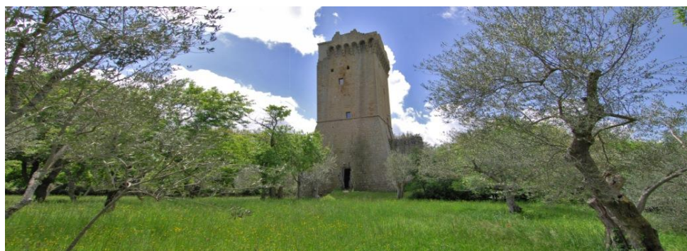
Fig. 15. I merli della torre si degradarono nel corso degli anni, tuttavia Eila Hiltunen non ricevette l'autorizzazione dall'ufficio del museo per ripararli nella loro forma originale.

La fiducia della Hiltunen nel progetto, così come la sua grande forza di volontà, lo portarono a compimento, anche se mi sembra un peccato, che non abbia ricevuto l'autorizzazione dall'ufficio del museo per riparare i merli della torre nella loro forma originale. Comprensibilmente, questi sarebbero stati nuovi elementi aggiunti, ma comunque credo che avrebbero avuto un impatto positivo sulla sopravvivenza della torre e sicuramente ne avrebbero influenzato positivamente l'aspetto.