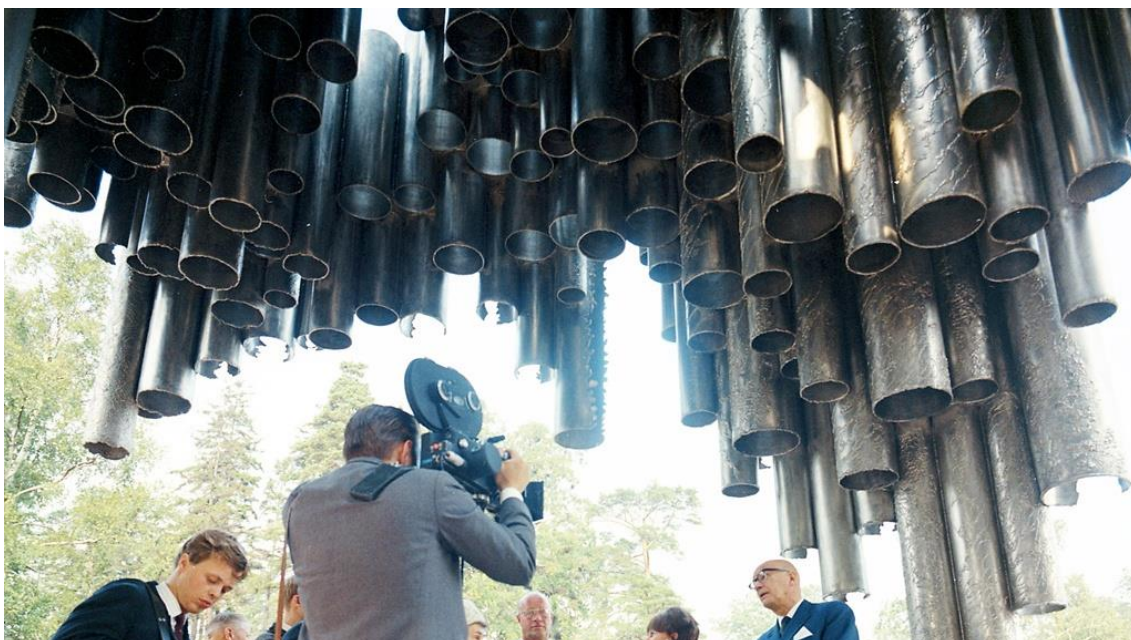
Fig. 11. Un'immagine dell'inaugurazione del monumento a Sibelius.