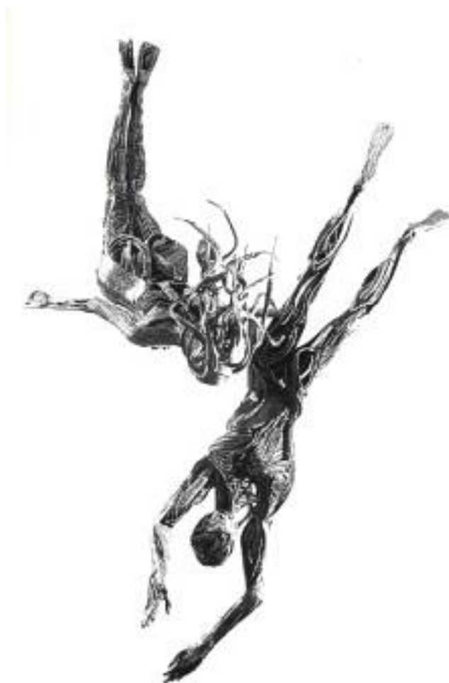
Fig. 9. Sott'acqua .