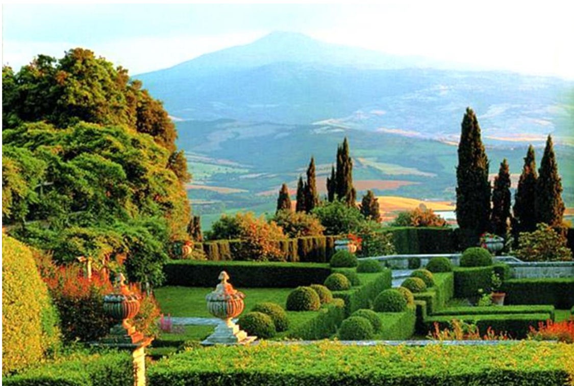
Fig. 17. Panorama da La Foce

Immagini e ombre. Aspetti di una vita. 219 Ogni anno in luglio presso La Foce si svolge il Festival musicale Incontri in Terra di Siena , in memoria di Iris e Antonio Origo. 220