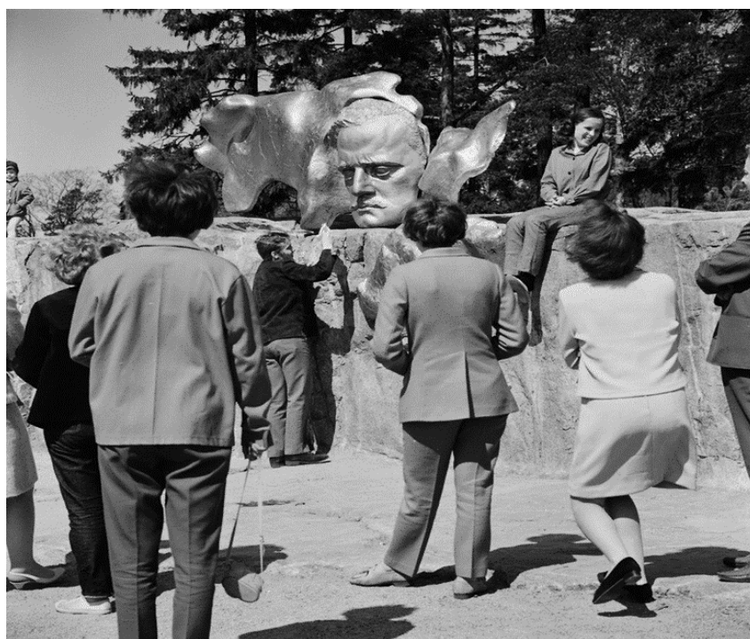
Fig. 6. Turisti al Parco Sibelius nel 1968.

Più tardi, nel 1975, il presidente della Società Sibelius Severi Saarikivi chiese alla Hiltunen se ritenesse necessario spostare il ritratto di Sibelius in un altro posto, per esempio nella Finlandia-talo 87 , che è un'istituzione molto importante per la cultura finlandese. Ma l'artista rispose: Lasciate che resti al suo posto, a testimoniare la mentalità di quel tempo e come le cose sono state risolte e completate. 88