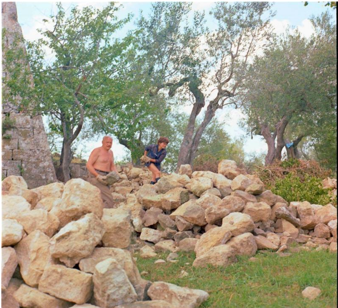
Fig. 18. I coniugi lavorano insieme.