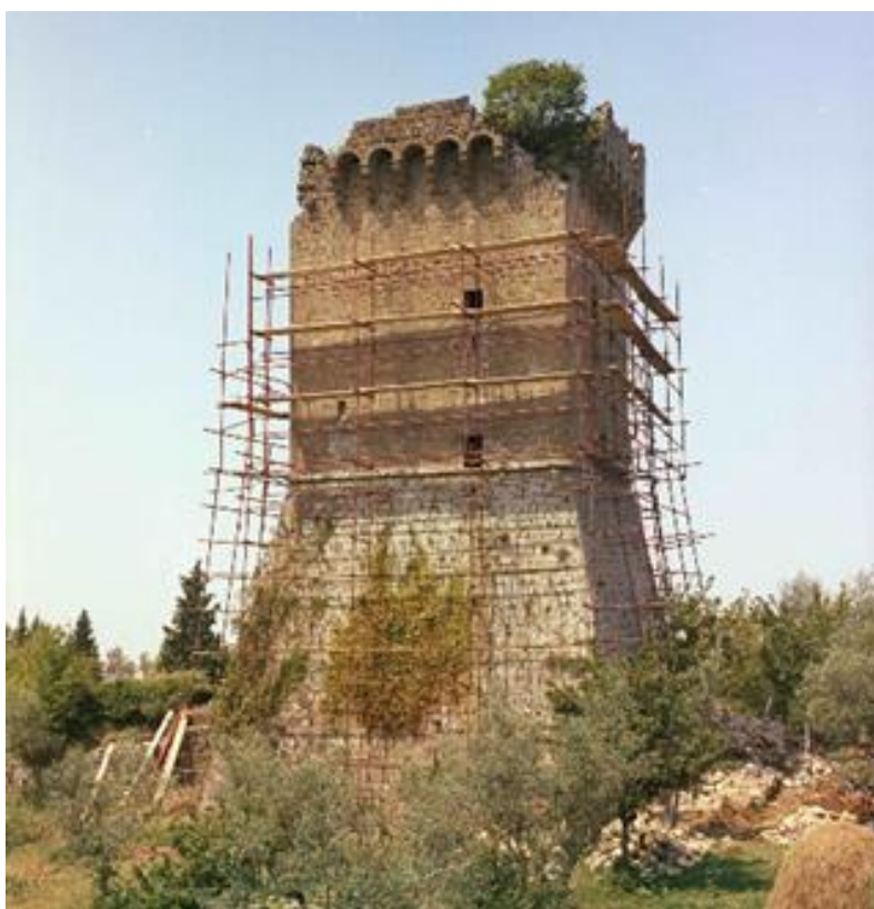
Fig. 14. La Torre all'inizio dei lavori.