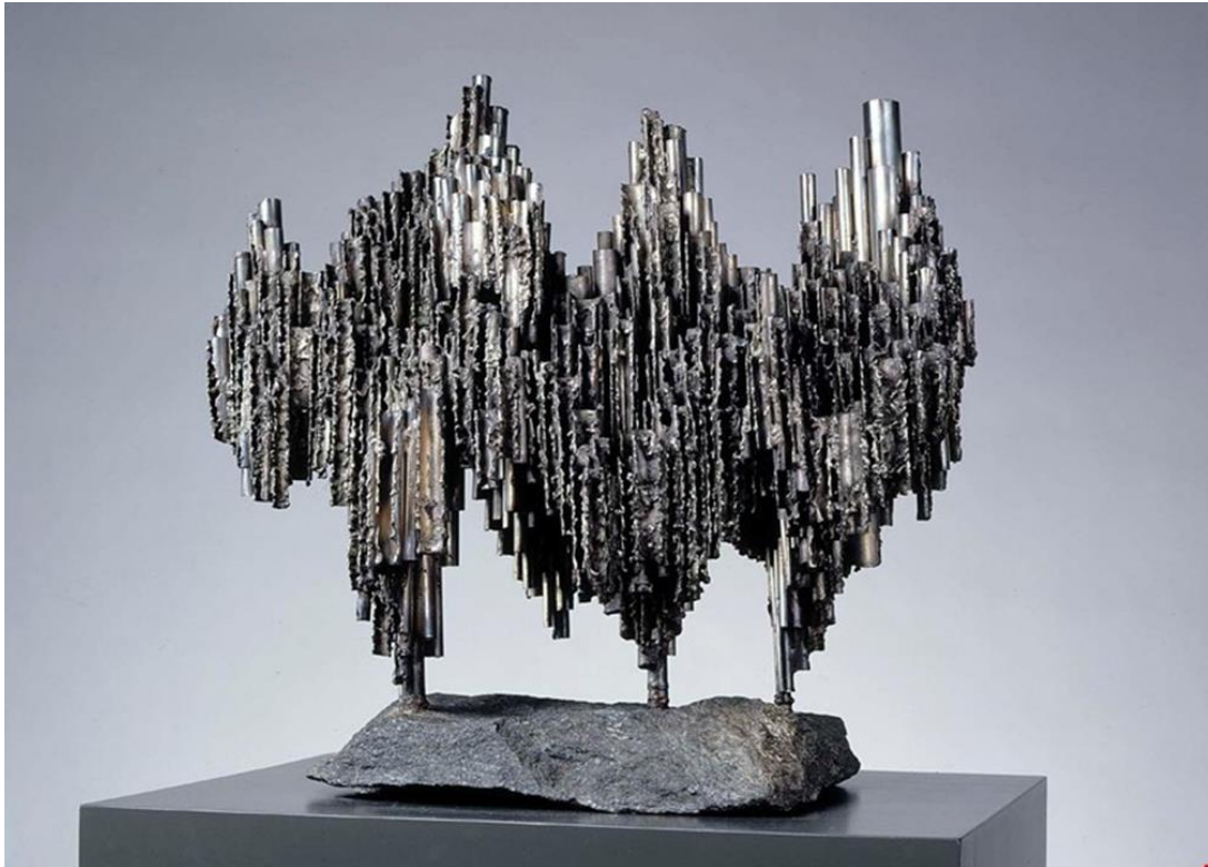
Fig. 5. Passio Musicae : bozza finale per il monumento a Sibelius.

L'opera che partecipò alla seconda fase del concorso, Passio Musicae , poggiava su queste tre gambe in modo indipendente, senza un piedestallo. L'opera comprendeva anche la progettazione del parco in cui sarebbe stata posta la scultura, quello che poi sarebbe diventato il Sibeliuspuiisto (parco "Sibelius"): il progetto lodevole venne elaborato, in stretta collaborazione con la Hiltunen, dal giovane architetto del paesaggio Juhani Kivikoski e dal fotografo Otso Pietinen, marito dell'artista.