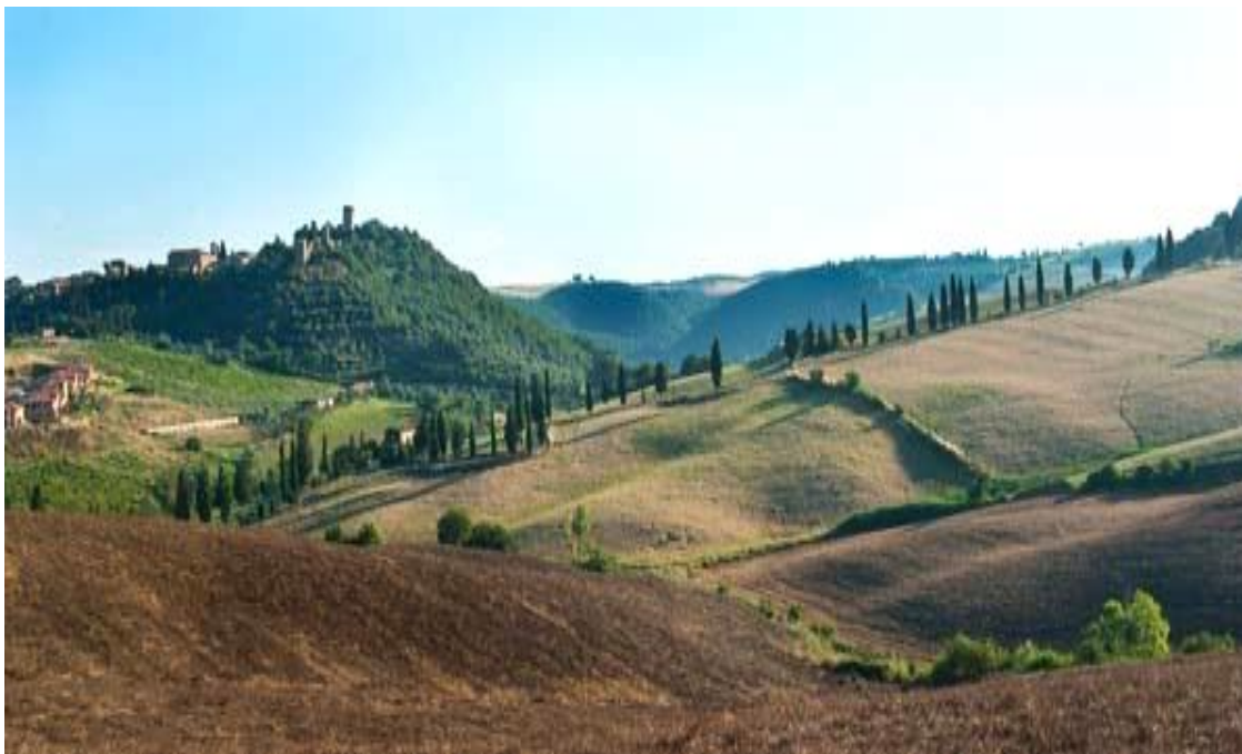
Fig. 10. Panorama della Val d'Orcia con la Rocca di Monticchiello in cima alla collina. 140