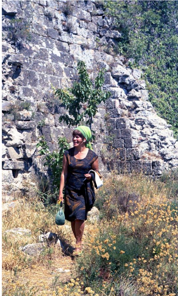
Fig. 13. La scultrice felice