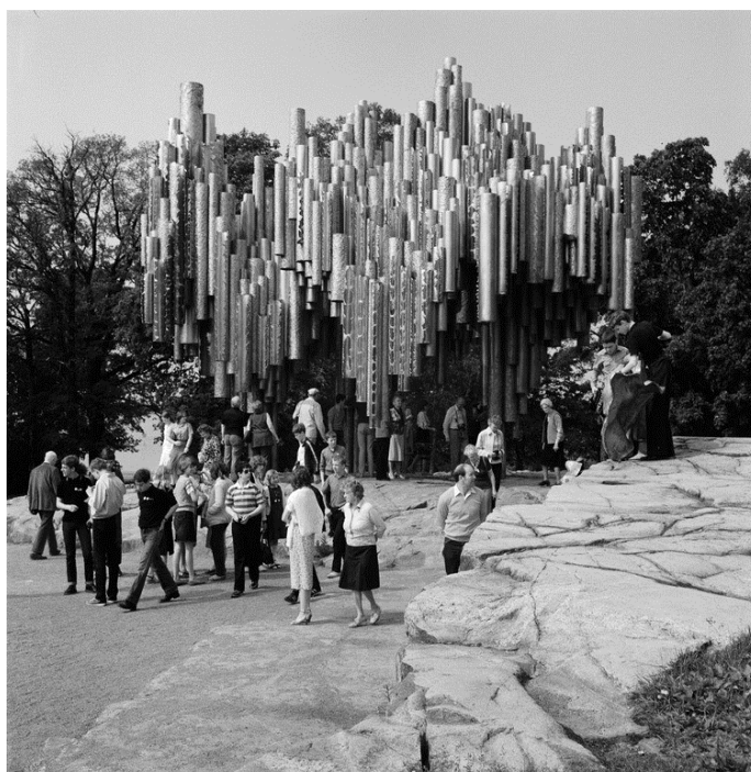
Fig.8. Un'immagine dell'opera nel 1981.

Secondo Uusikylä l'individuo creativo è in grado di vedere nuove connessioni tra concetti, materiali e pensieri. 112 La liberazione della forma e dell'espressione della scultura era dunque un cambiamento in cui si passava dalla realtà esteriore alla realtà interiore. 113 L'intuizione e l'espressione personale si elevano per sostituire la narrazione realistica. Il vero tema del monumento è la coesistenza di assenza e presenza: un'occasione fisica concreta per entrare nell'opera, per sperimentare la propria presenza in relazione all'assenza di chi viene ricordato. 114 L'esperienza di un'opera di arte è inoltre un dialogo con l'opera, la storia, l'oggetto dell'opera e i suoi riferimenti nonché, in ultima analisi, con la storia propria dell'opera stessa.