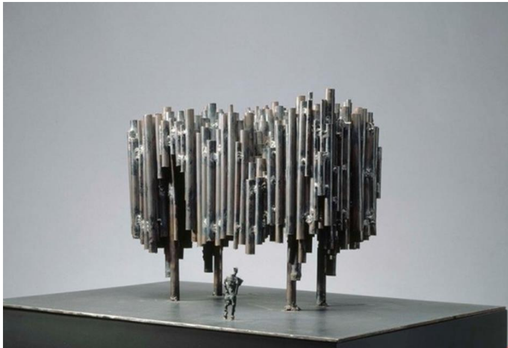
Fig. 2. Credo : prima bozza per il monumento a Sibelius (1961).

Così, secondo Ahtola-Moorhouse, il monumento pubblico era cambiato, riconoscibile come opera del proprio autore, a cui si autoriferiva attraverso i materiali e la tecnica usati. 68 Proprio il fatto di adottare un'espressione personale di artista ha probabilmente rappresentato il più grande cambiamento della nuova espressione. 69