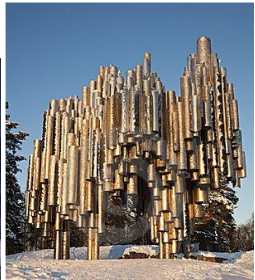
Figg. 3-4. La somiglianza tra il Duomo di Milano e il monumento a Sibelius (che viene in questo caso evidenziata maggiormente dagli effetti di luce).