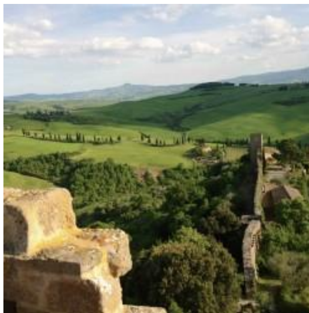
Fig. 12. Il paesaggio della Val d'Orcia visto dalla Torre.

allarmante. Aveva lavorato al monumento per sei anni, avvolta da tutte le emozioni che sentiva per esso. E un bel giorno, ecco che non era più suo. 161 Il marito Otso riteneva che l'atmosfera culturale aggressiva, dura e spietata di New York avrebbe avuto un effetto terapeutico per Eila, per curare la depressione apatica in cui era sprofondata dopo aver terminato quell'opera. La città statunitense avrebbe avuto l'effetto di uno shock, 162 avrebbe scosso le acque stagnanti dell'apatia. Quindi Eila Hiltunen si diresse a New York, 163 dove il Console Generale di Finlandia organizzò festeggiamenti in suo onore e il periodico Look Magazine fece apparire un grande articolo sul monumento a Sibelius. La Hiltunen incontrò un agente importante, il contatto di un direttore del Guggenheim, il quale le disse che solo Michelangelo aveva realizzato le sue opere da sé, che era di moda il minimalismo, cioè niente di così complicato come la sua scultura. “Povera ragazza, hanno approfittato di te; ti hanno pagato troppo poco!” Lei si arrabbiò e ribatté: “Ma io non sono una povera ragazza, ho addirittura appena acquistato un castello in Italia!” 164 New York non le piaceva ma il viaggio la scosse davvero dall'apatia. Decise di avviare subito il restauro della torre e quindi partì alla volta di Monticchiello 165