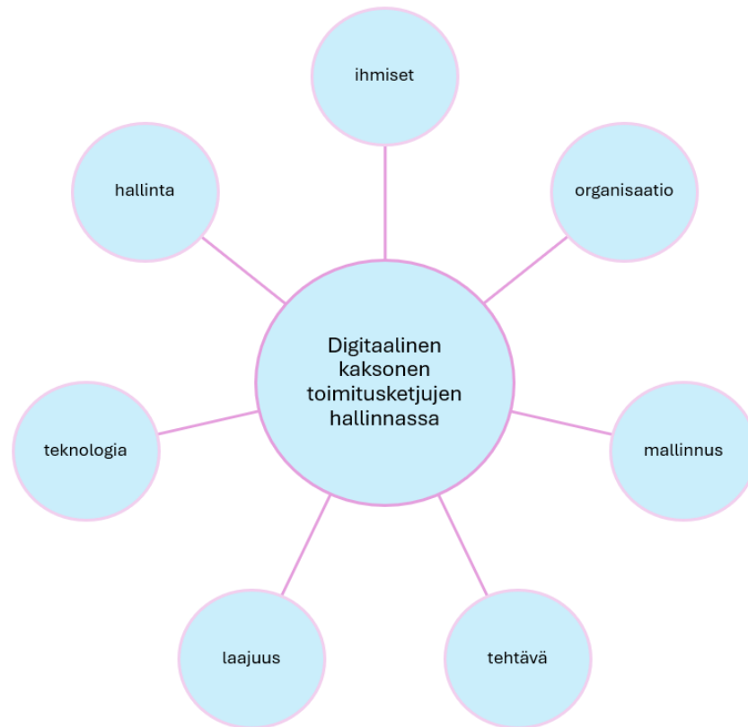
Kuva 2 Toimitusketjun digitaalisen kaksosen viitekehys (Ivanov 2024)

Ivanov (2024) korostaa teknologian osuutta viitekehyksessään, koska se on digitaalisen kaksosen perusta. Luvussa 2.3 mainittujen teknologioiden lisäksi hän nostaa esiin muun muassa big data-analytiikan, blockchain-teknologian, kyberfyysiset järjestelmät, robotiikan, RFID-teknologian ja ERP-järjestelmät. Teknologiat mahdollistavat mallien integroinnin ulkoisten tietolähteiden kanssa ja varmistavat vuorovaikutuksen muiden digitaalisten kaksosten kanssa. Viitekehyyksen mallinnus liittyy myös läheisesti teknologiaan analytiikkaominaisuuksiensa takia. Mallinnus voi toimia päätöksenteon tukena niin, että ihmiset tekevät kuitenkin lopulliset päätökset, tai ne voivat olla tekoälyn toteuttamia. Laajassa mielessä digitaalisia kaksosia voidaan pitää eri tietojärjestelmien ja -mallien yhdistelminä.