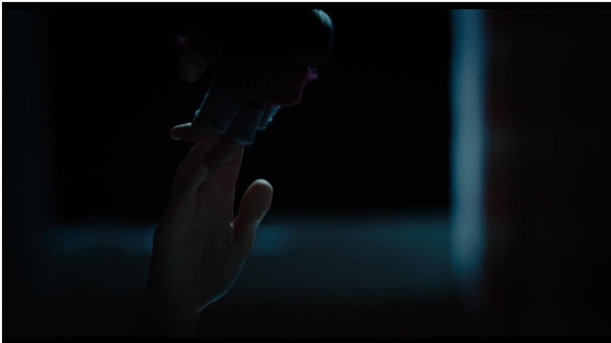
Kuva 14. Taistelun lopussa Needy ja Jennifer pitävät toisiaan kädestä vielä viimeisen kerran. Kuvakaappaus.

Jenniferin ja Needy'n välinen romanttinen sävy sinetöidään elokuvan loppua kohden suudelmalla. Jennifer odottaa Needyä Needy'n makuuhuoneessa tämän The Evil Dead -paita päällä. Jennifer suutelee Needyä, joka vastaa suudelman intohimoisesti. Needy kuitenkin vetäytyy pian pois ihmetellen, mitä tapahtuu. Jennifer sanoo kiusoitellen: "Come on. Let me stay the night. We can play "boyfriend and girlfriend" like we used to". Jenniferin kommentti tyttö- ja poikaystävän leikkimisestä voidaan tulkita kauaskantoisempuna romanttisena vireenä tyttöjen välillä. Leikin avulla he ovat mahdollisesti voineet toteuttaa tunteitaan täysin toisilleen kuitenkin sitoutumatta romanttisessa mielessä. Jenniferin demoniksi antautuminen ja siihen liittyvä estottomuus voi olla syy siihen, miksi tämä suuteli Needyä reilusti ilman leikkejä.