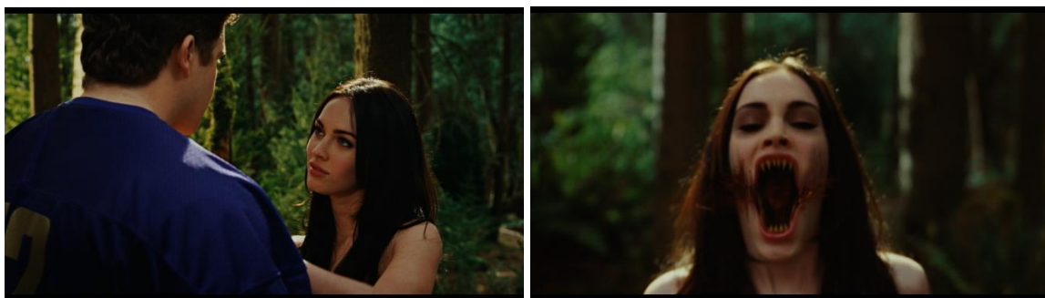
Kuvat 1–2. Jennifer viettelemässä uhriaan, minkä jälkeen iskee tähän kiinni. Kuvakaappauksia.