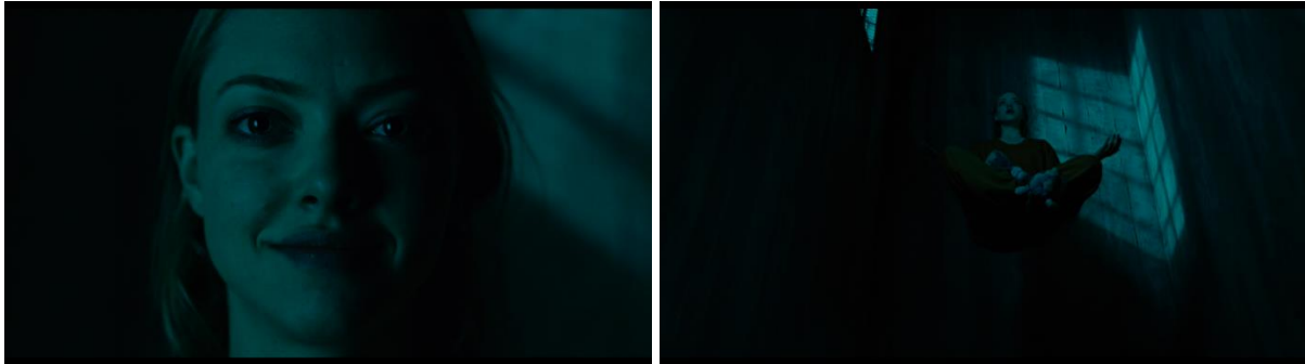
Kuva 4–5. Demoninen final girl. Puputossut ja sellissä leijuminen korostavat Needyn sisäistä ristiriitaa. Tämä on toisaalta edelleen teinityttö ja toisaalta voimakas demoni. Kuvakaappaukset.

elokuvan ja tarinan alkuun. Lopussa, jossa palataan alun takaumaan eli Needyn nykyhetkeen, siirrytään kertojajäänestä nykyaikaan. Needyn kertojajääni toteaa: ”You might get lucky for once in your miserable life”, minkä jälkeen hän hymyilee kameralle itsetietoisesti ja katsojalle paljastuu tämän leijuvan ilmassa eristyssellissä puputossut jalassa (kuvat 4–5).