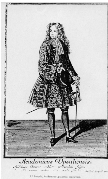
Academicus Upsaliensis, n. 1700.