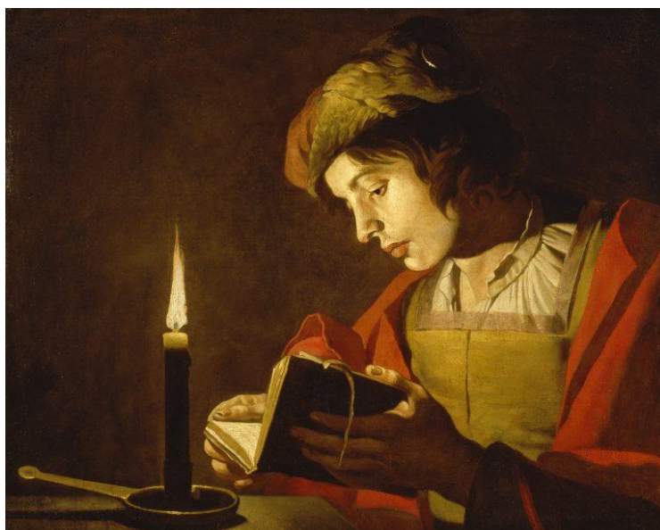
Nuori mies lukemassa kynttilän valossa, Matthias Stom n. 1630