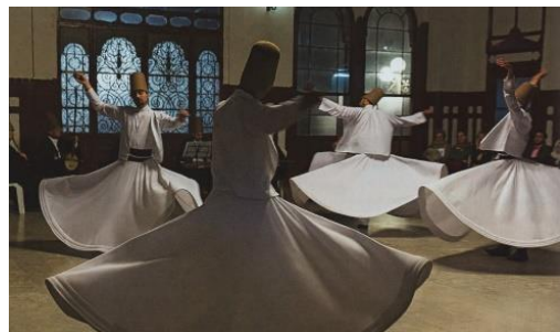
Aineiston kuva 10. (Lackström et al. 2016, 64.)

Evangelisluterilaisen uskonnon oppikirja nostaa suufilaisuuden myös esille. Kyseisen kuvan 10 kuvateksti kertoo suufilaisuudesta enemmän kuin elämäkatsomustiedon vastaavan kuvan kuvateksti. Kuvatekstissä kerrotaan suufilaisen liikkeen olevan islamin mystiikkaa. Tämän lisäksi kuvatekstistä