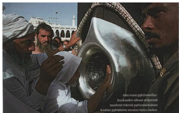
Aineiston kuva 26. (Lackström et al. 2016, 69.)

Islamin perinteisiin liittyen on uskonnon oppikirjasta löydettävissä kaksi valokuvaa. Toisessa on kuvattuna pelkkiä miehiä ja toisessa pelkkiä naisia. Miehiä sisältävässä kuvassa 21 on neljä miestä kuvan etualalla. Kuva on kooltaan 10,7cm x 16,8cm. Kolme miehistä on