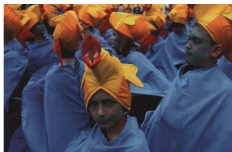
Aineiston kuva 20. (Lackström et al. 2016, 40.)

Toinen juutalaista juhlaperinnettä representoiva kuva 15 on juutalaisesta purim-juhlasta. Asia selviää kuvatekstistä. Kuvatekstissä selitetään myös, että kyseisessä juhlassa on lupa hullutella. Tämän tarkemmin juhlasta ei kerrota sanallisesti. Kuvassa katse kohdistuu kuvan keskellä