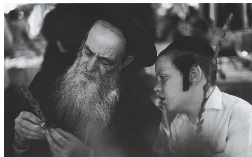
Aineiston kuva 21. (Lackström et al. 2016, 46.)

Kolmas juutalaista juhlaa representoiva kuva 16 on mustavalkoinen, jossa on vanha parrakas mies sekä nuori pulisongit omaava poika. Vaikka usein kirkkaat värit antavat kuvalle huomiota, voi myös ainoa