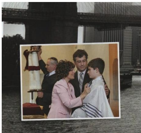
Aineiston kuva 19. (Lackström et al. 2016, 38.)

Uskonnon oppikirjassa kristinuskoon ensisijaisesti perinteeseen liittyvää kuvaa ei ole puolestaan löydettävissä. Sen sijaan juutalaiseen perinteeseen liittyviä on jopa seitsemän ja islamiin liittyviä kaksi. Ensimmäinen juutalaiseen perinteeseen liittyvä kuva on juutalaisuuteen johdattavalla aukeamalla. Kuvassa 14 on etualalla valkoiseen pukeutunut poika, vaaleanpunaiseen pukeutunut nainen, kravattiin ja mustaan pukuun pukeutunut mies. Asuilla luodaan selvää kontrastia, jolloin kuvan nainen sekä poika korostuvat vaalealla pukeutumisella. Kontrasti myös lisää kuvan huomioarvoa (Hatva 1993, 55).