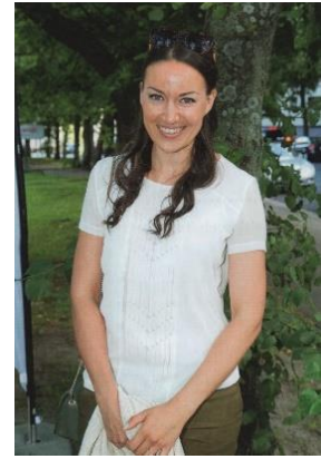
Aineiston kuva 9. (Calonius et al. 2018, 88.)

Elämäkatsomustiedon oppikirja on valinnut uskonnon sisäistä monimuotoisuutta kuvaavan kuvan 9 myös naisesta, jonka moni suomalainen tunnistaa tutuksi kasvoksi. Katsoja voi tunnistaa kyseisen naisen tutuksi televisiosta. Kuvateksti kertoo myös, että kyseessä on Jasmin Hamid, joka on sekä näyttelijä että kunnallispoliitikko. Hänellä on päällään valkoinen t-paita sekä vihreät housut. Hänellä on myös vihreä laukku ja käsissään jokin neuleelta näyttävä kangas. Hänen sormessaan on nähtävillä myös kihla- tai vihkisormus.