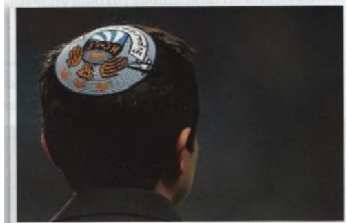
Aineiston kuva 25. (Lackström et al. 2016, 45.)

Viimeinen juutalaista perinnettä representoiva kuva 20 liittyy juutalaiseen päähineeseen. Kyseessä on tietysti kipa. Kuvassa on pojan pää takaa päin, jolloin pääläella oleva kipa näkyy hyvin. Kuva on hyvin tumma, mutta kipa loistaa sinisen, valkoisen ja keltaisen värisenä. Värien