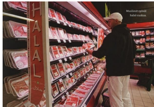
Aineiston kuva 2. (Lackström et al. 2016, 71.)

Uskonnon oppikirjassa puolestaan nostetaan esiin islamiin liittyvä ruokakulttuuri osana näkyvää kulttuuria. Kuvassa mies seisoo kaupan hyllyn edessä katsoen kädessään olevaa pakkausta. Hyllyillä on selvästi lihapakkauksia ja miehen kädessä näin ollen lihapakkaus. Hyllyssä, kuvan 5 etualalla, lukee isoin