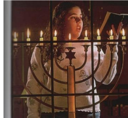
Aineiston kuva 23. (Lackström et al. 2016, 43.)

Viides juutalaisten juhlaperinteisiin liittyvä kuva 18 on oppikirjojen kuvista kaikkein vaikeimmin tulkittavissa oleva, sillä kyseisen kuvan yhteydessä ei ole kuvatekstiä. Kuvassa on tyttö, joka seisoo menoran näköisen kynttelikön takana. Tyttö ja kynttelikkö ovat mahdollisesti ikkuna takana. Tytöllä on kädessään kirja, jota hän pitää kasvojensa korkeudella kuvan oikealla puolella. Kuvassa huomio kiinnittyy etenkin tytön