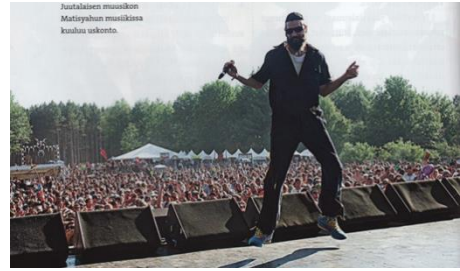
Aineiston kuva 4. (Lackström et al. 2016, 44.)

Uskonnon oppikirjassa on myös juutalaisuuden ja kristinuskon osalta esitetty niiden vaikutuksia ympäröivään kulttuuriin. Juutalaisuuden osalta esitetään juutalaisuuden vaikutusta musiikkiin. Kuva 7 on sivuun nähden suuri (10,0cm x 18,0cm), joten huomio kiinnittyy kuvaan