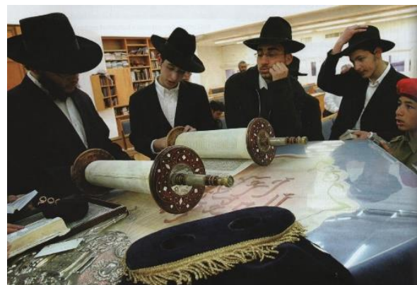
Aineiston kuva 24. (Lackström et al. 2016, 42.)

Myös muita juutalaisia perinteitä on representoitu juhlien lisäksi. Yksi tällainen on kuva 19 neljästä nuoresta miehestä ja yhdestä pojasta, jotka tutkivat Tooraa. Neljällä nuorella miehellä on päällään valkoinen kauluspaita ja musta puvuntakki. Päässään heillä on hatut. Kukin heistä