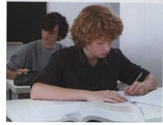
Aineiston kuva 3. (Lackström et al. 2016, 63.)

Uskonnon oppikirjassa myös toinen kuva 6 viittaa uskonnon vaikutuksesta kulttuuriin ja yhteiskuntaan, mutta on kooltaan huomattavasti pienempi (5,0cm x 6,5cm). Islamia käsittelevän kappaleen johdannon yhteydessä on kuva kahdesta pojasta, jotka opiskelevat pöytiensä takana. Pojat istuvat peräkkäin. Kuvassa itsessään ei ole mitään