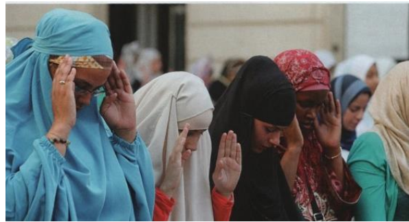
Aineiston kuva 27. (Lackström et al. 2016, 66.)

Myös toinen kirjassa oleva islamiin liittyvä perinne kertoo miesten ja naisten erottelusta. Keskenään kuvat ovat saaneet kokonsa puolesta lähes saman verran huomiota, sillä naisia sisältävä kuva 22 on kooltaan 7,9cm x 14,7cm. Kuvassa on etualalla