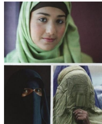
Aineiston kuva 11, 12, 13. (Lackström et al. 2016, 70.)

Uskonnon oppikirja tuo esille toisenkin kuvan, josta välittyy islamin sisäinen monimuotoisuus. Kuva muodostuu oikeastaan kolmesta kuvasta 11 , joilla on yhteinen kuvateksti. Jokaisessa kuvassa on kuvattu musliminaisen kasvoja. Kuvat on aseteltu niin, että yksi kuvista on kahden muun kuvan yläpuolella ja on näin isompi kuin kaksi alapuolella olevaa kuvaa. Yläpuolella oleva kuva on naisesta, jolla näkyvät koko kasvot, mutta hiukset ja kaulan alue on vihreän huivin peitossa.