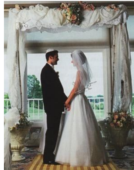
Aineiston kuva 22. (Lackström et al. 2016, 48.)

Juutalaisesta juhlaperinteestä on vielä neljäskin kuva. Kyseessä on juutalaiset häät. Kuvassa 17 on nähtävissä mustaan pukuun ja valkoiseen kipaan pukeutunut seisova mies, jonka vastapäätä seisoo valkoiseen huntuun ja valkoiseen mekkoon pukeutunut nainen. He seisovat vastakkain ja pitävät toisiaan kädestä. Katse ohjautuu jälleen henkilöiden kasvoihin, sillä kasvot kiinnittävät huomion voimakkaasti kuvissa (Hatva 1993, 59). Molemmat myös hymyilevät toisilleen. Kuvateksti ohjaa lukijaa myös katsomaan hääparin yläpuolella olevaa katosta, joka on koristeltu kukilla ja valkoisilla kankailla. Kuvateksti kertoo, että kyseessä on juutalainen hääkatos, huppa. Kyseinen katos symboloi kotia, jonka hääpari rakentaa yhdessä. Kuva ja teksti yhdessä kertovat nähdäkseni hyvin, kuinka perinteen sisällä on myös muita perinteitä. Juutalaiseen hääperinteeseen ilmeisesti kuuluu tietynlainen pukeutuminen hääparilla