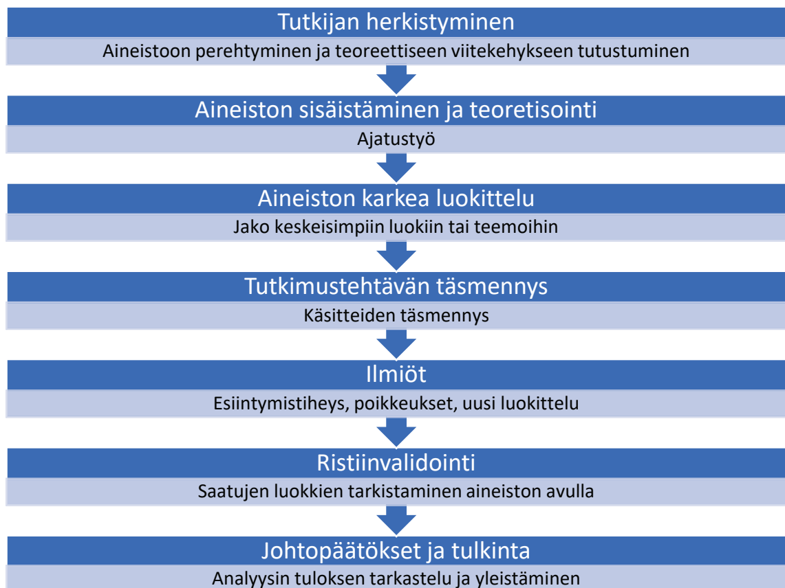
Kuvio 2. Sisällönanalyysin vaiheet Syrjäläistä (1994) mukaillen

Tutkimuksen analyysimenetelmäksi valikoitui sisällönanalyysi. Sen avulla on mahdollista purkaa laajojakin aineistoja tarkasti ja systemaattisesti. Alla on kuvattu Syrjäläisen (1994) malli sisällönanalyysin etenemisestä vaiheittain. Toteutimme tutkimuksen aineiston analyysivaiheen mukaillen tätä mallia. (Syrjäläinen 1994, 90.)