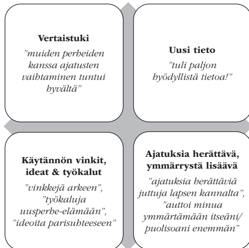
Kuvio 2. Uusperheiden aikuisten kokemat hyödyt interventiotesta.

Kaikkien ammattilaisten mielestä ryhmätapaamisista oli hyötyä uusperheille. Hyödyistä nostettiin esille muun muassa perheiden saama tieto uusperheistä sekä käytännön vinkit ja neuvot. Vertaistuesta saatu apu