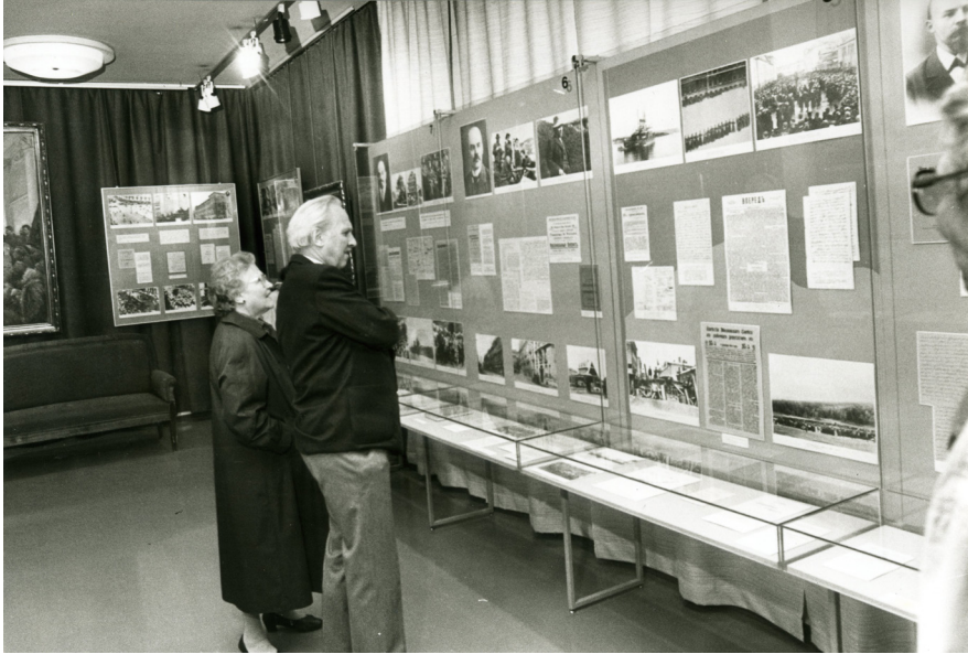
Kuva 6. Museon näyttely 1980-luvulla.

matiivisempi. Suomea käsittelevään osuuteen lisättiin tietoa lokakuun vallankumouksen vaikutuksesta Suomen poliittiseen ja valtiolliseen asemaan ja niiden vaihteluihin. Jo aiemmassa näyttelyssä esillä olleet tiedot Leninin suhteista Suomeen ja suomalaisiin säilytettiin. 51 Näyttelyuudistus oli päälinjoiltaan onnistunut, mutta sisälsi virheitä tekstien osalta ja oli museon vuosikertomuksen mukaan myös esineistönsä puolesta puutteellinen. Niinpä museon johto koki, että näyttelyä oli tarvetta uudistaa varsin pian edellisen uudistuksen jälkeen. Vuonna 1983 näyttelyn ensimmäinen osio, Leninin elämästä ja työstä kertova sali uudistettiin kokonaan. Muutoksia tehtiin myös vuonna 1985, jolloin museo sai lisää tilaa samassa rakennuksessa olevalta Tampereen Työväen Teatterilta. Remontin yhteydessä Lenin ja Suomi -osioon lisättiin esineitä, kuten karttoja ja pienoismalleja liittyen Leninin vaiheisiin Suomessa. 52