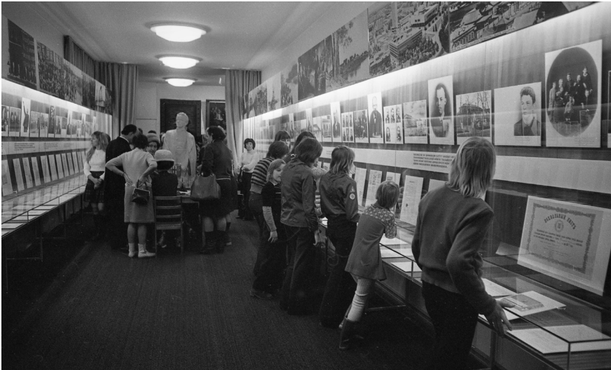
Kuva 5. Neuvostoliittolaisia ja suomalaisia pioneereja vierailulla vuonna 1975.

Viimeinen suurempi perusnäyttelyn uudistus ennen Neuvostoliiton romahtamista toteutui vuosina 1979 ja 1980. Museotila myös remontoitiin samassa yhteydessä. Uudistuksen pyrkimyksenä oli sitoa Leninin toiminta aiempaa tiiviimmin historialliseen taustaansa ja tehdä näin näyttelystä aiempaa infor-