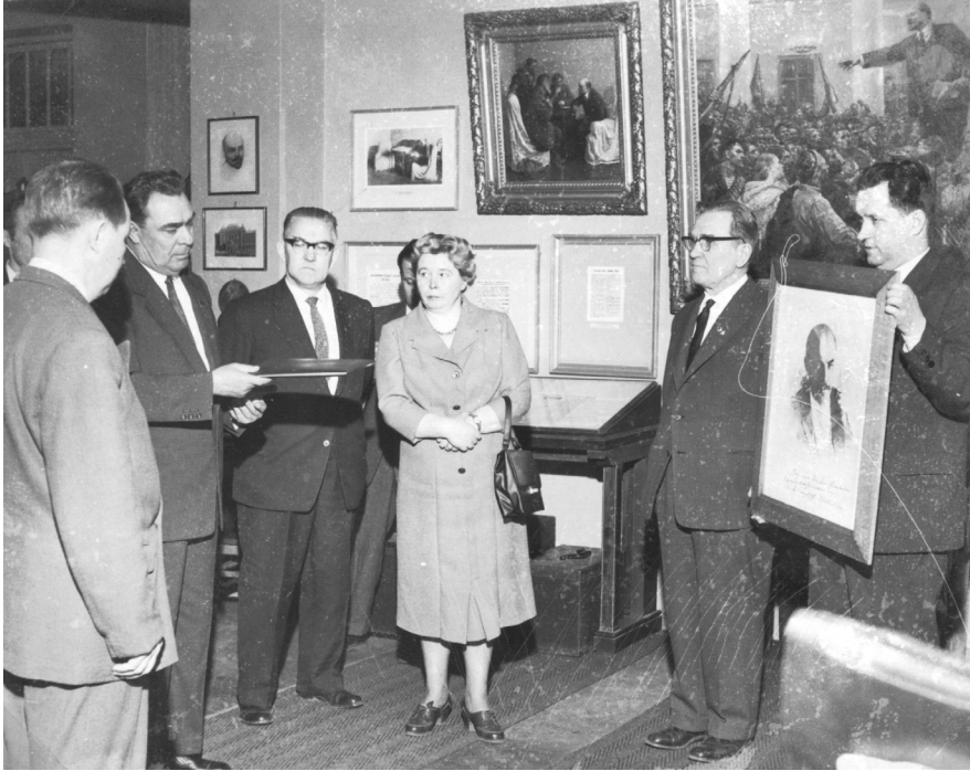
Kuva 4. Brežnev vierailulla vuonna 1961. Taustalla näkyy destalinisaation myötä ongelmalliseksi muuttunut Vladimir Serovin teos Lenin julistaa neuvostovallan .

Museotila remontoitiin ja uusi näyttely rakennettiin syksyllä 1963. Uuden näyttelyn avajaisia päästiin juhlimaan saman vuoden 1963. Uudistuksessa perusnäyttely sai uuden rakenteen. Aiemman kronologisen lähestymistavan sijaan museotila jaettiin kahteen osaan, joista ensimmäinen käsitteli Leninin roolia vallankumouksessa ja toinen Leninin toimintaa Suomessa. Uudistuksen lähtökohtana oli destalinisaatio, joka museonäyttelyiden tapauksessa tarkoitti Leninin, vallankumouksen ja Neuvostoliiton rakentamisen esittämistä ilman Stalinia. Näyttelystä julkaistussa oppaassa Stalinia ei mainita lainkaan eikä hänen kuviaan ole esillä. Myöhemmin Tampereen museosta Moskovaan lähetetyistä kuvista kävi kuitenkin ilmi, että jotkin Stalinin kuvat olivat palanneet seinille näyttelyn avajaisten ja Moskovan museotyöntekijöiden lähdön jälkeen. Puolueen johdolle lähetetyssä kirjeessä Moskovan Lenin-museon työntekijä harmittelee, että heidän vaivalla laatimansa näyttelyn rakenne on tuhottu ja Stalinin kuvat jälleen laitettu esille. 41