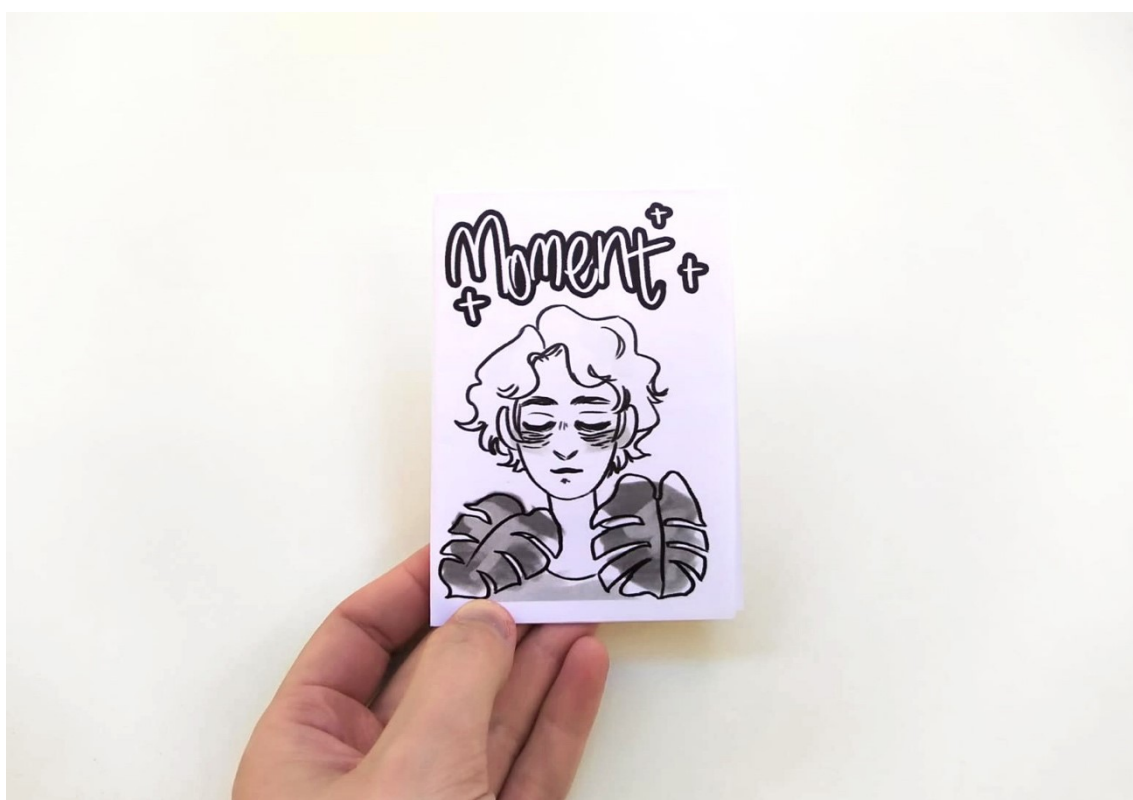
Kuva 3: Moment on Lindénin tekemä minizine, joka erottuu tavanomaisesta A5-kokoisesta zine-julkaisusta pieneen kokonsa vuoksi. (Lindén, 2018)

”Painettu tuote luo mielikuvan, että siihen on käytetty enemmän vaivaa, vaikkei näin olisikaan. Mieluummin luen painettuja zinejä, sillä valittu paperityyppi, painojälki yms. tuovat mielestäni tuotteeseen lisää persoonaa.” 72