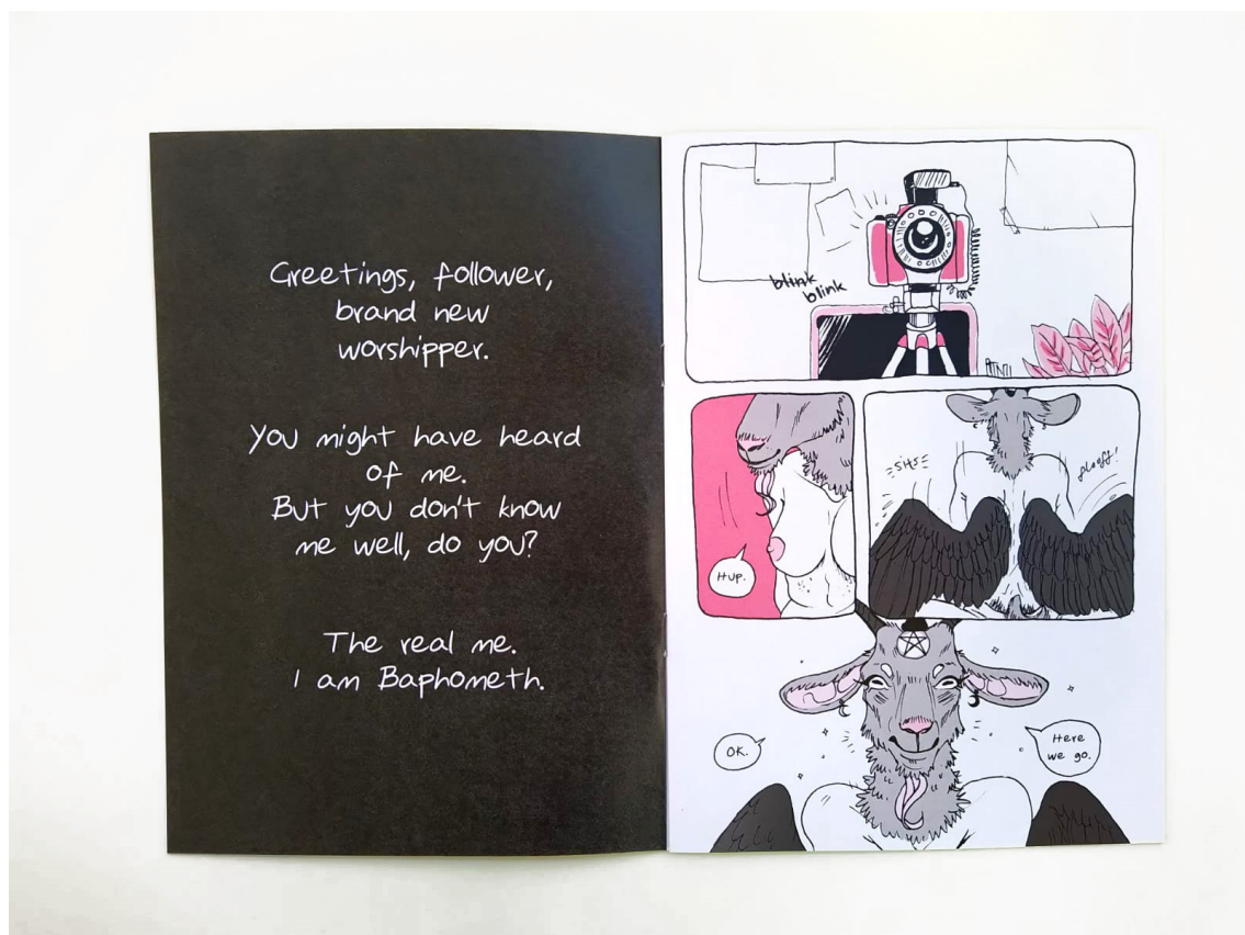
Kuva 5: Lindénin @bae_phometh on Lindénin ensimmäinen oma zinejulkaisu.

”Se on konkreettinen lehti. Oli ihan mahtavaa pidellä kädessä varsinkin sitä ekaa omaa zineä.” 113