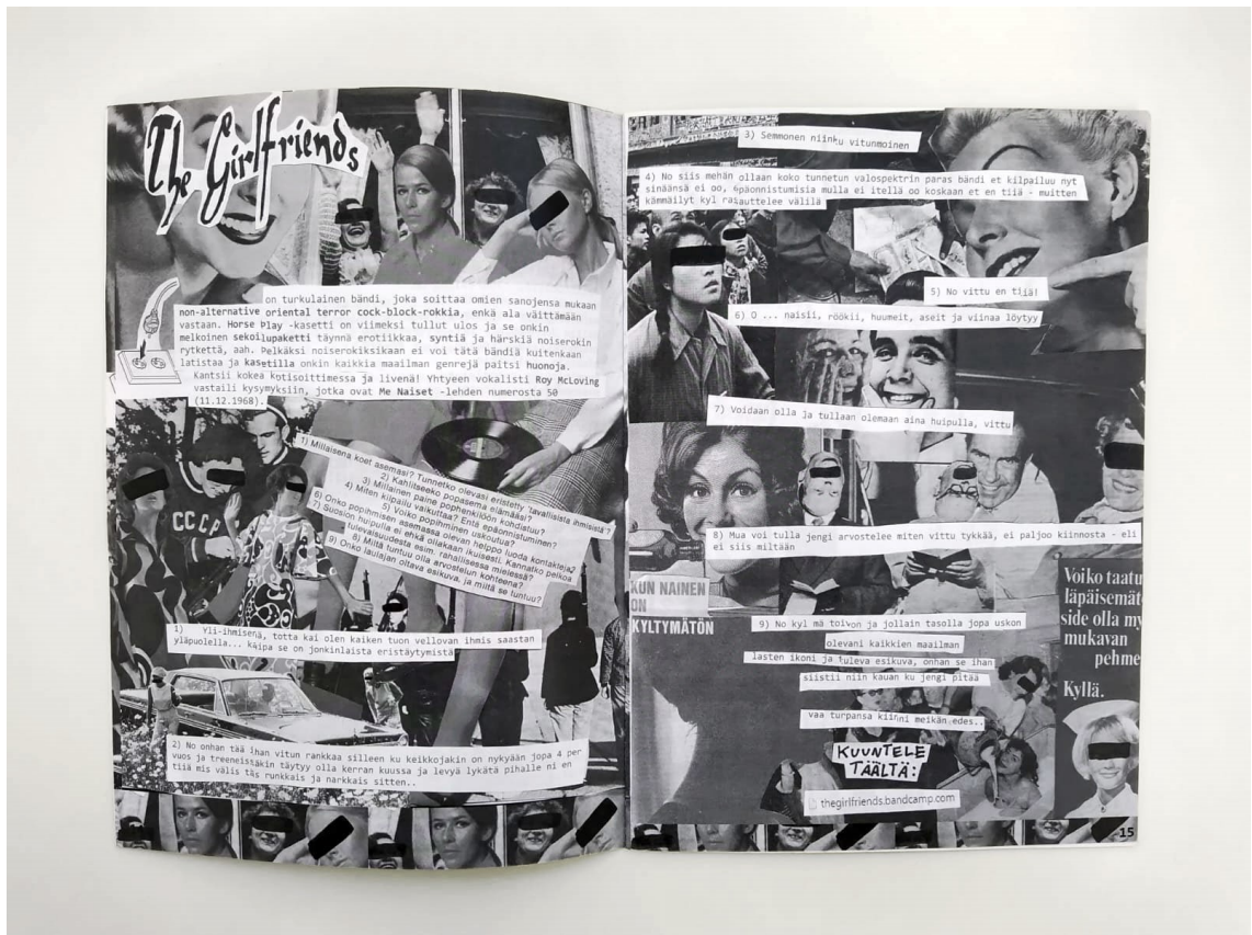
Kuva 6: Antti Anttilan zinessä Elikäs on haastateltu punkbändi The Girlfriendsiä vuoden 1968 Me Naiset -lehden Danny-haastattelun kysymyksillä. (Anttila, 2015)

Hän koki oppineensa toimittamisesta huomattavan paljon vuoden tekoprosessin aikana ja osaisi tehdä esimerkiksi haastatteluja jatkossa tehokkaammin ensimmäisen lehden tekemisen kautta tulleiden kokemusten myötä. 119