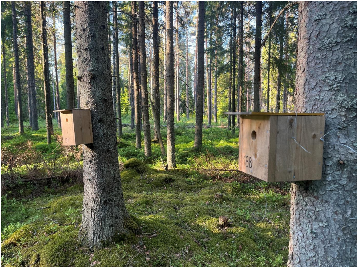
Kuva 1. Koeasetelma maastossa

Tulosten tilastollisissa analysoinnissa käytettiin kesällä 2024 pöntöistä kerättyä aineistoa. Aineisto analysoitiin käyttäen \chi^2 -testiä. \chi^2 -testi tehtiin Microsoft Excelissä. Nollahypoteesina oli että lintujen pesävalinta jakautuisi tasaisesti kummankin pönttömallin kesken ja vaihtoehdohypoteesina, että pönttömallien välillä on eroa. \chi^2 -testi suoritettiin sekä yhdessä kaikille lajeille että erikseen tiaisille ja kirjosiepolle.