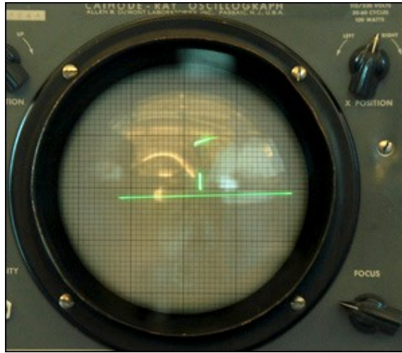
Kuva 3.1: Tennis for two oskilloskoopilla jäljiteltynä alkuperäisestä.

nellin luomaan ensimmäisen arcade pelin Computer Space . Siitä saaduilla tuotoilla Bushnell julkaisi pelin PONG , joka oli suosituampi ja levisi laajemmalle kuin Computer Space . (Wolf 2007)