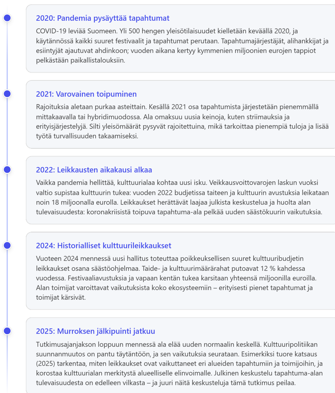
Kuva 1. Aikajana tapahtumaketjusta, johon tutkielman aihe ja rajaukset kohdistuvat. Kuva Katja Jaskari. Kuva luotu tekoälyllä 2025.

Miksi tutkimme näitä muutoksia juuri verkkokeskusteluista? Verkon kommenttipalstat ja sosiaalisen median keskustelut toimivat ikään kuin peilinä alan ilmapiirille ja tulevaisuuskuville. Tapahtuma-alan toimijakenttä on monimuotoinen ja koostuu sekä alan sisäpiirin edustajista että ulkopuolisista osallistujista. Keskeisiin toimijoihin kuuluvat muusikot, tapahtumajärjestäjät, tekniset työntekijät (esimerkiksi valo- ja ääniteknikot), kulttuurituottajat, festivaali- ja