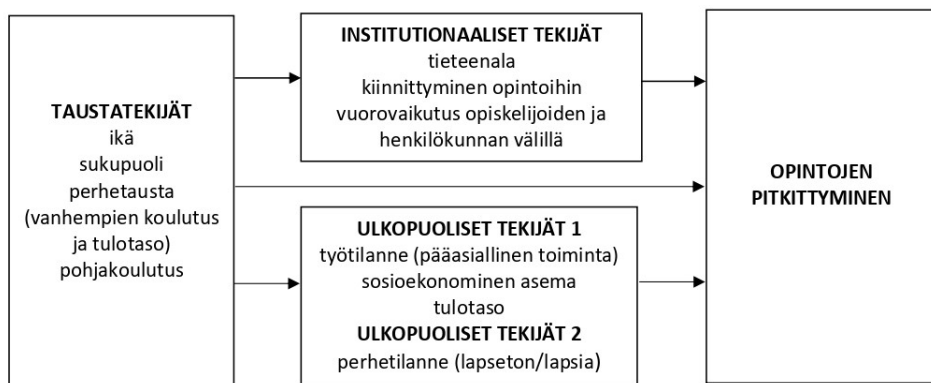
Kuvio 1. Opintojen pitkittymiseen yhteydessä olevat tekijät. 1

Ikä on aikaisemman tutkimuksen mukaan yhteydessä opintojen edistymiseen siten, että mitä vanhempana opinnot aloitetaan, sitä todennäköi-