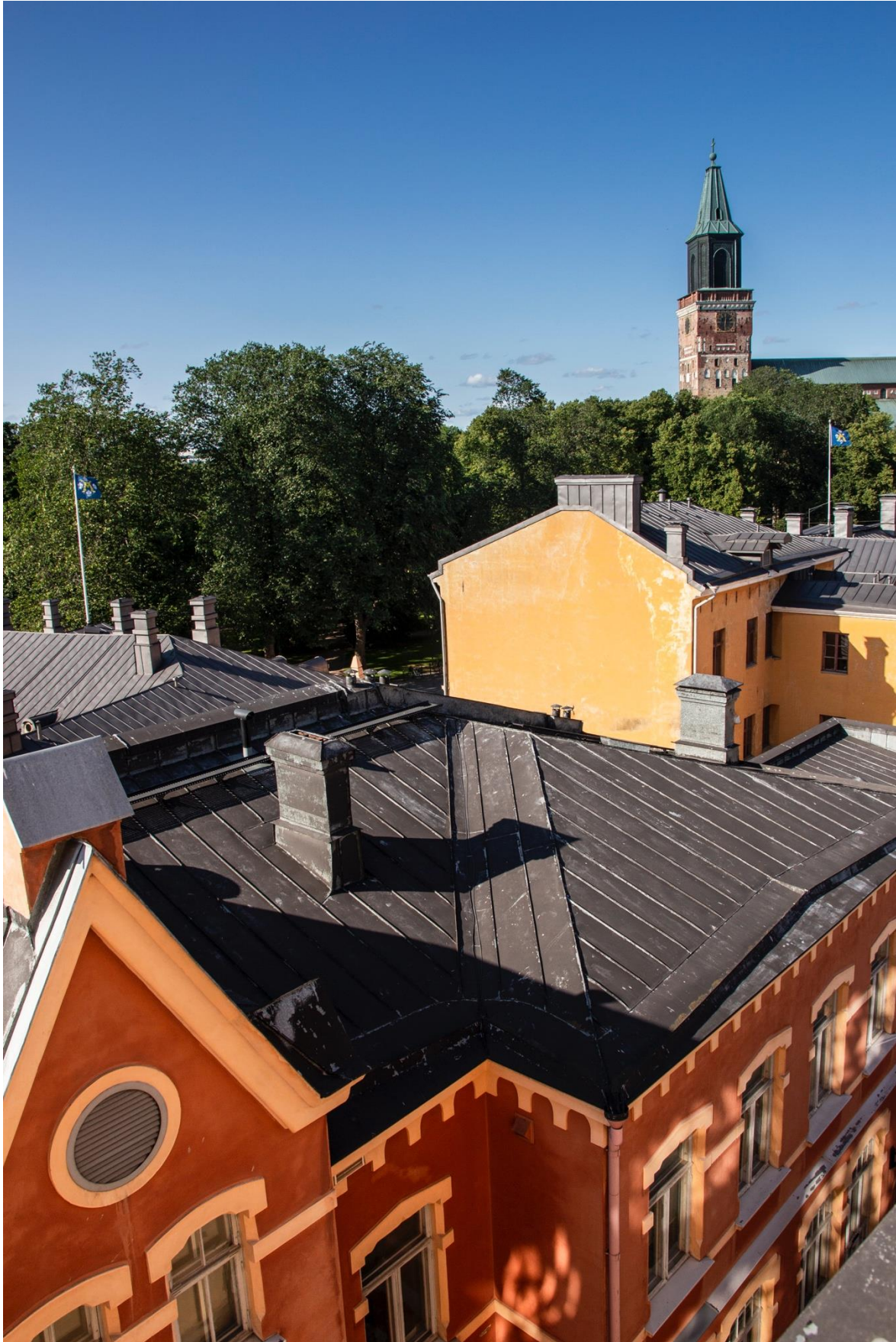
Kuva 5: Näkymä Rettigin tupakkatehtaan rakennuksesta Suurtorille ja Tuomiokirkolle päin.