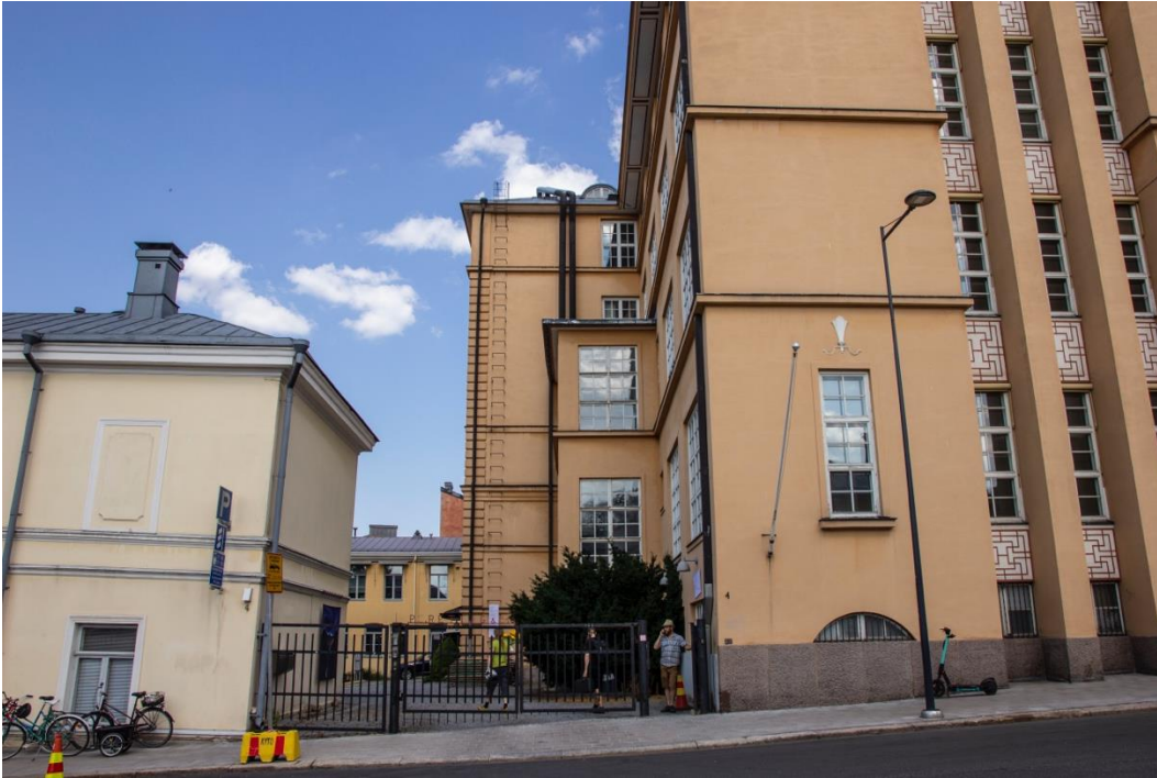
Kuva 4: Rettigin portti kuvattuna Nunnankadulta päin. Oikealla Rettigin tupakkatehtaan rakennus.