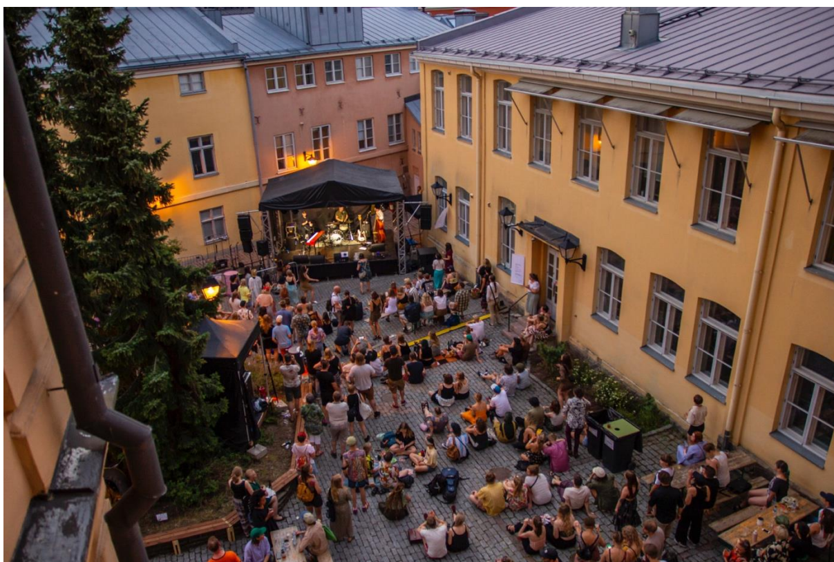
Kuva 2: Ihmisiä ILMIO-festivaalilla Rettigin sisäpihalla heinäkuussa 2021.

Kokonaisuutena kehittämissuunnitelmassa kulttuuri nähdään vahvasti kaupunginosan vetovoimatekijänä, joka tukee kaupunkikuvan ja -kokemuksen kehittämistä. Kulttuuri ja taide asemoituvat projektissa ennen kaikkea välineeksi kaupunkikehitykselle ja tilan elävöittämiselle, mutta myös kaupunkilaisten osallisuudelle ja yhteisön vahvistamiselle. Kulttuurille annetaan suunnitelmassa paljon palstatilaa. Suunnitelmassa kulttuurin funktio on kuitenkin ensisijaisesti instrumentaalinen, kulttuuria hyödynnetään alueen imagon ja käytön monipuolistamiseksi, mutta kulttuurin toimintaperiaatteita ja toiminnan mahdollistavia rakenteita ei selitetä.