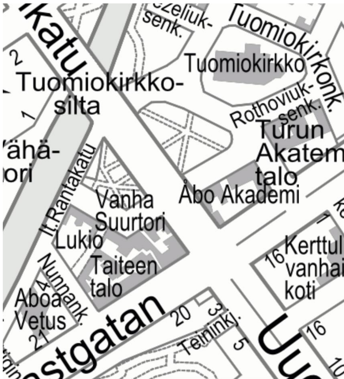
Kuva 3: Karttakuva Taiteen talon ja Vanhan Suurtorin ympäristöstä. Taiteen talo rajautuu länsipuolella Nunnankatuun, eteläpuolella Hämeenkatuun, itäpuolella Uudenmaankatuun ja pohjoispuolella Vanhaan Suurtoriin ja Brinkkalan taloon.