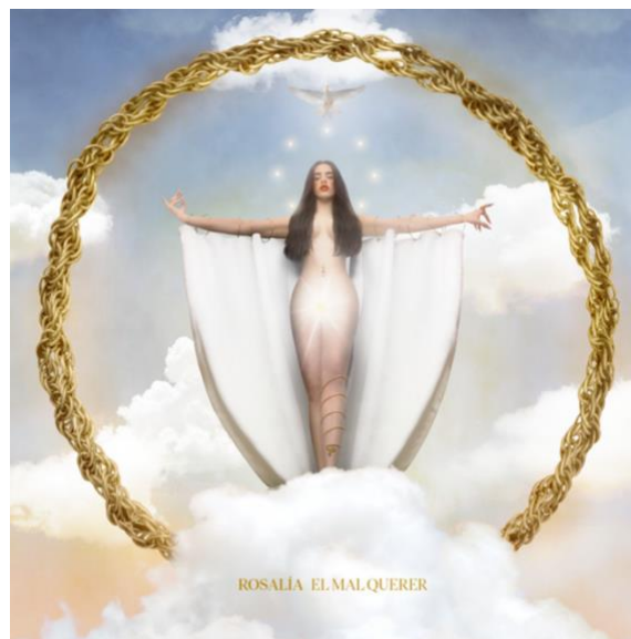
Imagen 4: Portada del álbum El Mal Querer

Con solo 13 años de edad, Rosalía empezó su formación musical estudiando en una escuela de música como un pasatiempo, pero su interés por esta arte no terminó ahí, ya que más tarde entró en la Escuela Superior de Música de Cataluña para estudiar la expresión artística del flamenco 10 (Cantor-Navas, 2018 y Segura, 2019). Durante sus estudios publicó su primer álbum Los Ángeles en 2017, lo cual contenía sonidos más tradicionales del flamenco con un poco de experimentación con la guitarra (Cantor-Navas, 2018). Sin embargo, no fue hasta 2018 cuando la carrera de Rosalía realmente comenzó a florecer con la publicación de su segundo álbum El Mal Querer , que compuso como el trabajo de fin de grado sus estudios en la Escuela Superior de Música de Cataluña (Cantor-Navas, 2018 y Segura, 2019). El álbum recibió mucha atención porque mezclaba sonidos del flamenco con la música urbana y electrónica, lo cual fue visto como algo nuevo en la industria de la música popular (Cantor-Navas, 2018 y Petridis, 2018).