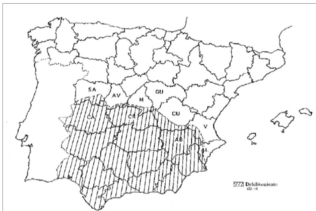
Imagen 2: División de la península ibérica en cuanto a la variación de la /s/ posnuclear