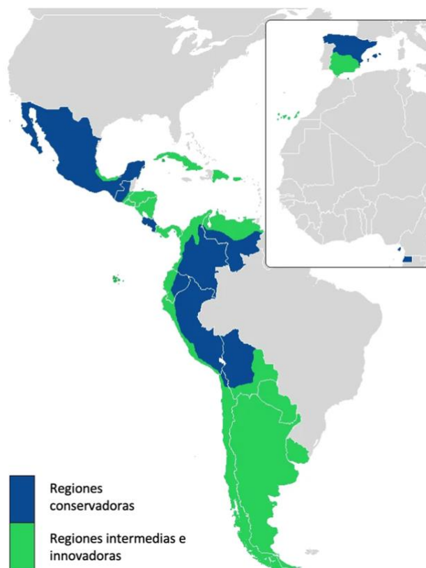
Imagen 1: Mapa de la variación de la consonante /s/ en posición posnuclear