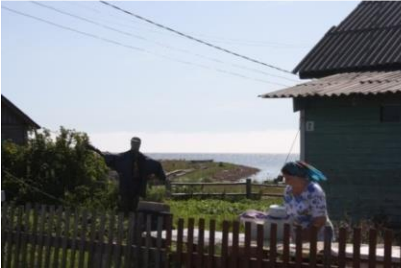
Kuva 6. Kaskarannan variksenpelätin.