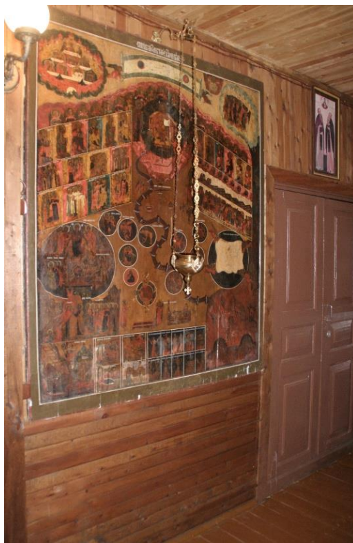
Kuva 63. Länsirannalla olevan Afanasian talvikirkon eteisessä on tuomiopäivän ikoni.