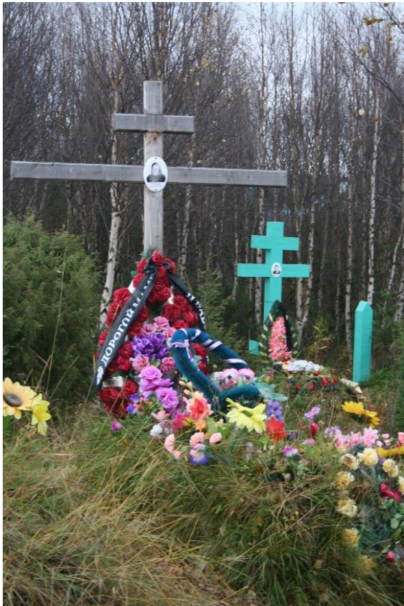
Kuva 86. Varzugan länsirannan puisia hautamuistomerkkejä.