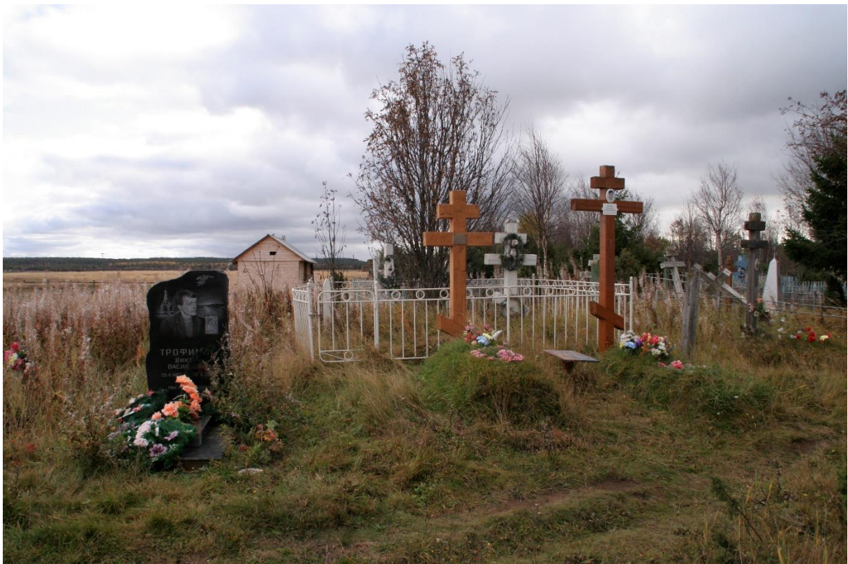
Kuva 85. Varzuga länsiranta, nuoren miehen marmorinen hautakivi, jossa on kuvan lisäksi symboleita, kirkko, enkeli ja pasuuna