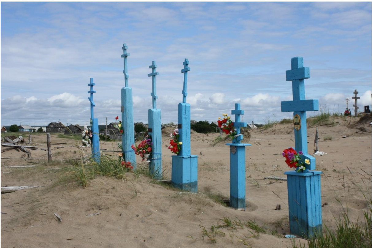
Kuva 83. Perheen sininen hauta Kuusiniemi.