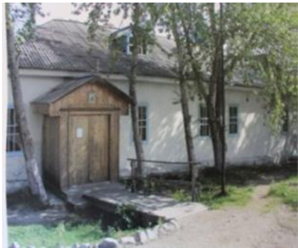
Kuva 4. Umban nykyinen kirkko.