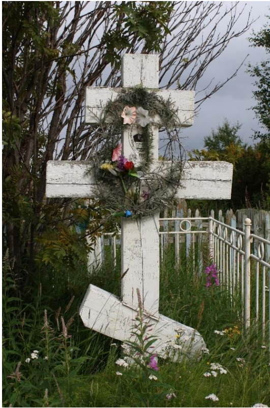
Kuva 90. Länsirannan isokokoinen puuristi, jossa on metallinen seppeli.