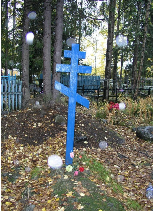
Kuva 76. Kahdeksankulmainen venäläinen puuristi, Umba