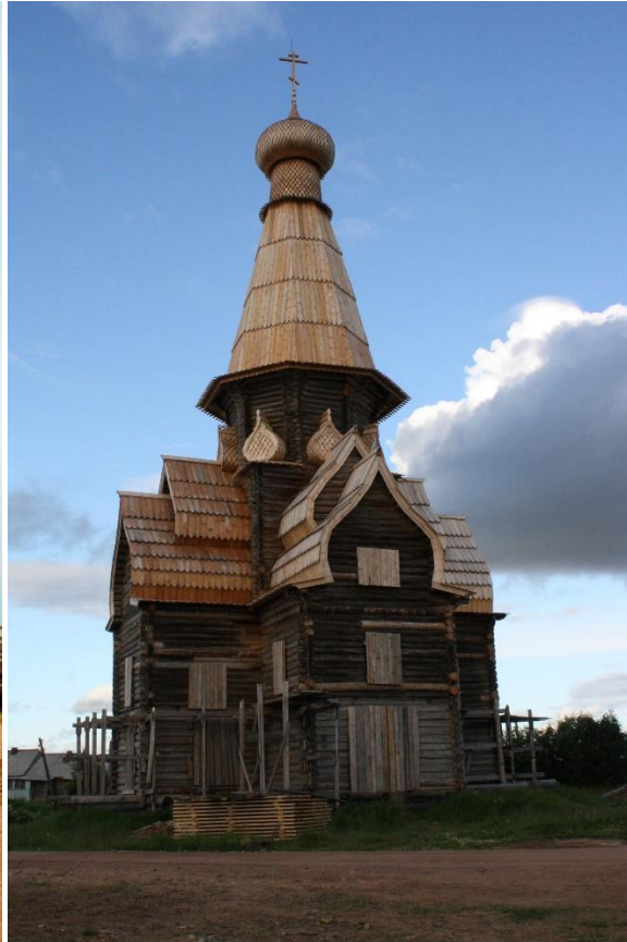
Kuva 52.. Uspenskin kirkon korjaus jatkuu v. 2009.