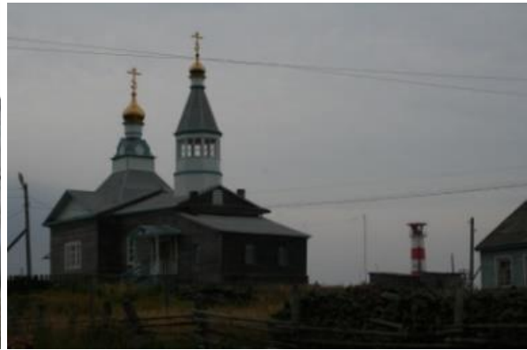
Kuva 9. Kaskarannan ortodoksinenkirKKo ja majakka.