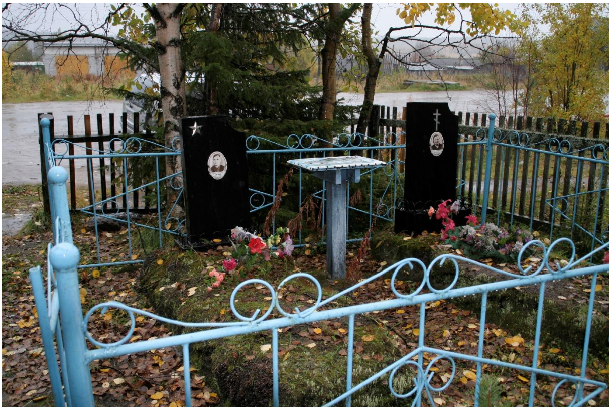
Kuva 75. Vainajan muistelua varten pöytä, hautakummut, kivissä risti ja tähti, Umba.