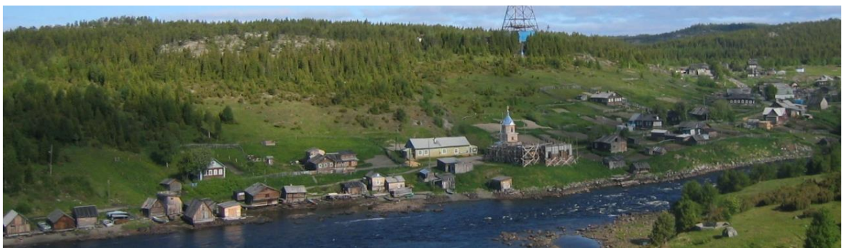
Kuva 5. Vanhan Umban pogostaa, kirkko on ollut rakenteilla vuosia.