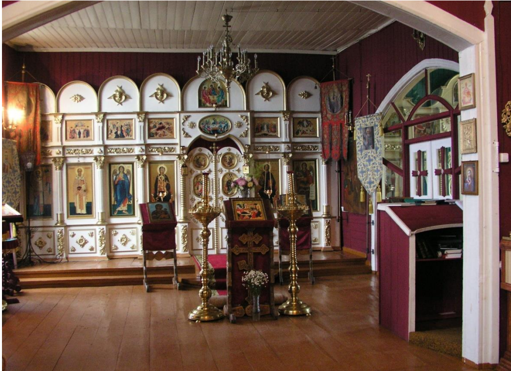
Kuva 49. Varzugan länsirannan Afanasian talvikirkon ikonostaasi.