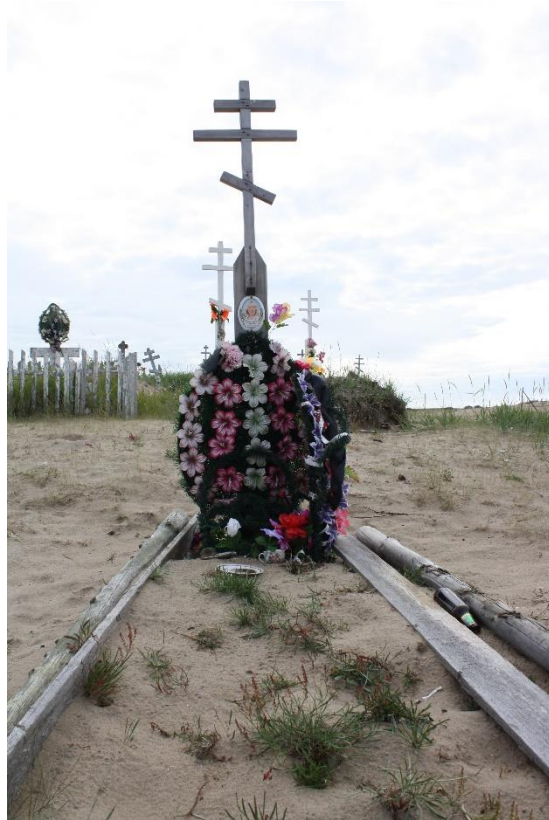
Kuva 79. Mandorla, kuppi ja viinapullo nuoren naisen haudalla, Kuusiniemi.