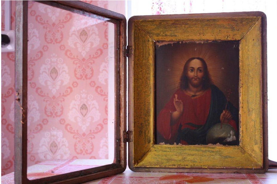
Kuva 38. Barokkityylinen ikoni majapaikassa, kiilatuet takana, Varzuga.