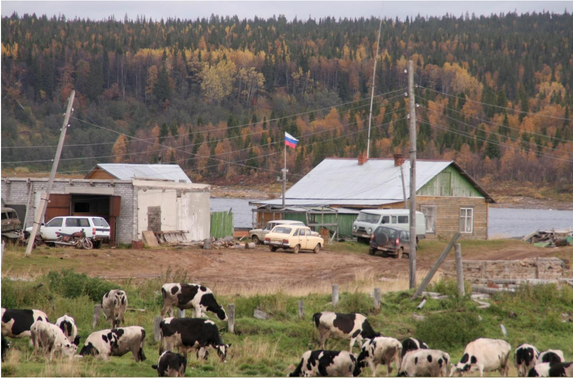
Kuva 40. Varzugan kolhoosin luomulehmät ja toimiston pihalla liehuu lippu. Länsirannalla on runsaasti kolhoosin hylkäämä kalustoa ja romua.