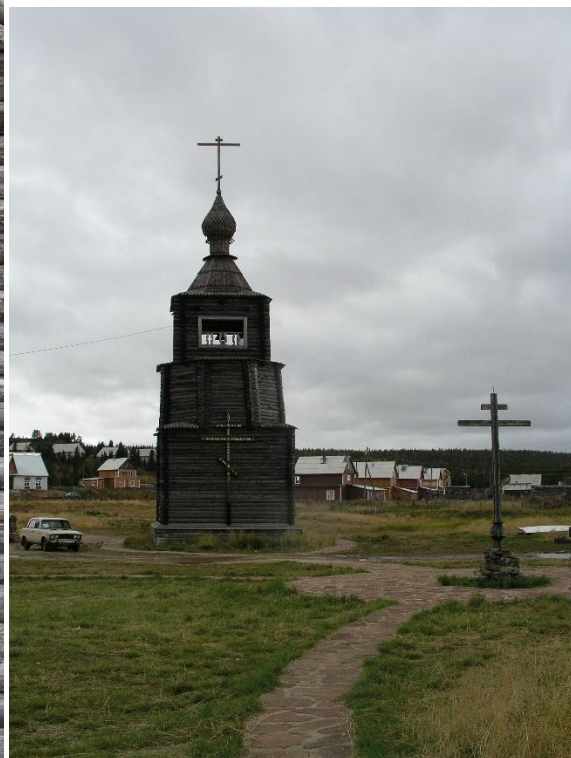
Kuva 59. Länsirannan kellotapulien alue on nurmettumassa , vieressä Uspenskin kirkon kattoristi v. 2007.