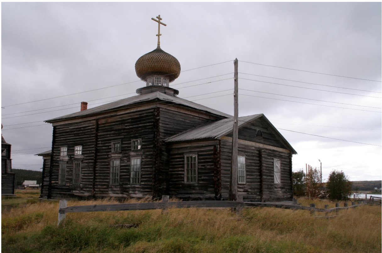
Kuva 48. Varzugan Afanasian talvikirkko, paanukatto ja sipulikupoli.