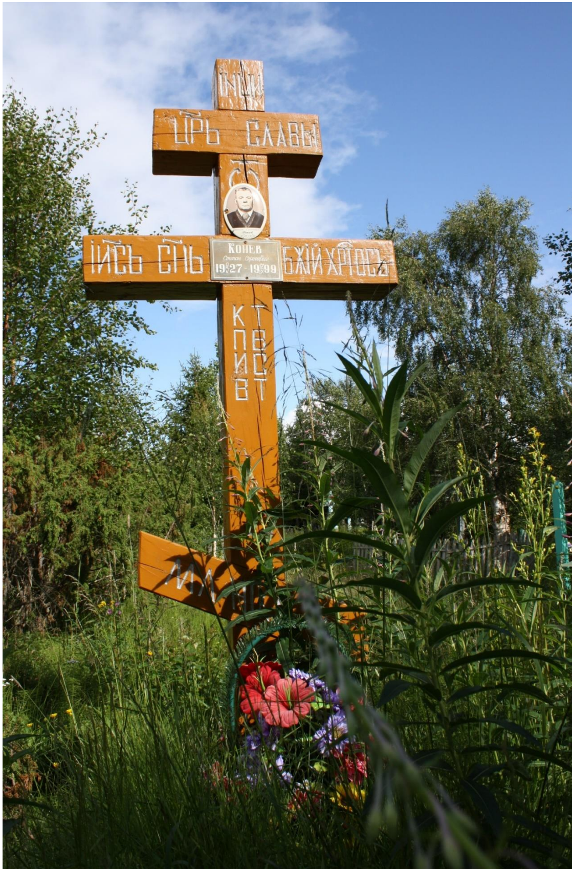
Kuva 94. Varzugan jäätiristin alaosan teksti ja symbolit.