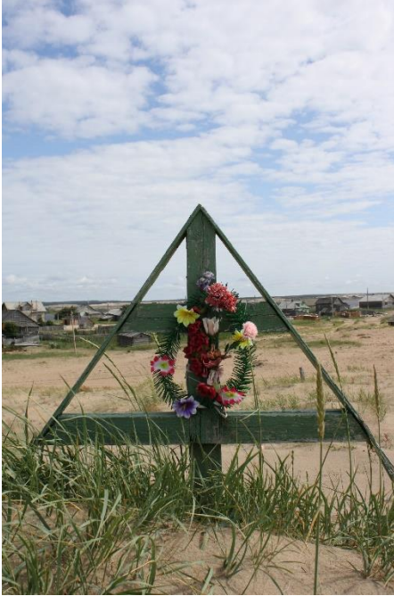
Kuva 82. Vanhauskoisten katoksellinen risti on peittymässä hiekkaan, Kuusiniemi.