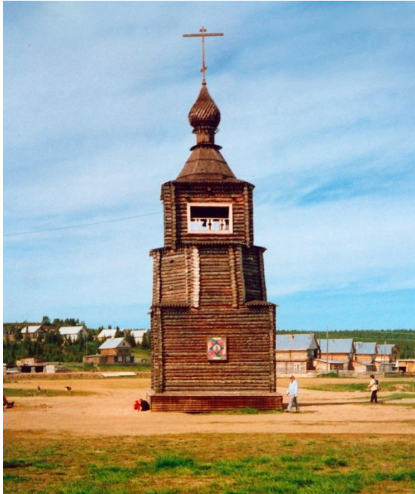
Kuva 56. Länsirannan kellotapuli v. 2003, hiekka on valtaamassa maisemaa.