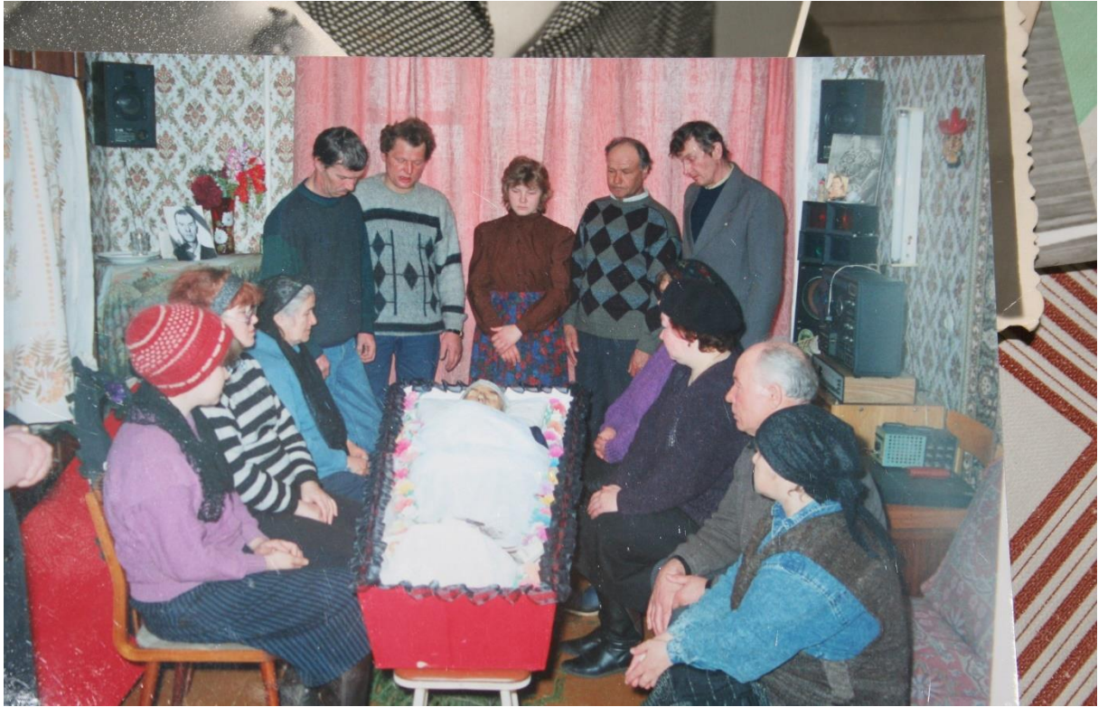
Kuva 68. Kuusiniemi, vaianajan muistelu kotona.