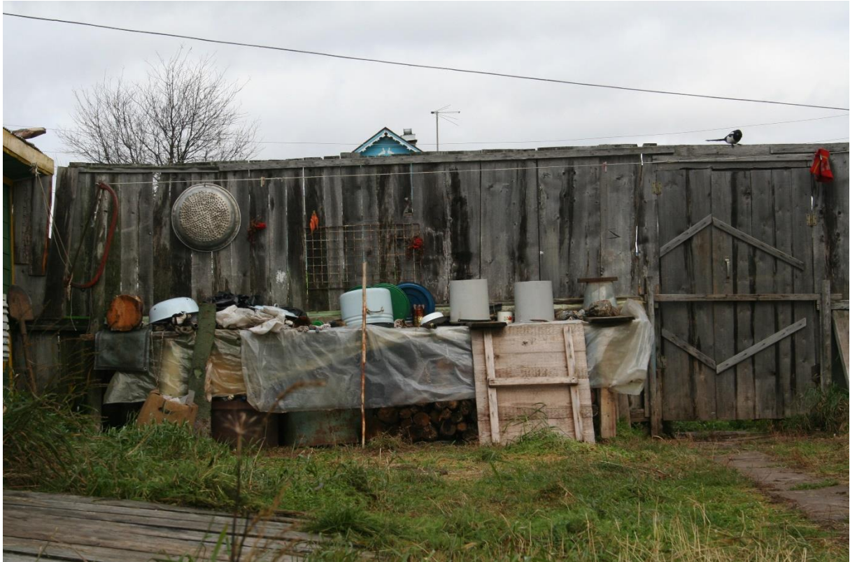
Kuva 32. Varzagan Itärannan pihan elämisen jäljet, kaikki tavarat ovat järjestyksessä.