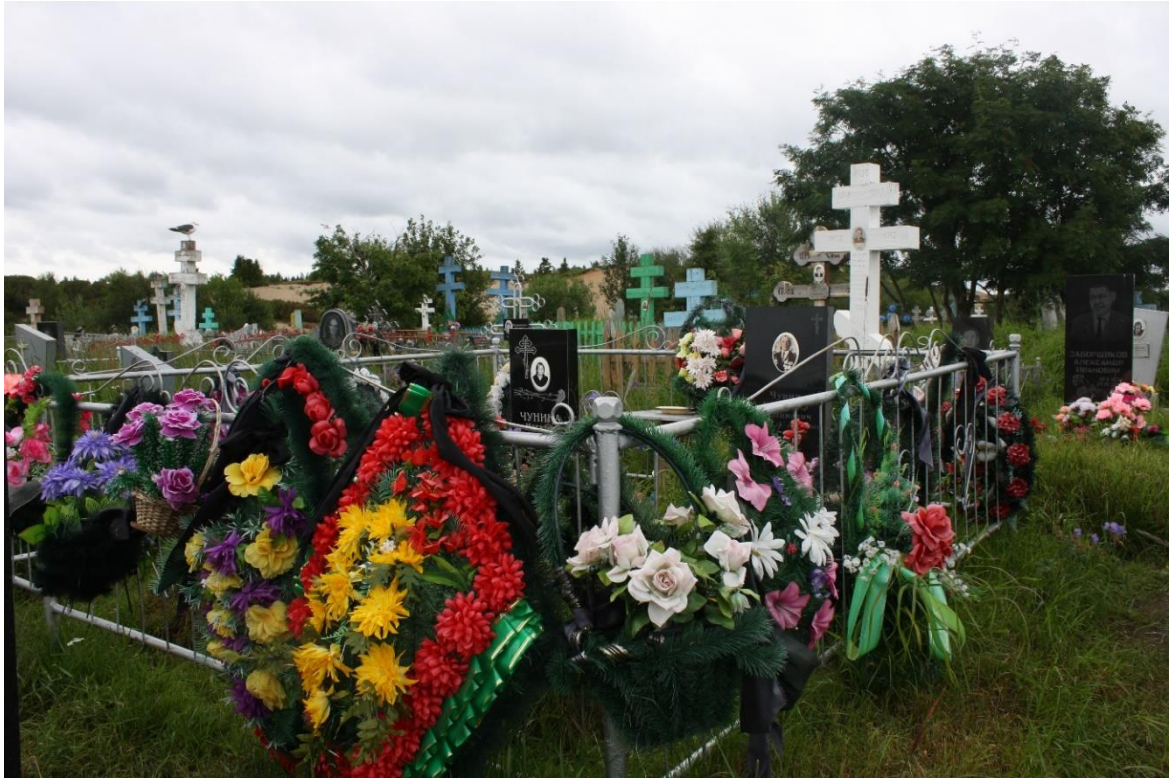
Kuva 92. Varzugan Itärannan sukhauta on täynnä seppeleitä.