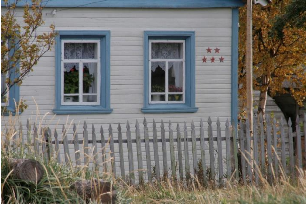
Kuva 16. Kuusiniemen asutun talon seinässä viisi tähteä ja ikkunalla syklaamit