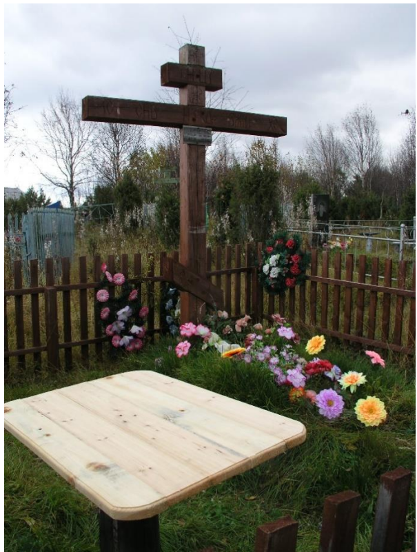
Kuva 91. Länsiranta uusi puinen isokokoinen risti ja pöytä muistelua varten.