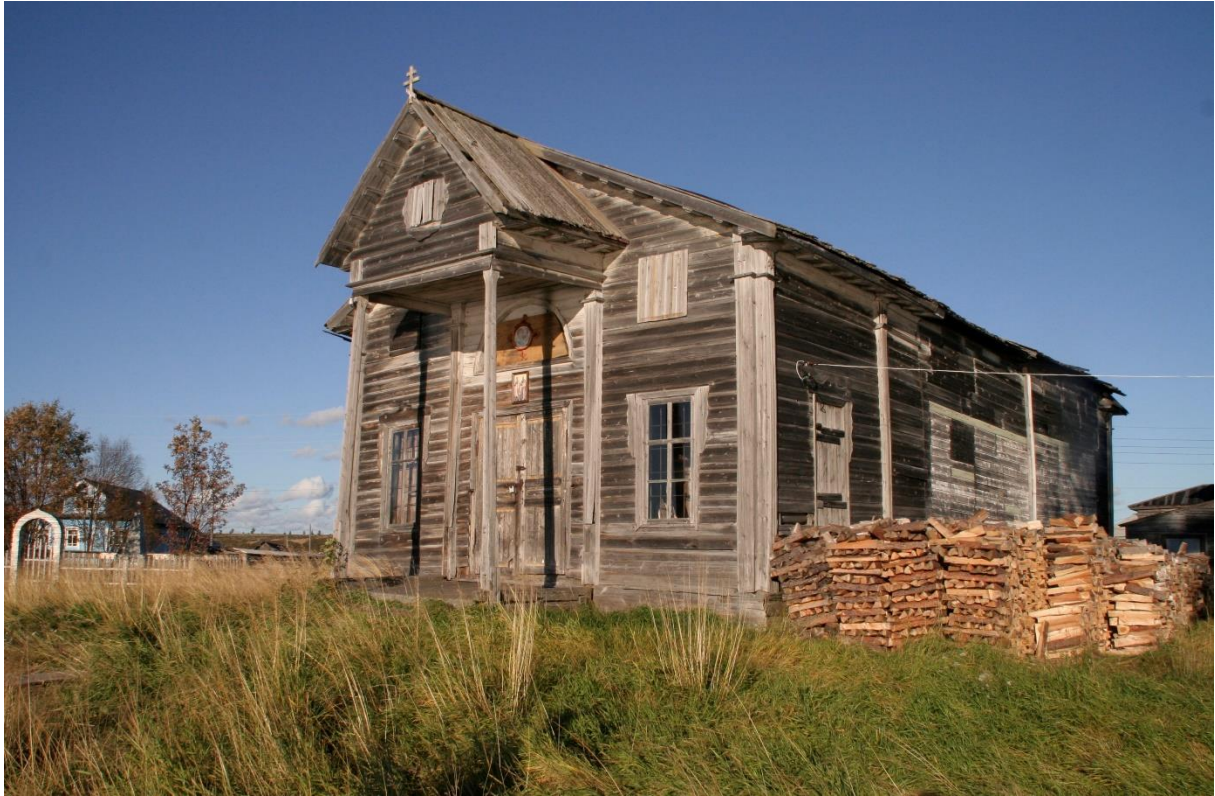
Kuva 47. Itärannan Nikolain kirkko, joka on toiminnassa, vasemmalla on sankarivainajien muistolehto.