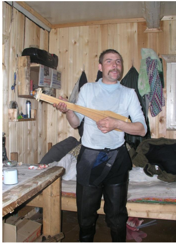
Kuva 42 Kolhoosin kalastuksenvalvoja on tehnyt kitaran ja viettää vapaa-aikaansa tukikohdassaan. Asunto on siisti.