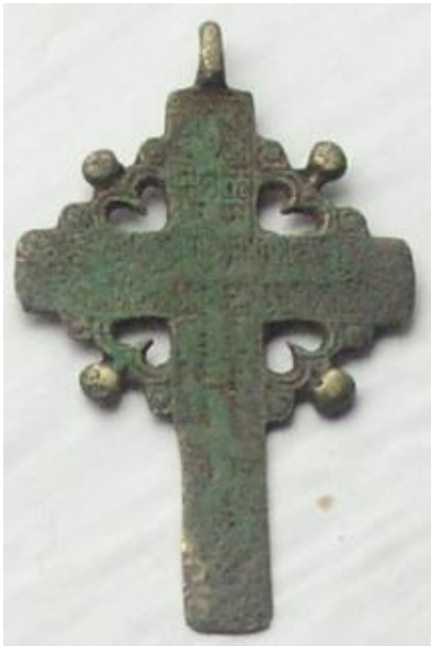
Kuva 65. Pomoriperheen löytämä kasteristi, Varzuga.