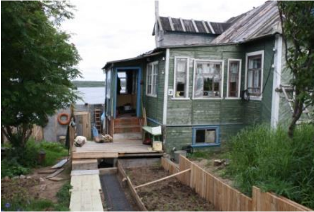
Kuva 12. Kuusiniemi, pihalla on tehty eroosiontorjuntaa.