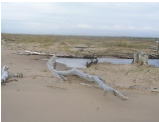
Kuva 14. Kuusiniemi, kanto on jäänyt muistoksi metsästä.