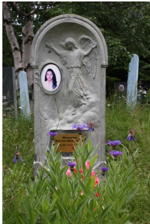
Kuva 89. Länsiranta nuoren naisen reliefihauta, luonnonkukkia.