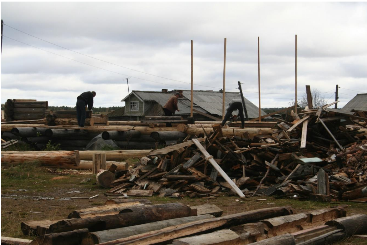
Kuva 53. Länsirannan Uspenskin kirkko on purettu ja uudelleen rakentaminen on alkanut v. 2007.