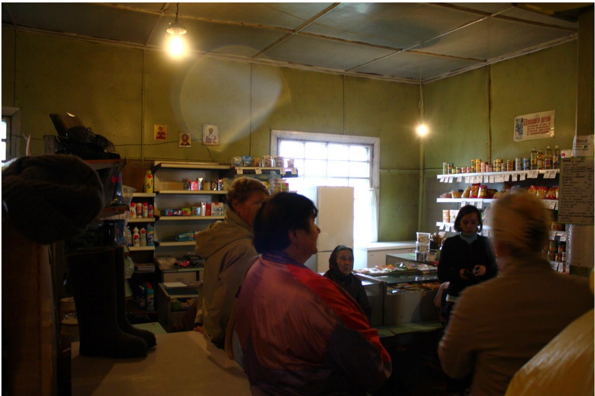
Kuva 44. Kolhoosin Varzugan itärannan kaupassa odotetaan maidon ja leivän tuojaa, kauppa on entisessä kirkossa.