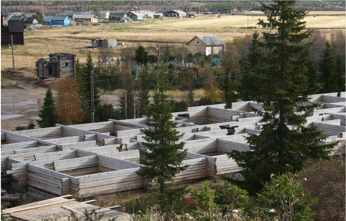
Kuva 43. Kolhoosi rakentaa hotelleja länsirannalle. Taustalla on kolhoosin peltoa. Kalmiston siniset ristit näkyvät.