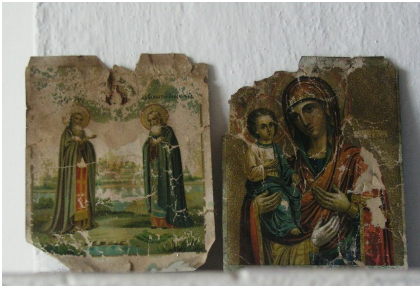
Kuva 39. Varzugan pomoriperheen painoikoneita.