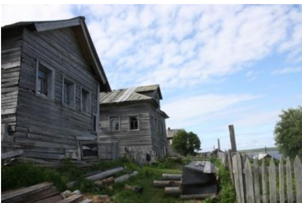
Kuva 10. Kuusiniemi, pomoritaloja, pääty joelle päin.