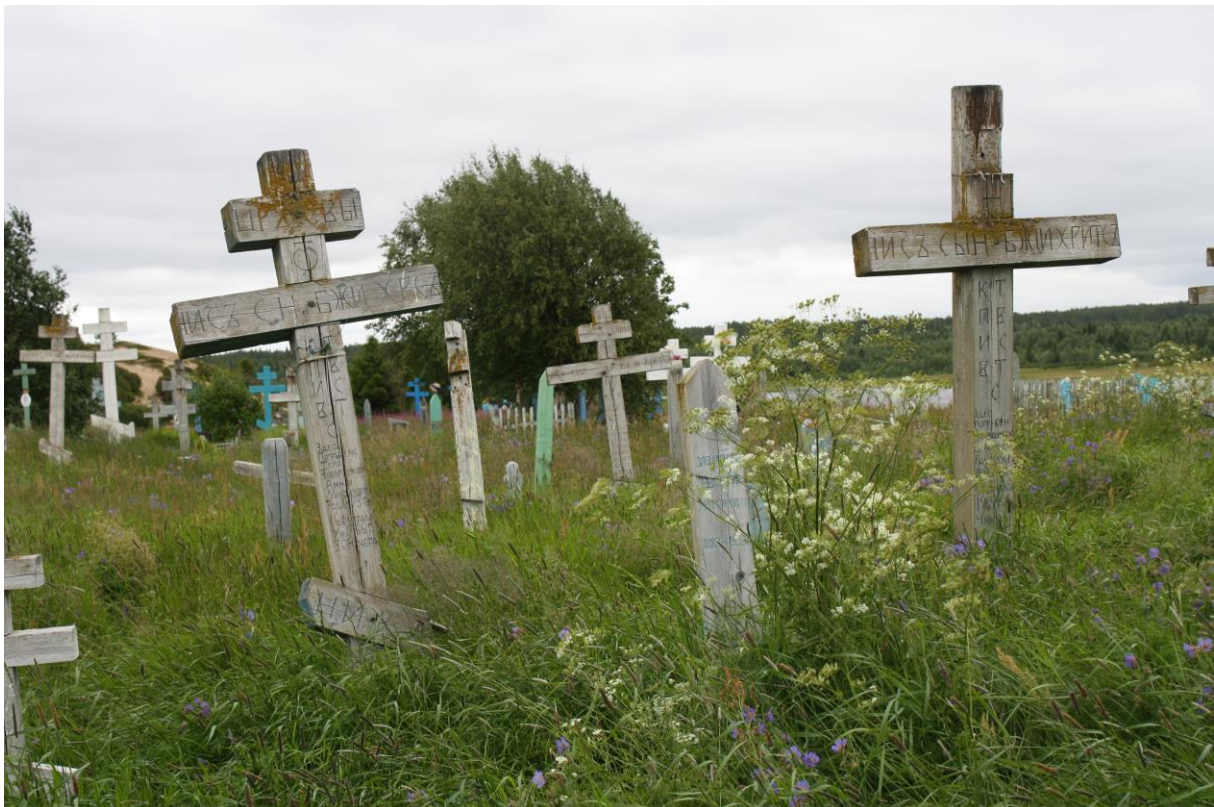
Kuva 93. Varzugan itärannan isoja ristejä.