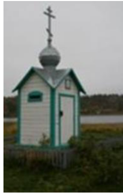
Kuva 2. Umban tsasouna.