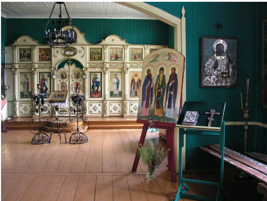
Kuva 50. Afanasian talvikirkon Solovetskin pyhittäjä ikoni, vanhauskoisten ikonin edessä on tsata ja lampukka.