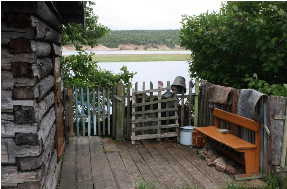
Kuva 29. Varzugan itärannan saunan terassi.