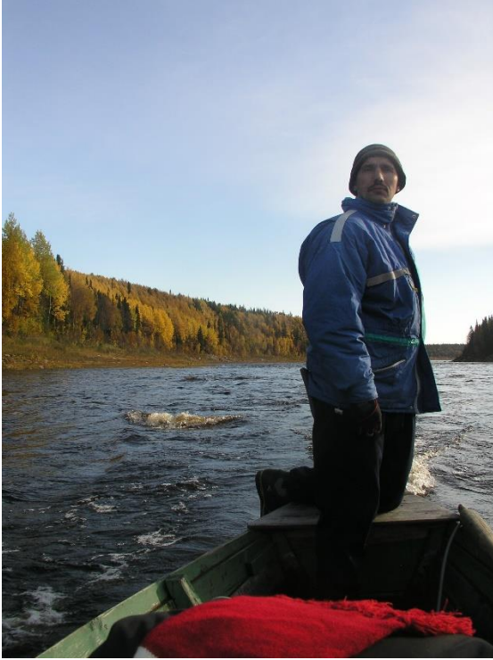
Kuva 27. Pomori vie matkalaiset Varzugajoen maisemiin. Kuljettaja tuntee joen kuohut ja karikot, osaa lukea joen virran juoksun.