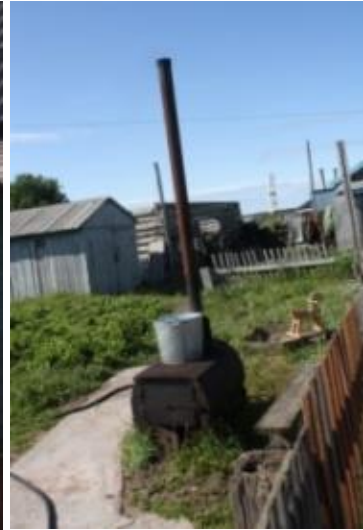
Kuva 7. Kaskarannan ulkoilmakeitin, kesäkeittiö.