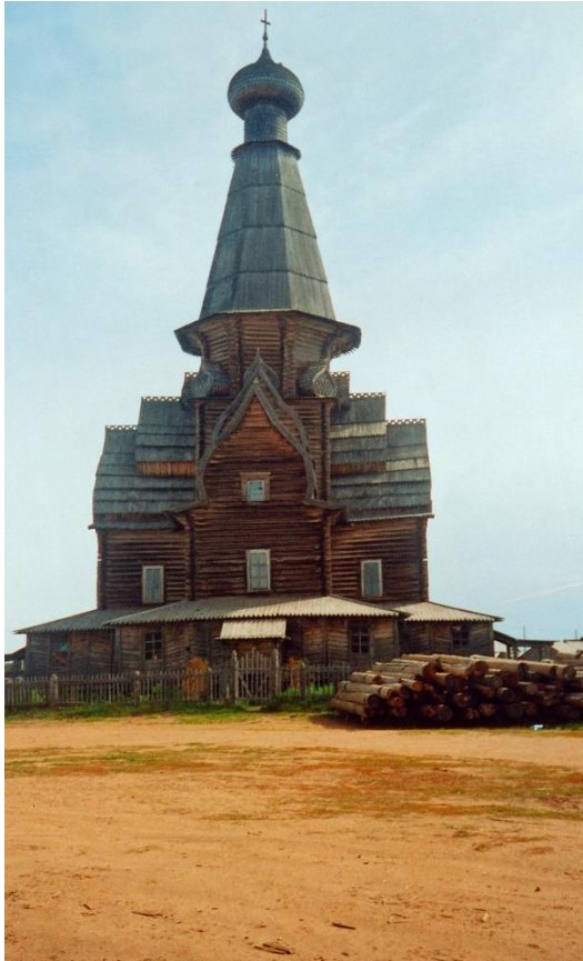
Kuva 51. Länsirannalla oleva Uspenskin kirkko v. 2003, odottaa korjausta.