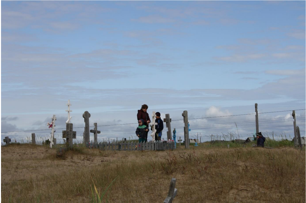
Kuva 84. Äiti tuli kolmen lapsen kanssa haudalle muistelemaan, toivat ryynejä, Kuusiniemi.