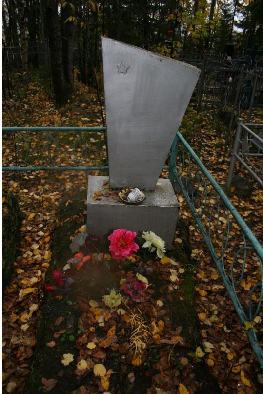
Kuva 74. obeliskin mallinen hautamuistomerkki, jossa on tähti, Umba..