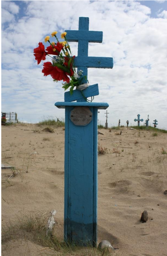
Kuva 78. Kuusiniemi, haudalla on tekokukkavihko ja lasipurkki, pylväässä vainajan tiedot.