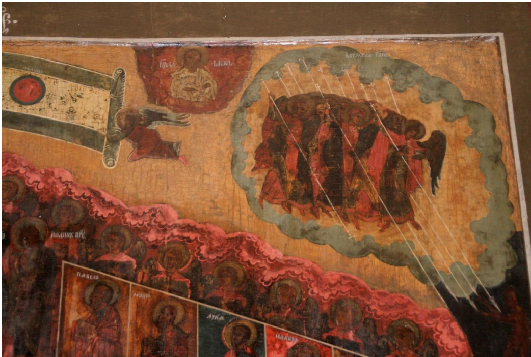
Kuva 64. Afanasian talvikirkon tuomiopäivänikoni, jonka lukeminen alkaa oikealta.