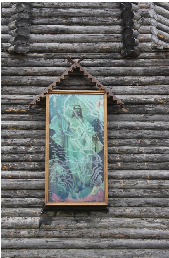
Kuva 58. Länsirannan kellotapuli v. 2009.