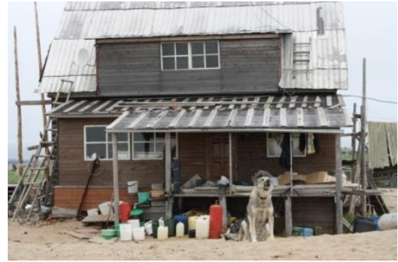
Kuva 17. Kuusiniemen talon ulvova koira ja muoviset pihastiat.