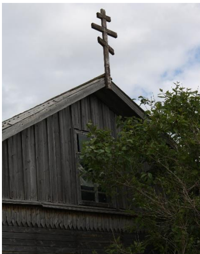
Kuva 20. Kuusiniemen tsasouna on asuinrakennuksen yhteydessä.