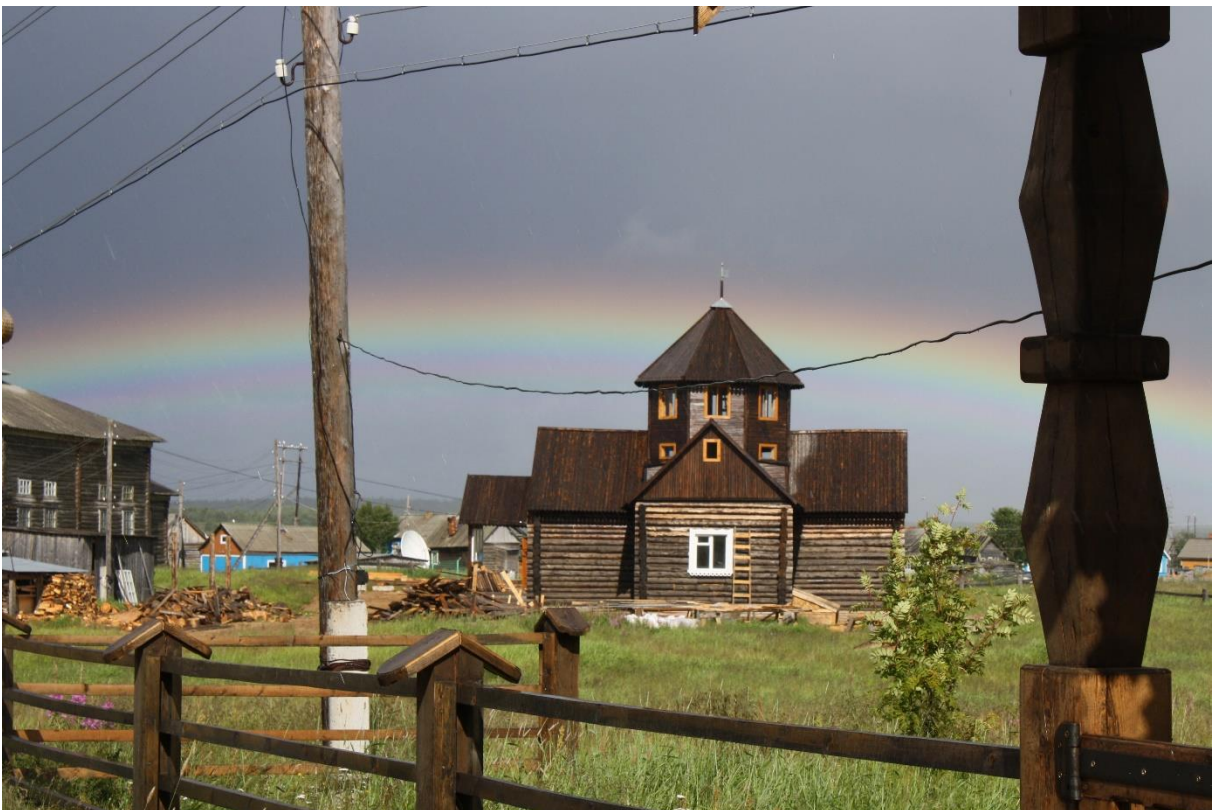
Kuva 55. Varzugan länsirannan kirkkokentällä oleva ikoneiden konservointikeskus, joka on muutettu kirkon majoitustilaksi