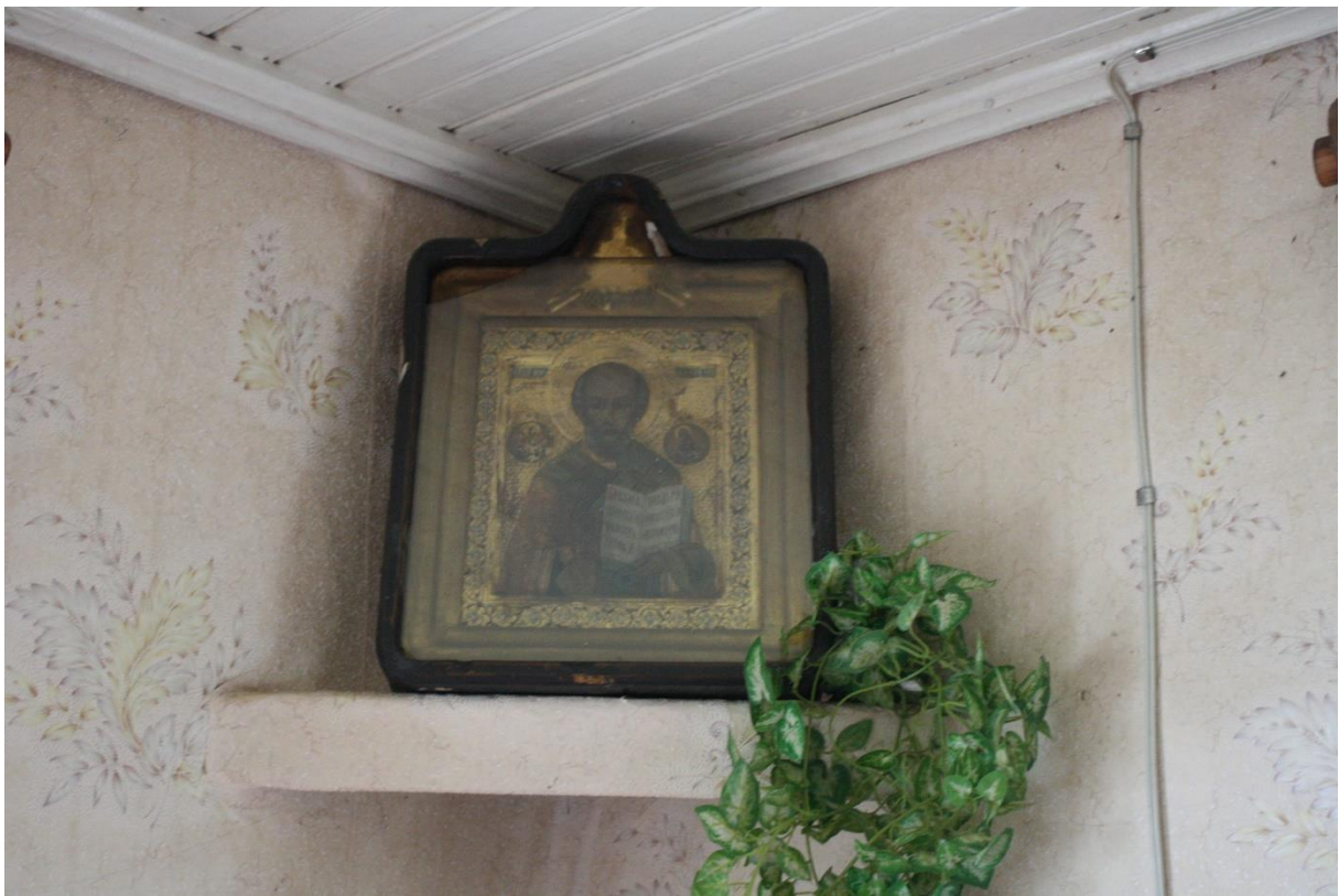
Kuva 37. Ikoninurkkaus Tatari Maria, Varzuga.