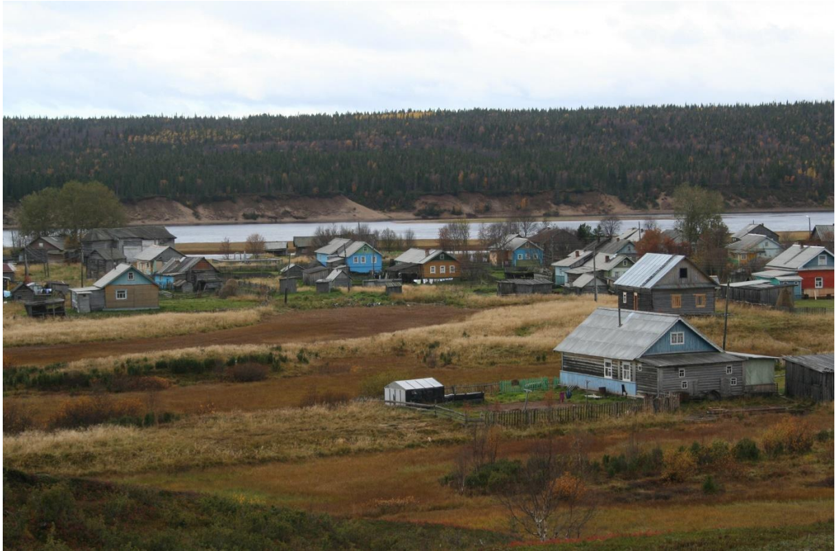
Kuva 31. Varzagan itärannan yleisilmettä kukkuloilta katsottuna..