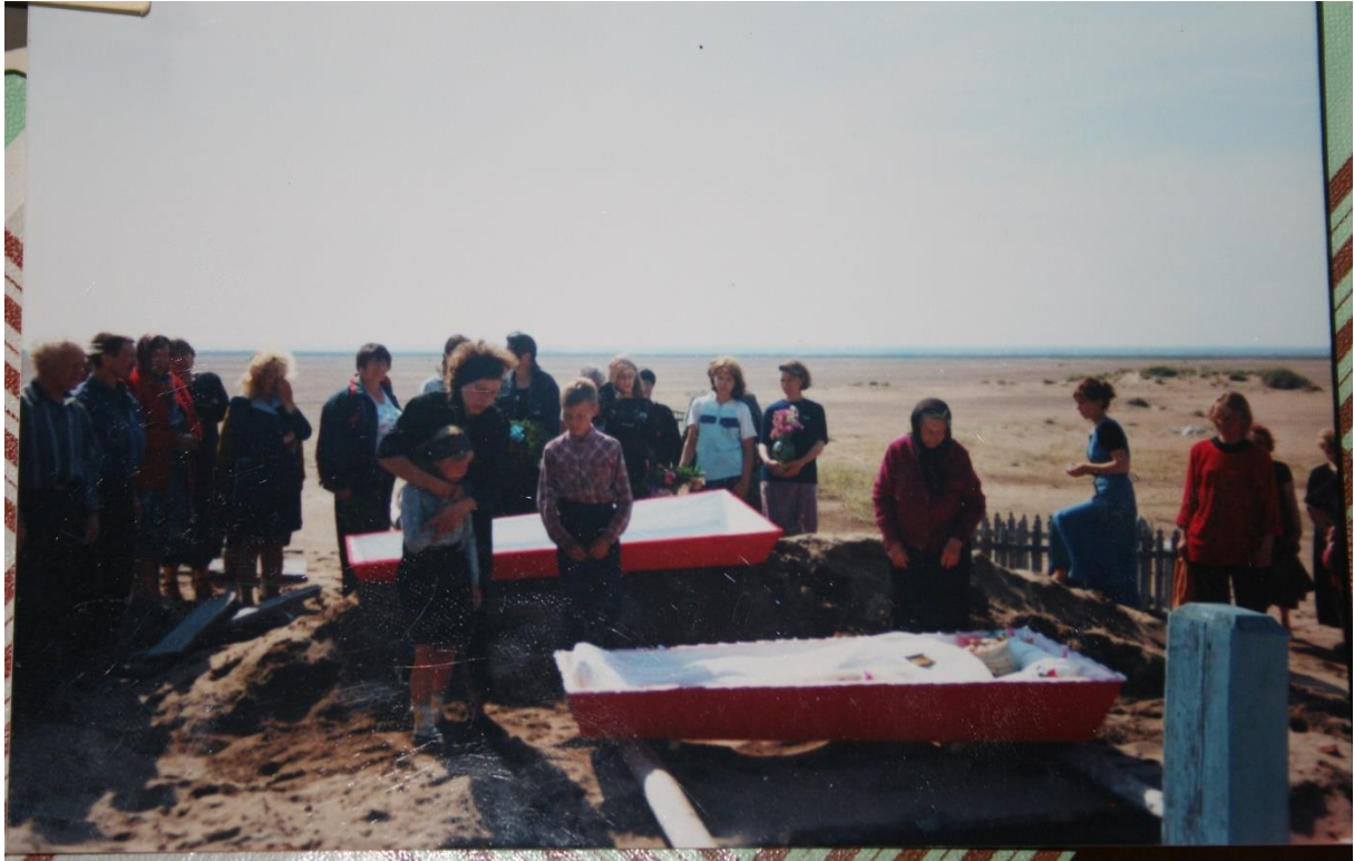
Kuva 66. Kuusiniemessä hautajaiset.