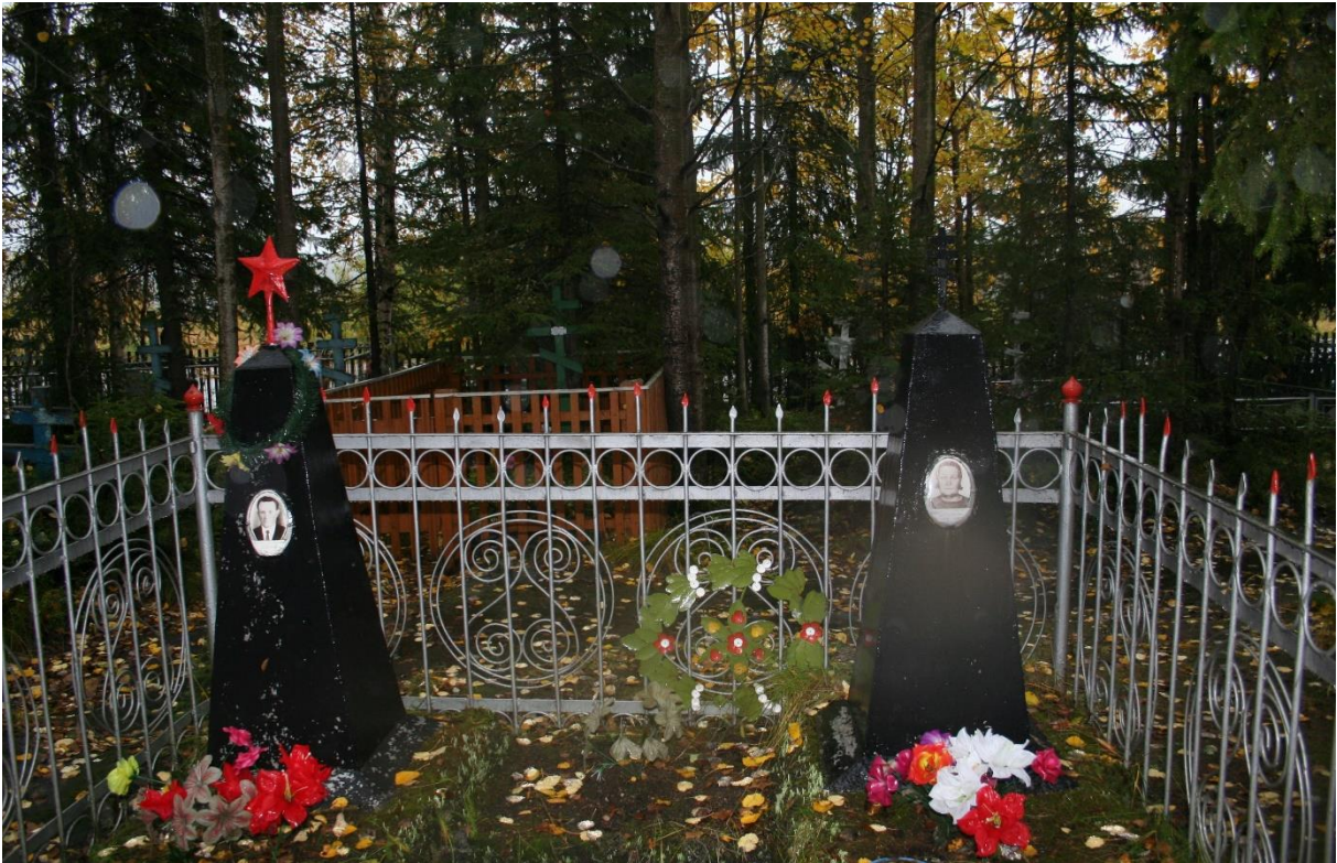
Kuva 73. Umban kalmiston kivipaasit. Miehen paasissa on punainen tähti ja naisella on kristillinen symboli