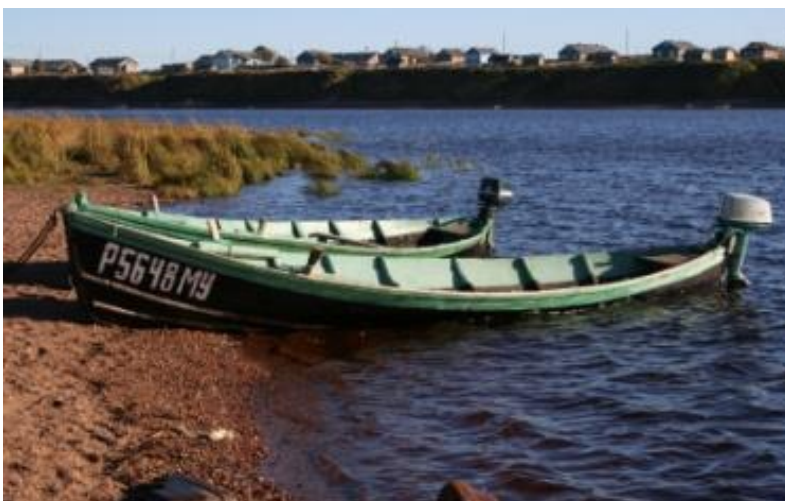
Kuva 24. Varzugajoki jakaa kylän kahteen osaa. Veneet on pakko rekisteröidä.