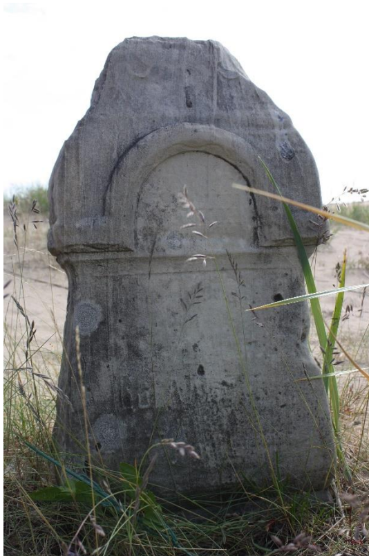
Kuva 81. .Kaupunkikulttuuria edustava kivinen ristin jalusta.kolo hiekkaa on peittämässä haudan. Kuusiniemi.