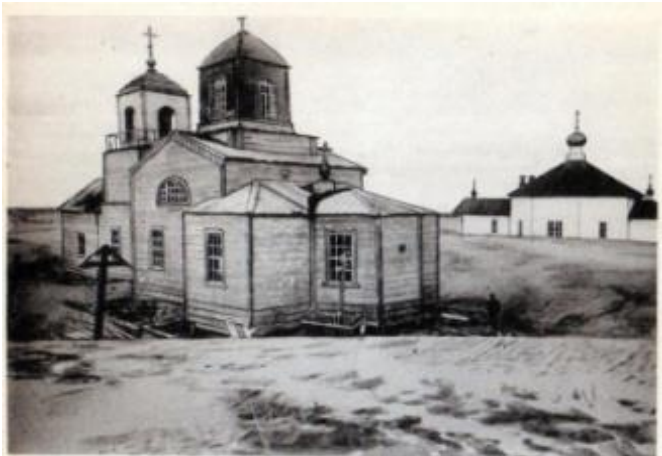
Kuva 23. Kuusiniemen entiset kesä- ja talvikirkot, välimatka niiden välillä on n. 100–200 metriä.