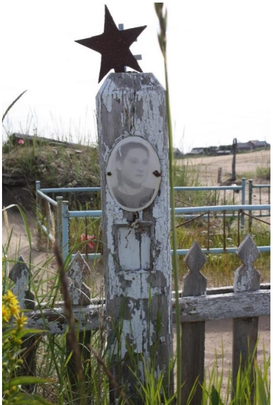
Kuva 80. Punainen tähti, paalussa on vainajan kuva ja mahdollisesti ikonille., Kuusiniemi.