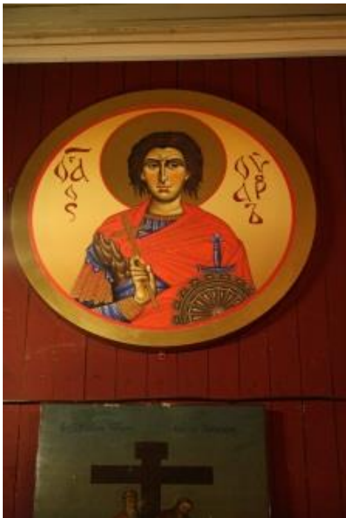
Kuva 62. Varus Egyptiläisestä on myös ikoni Varzugan talvikirkossa.