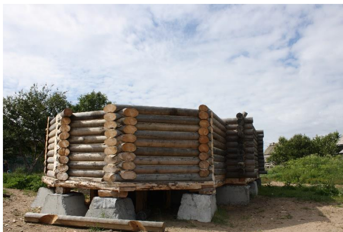
Kuva 21. Kuusiniemen uutta kirkkoa rakennetaan.