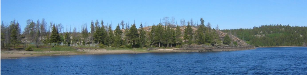
Kuva 72. Umban kalmosaari.