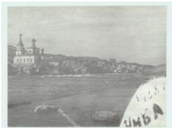
Kuva 3. Umban entinen kirkko. Umban postikortti.