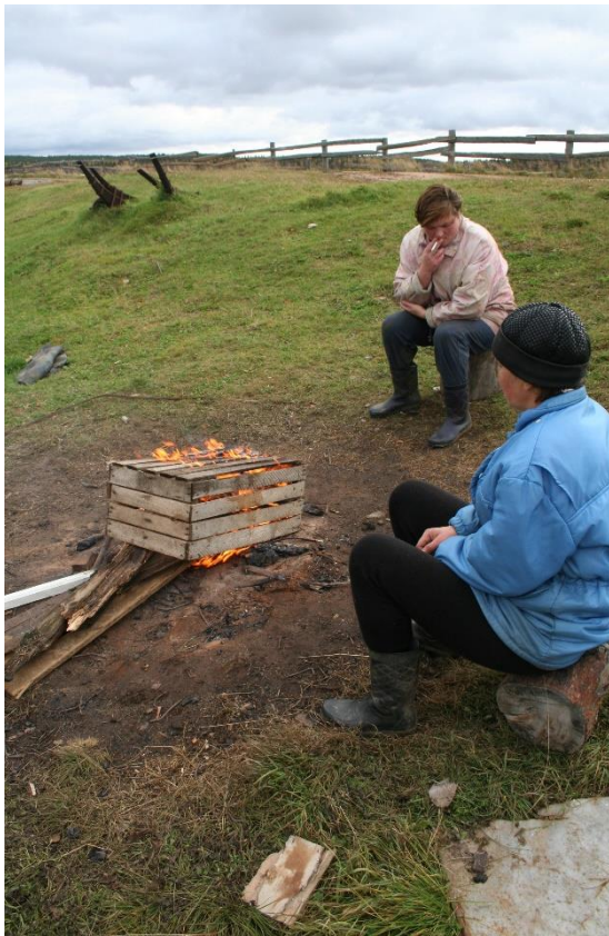
Kuva 41. Varzugan länsirannalla kolhoosin työntekijät ovat tupakkatauolla ja lämmittelemässä nuotion ääressä