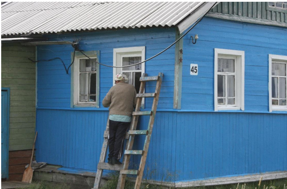
Kuva 30. Varzugassa länsirannan talojen maalaaminen on vuosin saatossa yleistynyt.