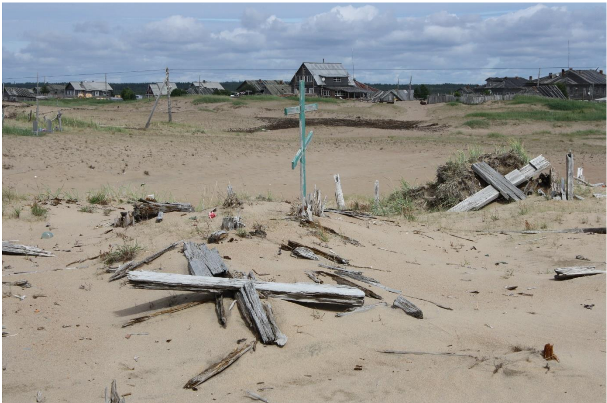
Kuva 77. Kuusiniemen kalmisto, ristit saavat kaatua ja lahota.