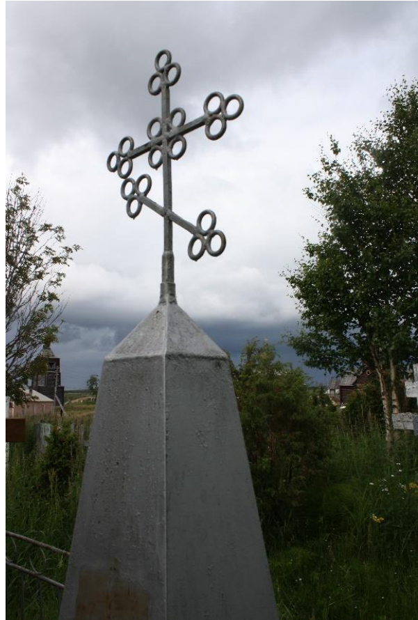
Kuva 87. Varzugan Länsirannan metallinen obeliski, jonka päällä neliapilaristi.