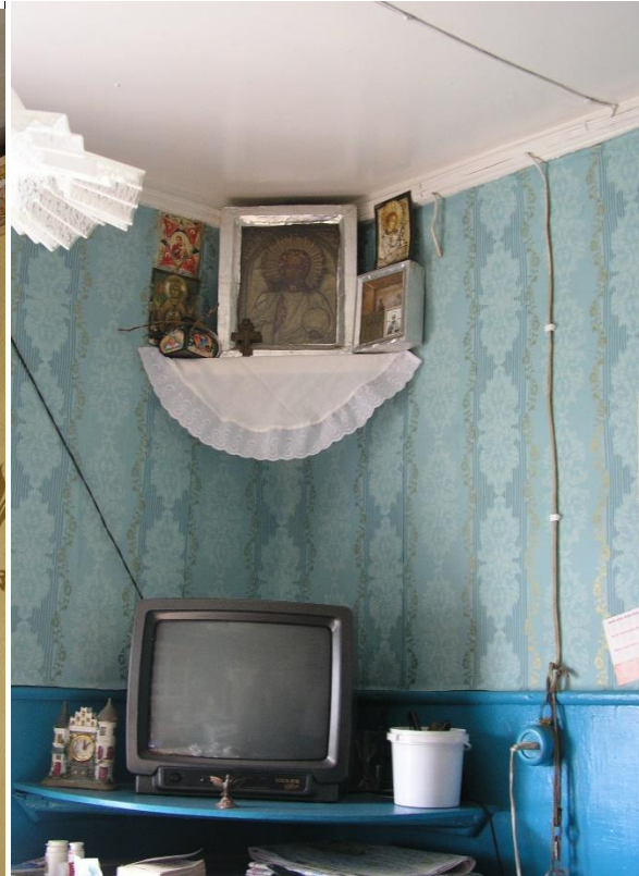
Kuva 33. Ikoninurkkaus Nina Arlukevits Aleksejna, Kuva 34. Ikoninurkkaus Tabanina Zoja Pavlovna, Varzuga. Kuusiniemi.