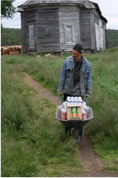
Kuva 45. Kolhoosin työntekijä tuo itärannan kauppaan myytävää tavaraa, Varzuga.