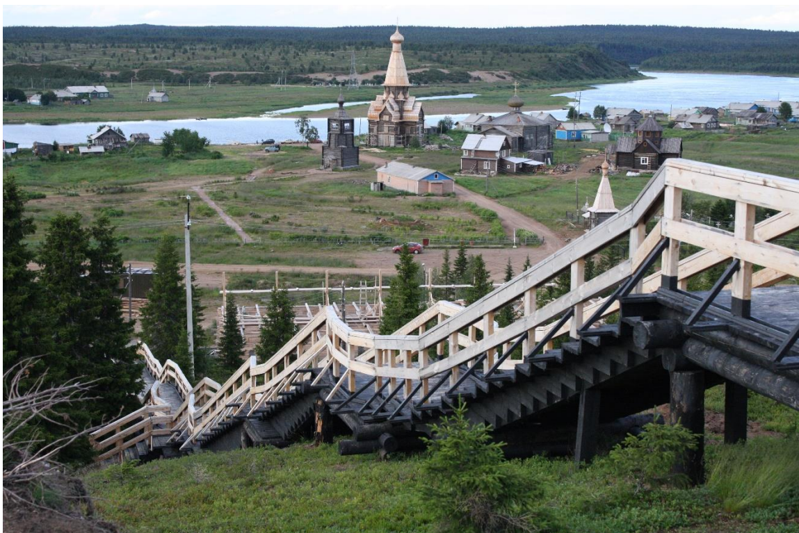
Kuva 26. Länsirannan kirkkokenttä, koulun uudet tiedonportaat.