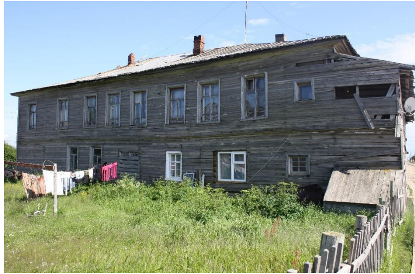
Kuva 18. Kuusiniemen uusi talo, jossa on koristeelliset karjalaisvaikutteiset ikkunapokat ja räystääskoriste. Kuva 19. Koulun entinen internaatti on nykyisin asuntoina.