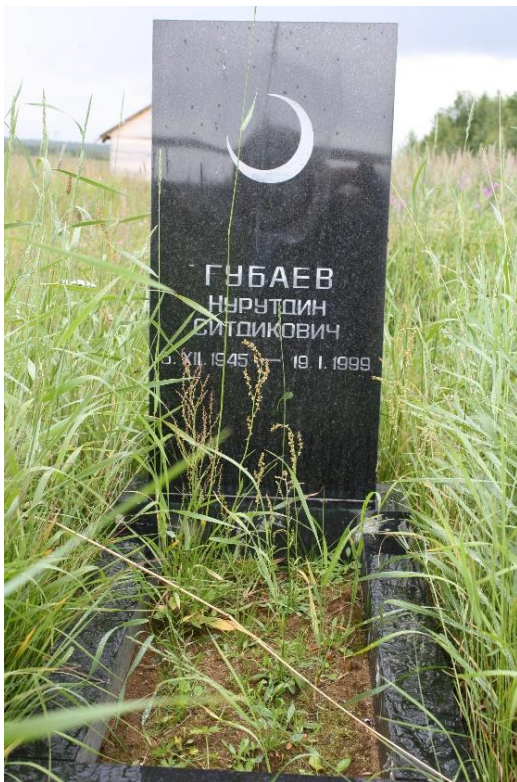
Kuva 88. Varzugan länsiranta muslimihauta.