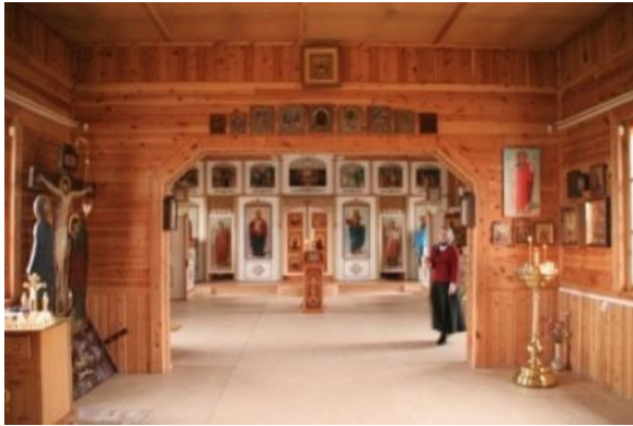
Kuva 1. Kantalahden uusi ortodoksinen kirkko.