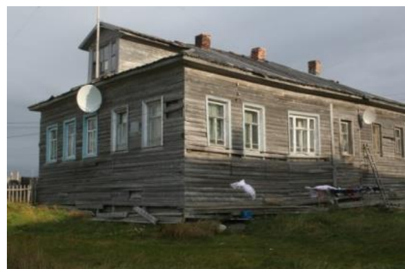
Kuva 11. Kuusiniemi, pomoritalo ja taivaskanava.