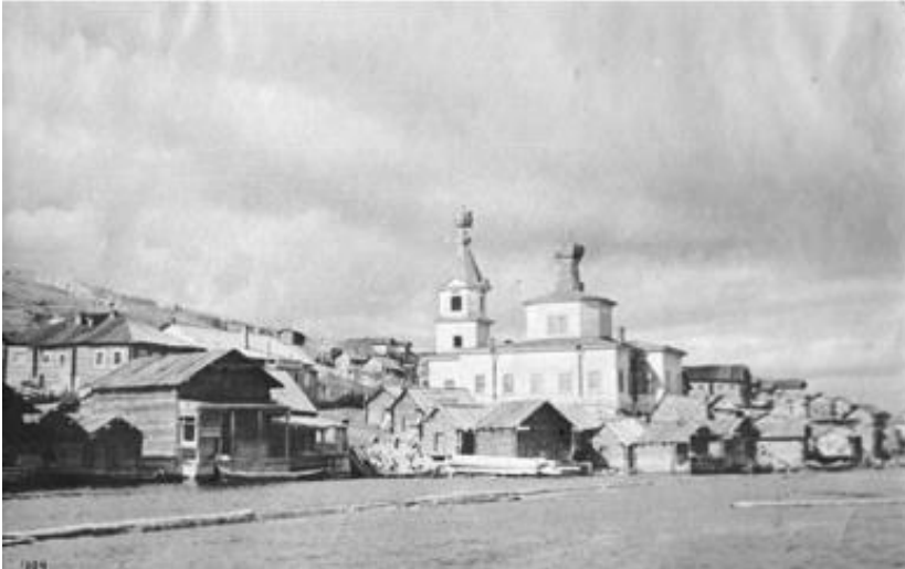
Kuva 22. Kuusiniemen vanha kirkko.