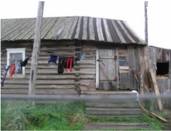
Kuva 8. Kaskarannan pyykit ja luuta.