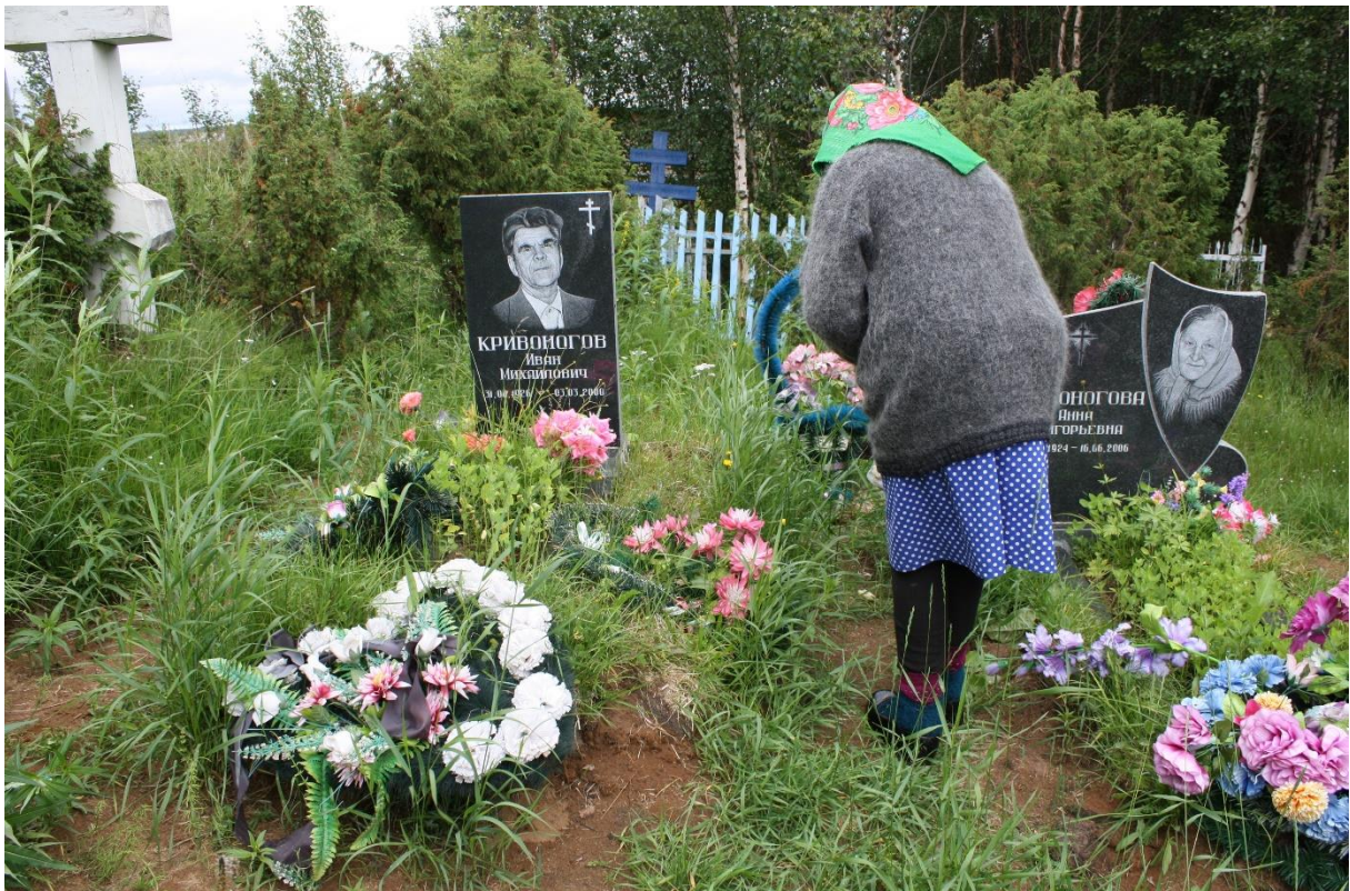
Kuva 69. Varzuga nainen kävi muistamassa omaisia, toi leivänmuruja.