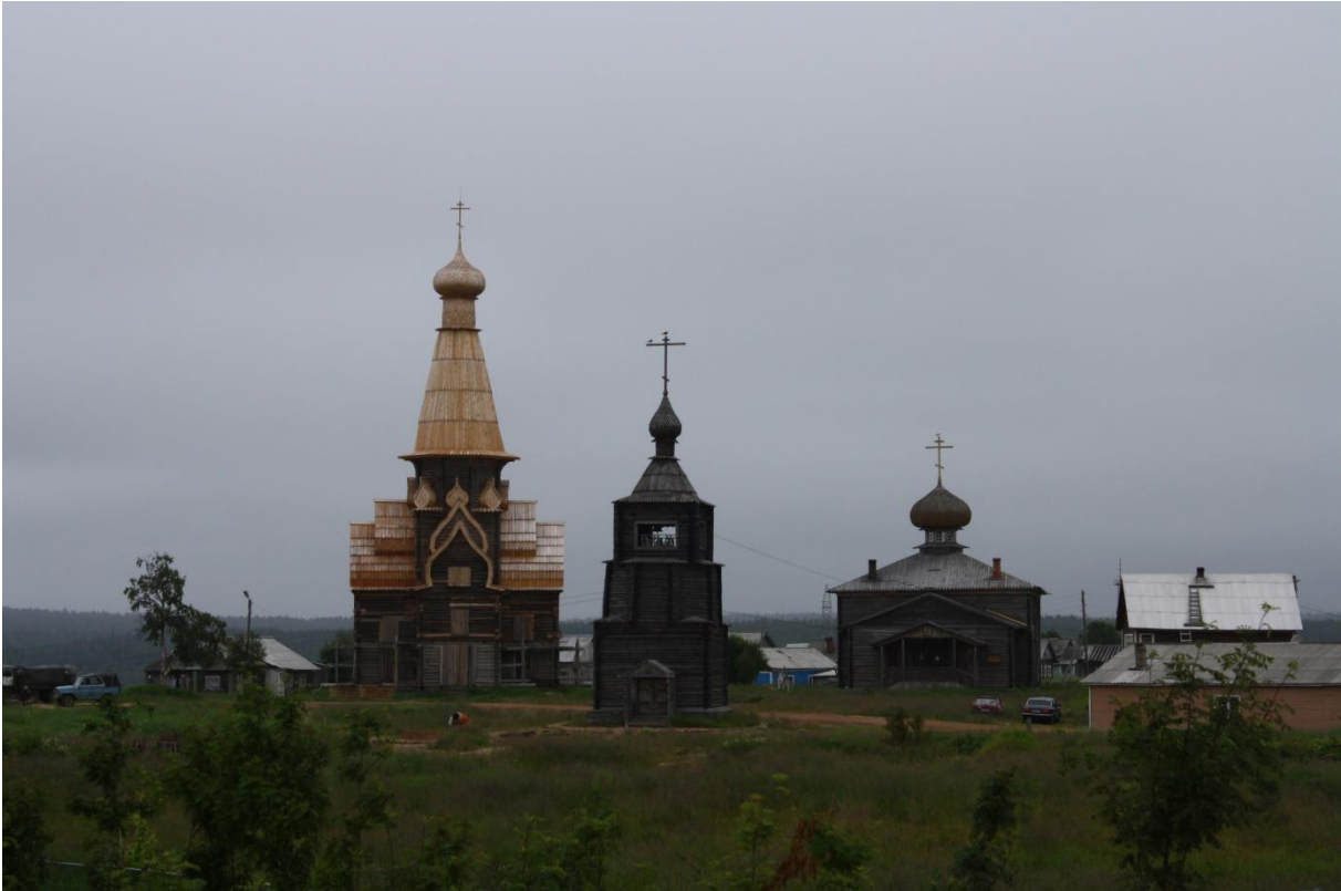
Kuva 54. Varzugan länsirannan kirkkokenttä. Vas. Uspenskin kesäkirkko, kellotapuli, Afanasian talvikirkko, pappila ja kolhoosin entinen kauppa.