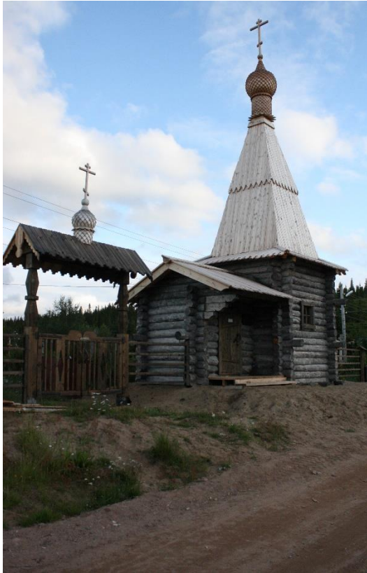
Kuva 60. Varzugan länsirannalla kirkkokentän ja kalmiston lähellä on uusi tsasouna, joka oli valmiina v. 2009.