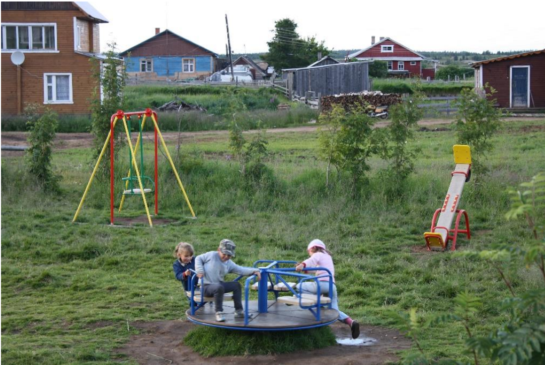
Kuva 28. Varzugan länsirannan lasten leikkipuisto on saatu valmiiksi.