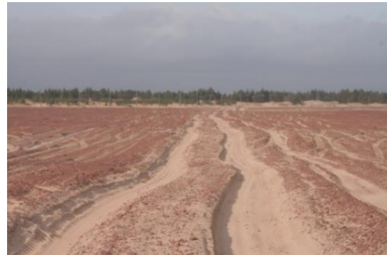
Kuva 13. Kuusiniemen eroosiota, taustalla on istutettua mäntyä.