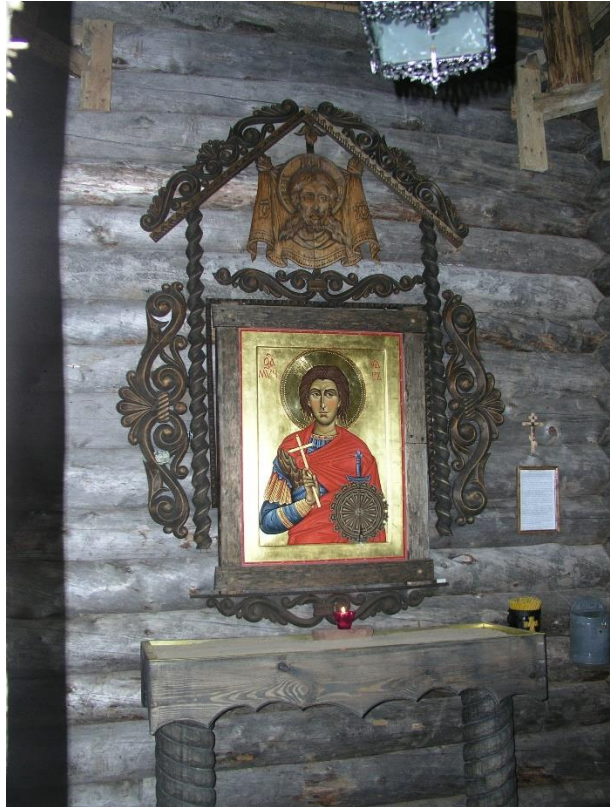
Kuva 61. Länsirannan tsasounan Sali ja nuoren marttyyrin ikoni.