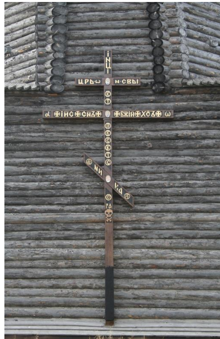
Kuva 57 Länsirannan kelotapuli v. 2007.