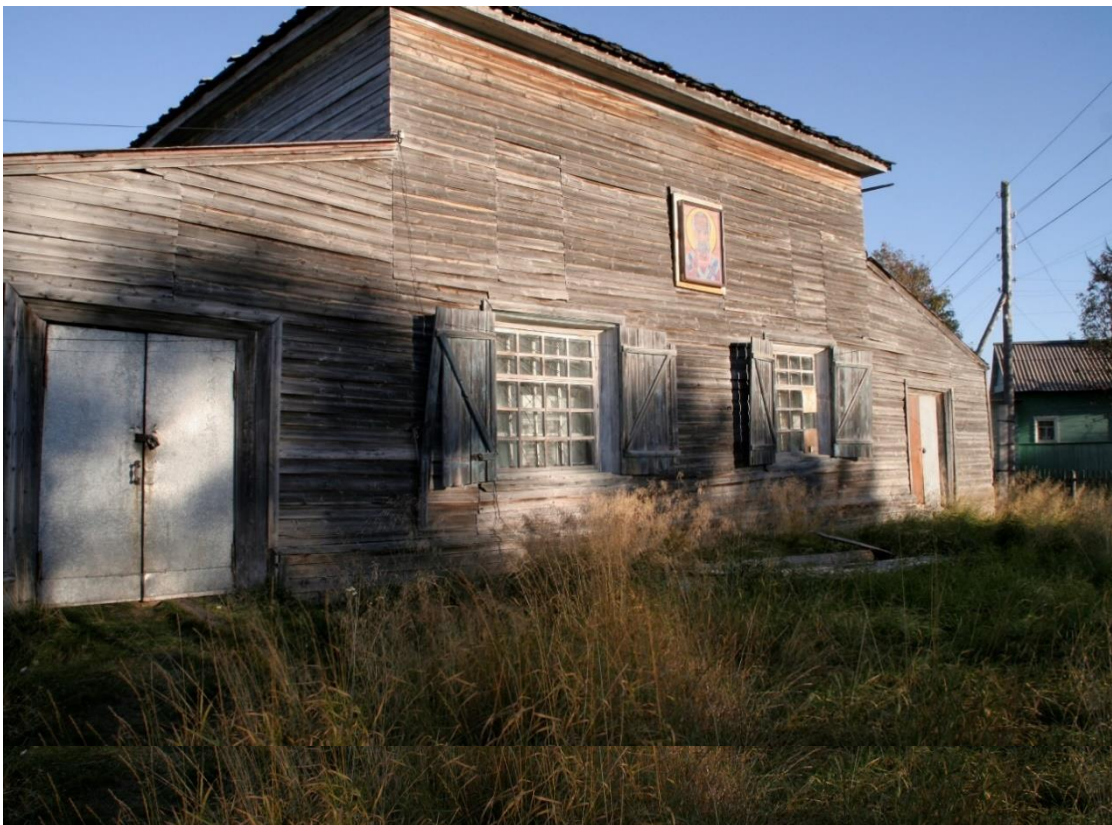
Kuva 46. Itärannan Nikolain kirkko toimii kolhoosin kauppana, Varzuga.