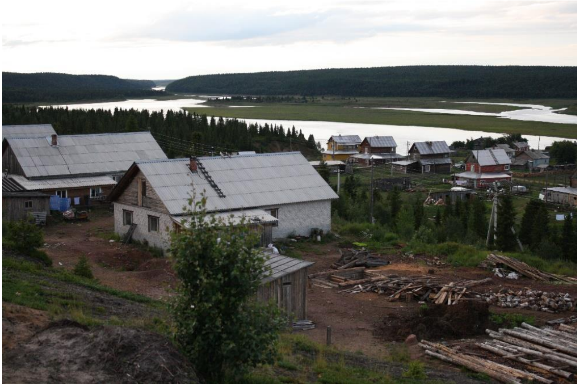
Kuva 25. Varzugan länsirannalla on kolhoosin rakentamia taloja.