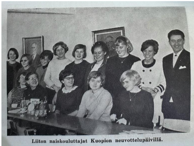
Kuva 2: Liiton naiskouluttajat kuvattuna Kuopion neuvottelupäivillä. (Pesäpallokalenteri 1966, 55.)