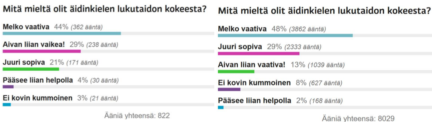
KUVA 4. Ylen sivuilla olevia kyselyitä lukutaidon kokeesta: vasemmalla syksy 2018, oikealla kevät 2019. 8

Olisi myös mielenkiintoista kuulla lukiolaisten omia ajatuksia lukutaidon kokeesta ja siitä, mittaako se heidän mielestään heille merkityksellisiä lukutaidon osa-alueita. Ylen sivuilla on saanut vastata kyselyyn syksyn 2018 ja kevään 2019 lukutaidon kokeista (kuva 4). Kyselyn mukaan melkein puolet 822:sta vastaajasta oli sitä mieltä, että syksyn 2018 lukutaidon koe oli melko vaativa. Aivan liian vaikea oli toiseksi suosituin vastausvaihtoehto. Kevään 2019 lukutaidon kokeen mielipiteitä kysyttäessä melko vaativa oli jälleen suosituin vaihtoehto, mutta toisella sijalla oli tällä kertaa juuri sopiva. Toki pitää tiedostaa, että kyselyyn on voinut vastata kuka tahansa (opiskelijat, oppilaat, vanhemmat) eikä ole tietoa, onko kyselyyn voinut vastata useamman kerran. Asiaa olisi kuitenkin mielenkiintoista tutkia tarkemmin.