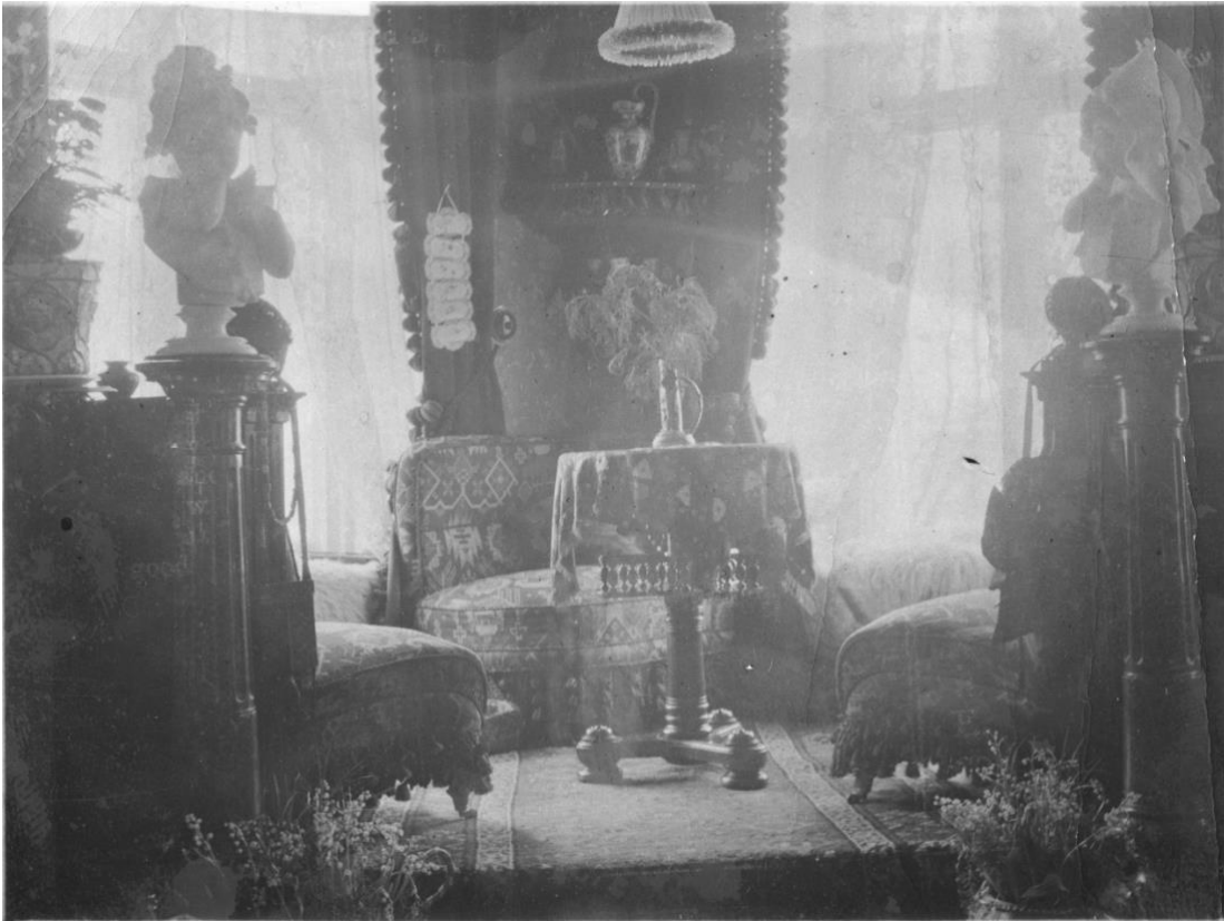
Kuva 2: Hélènen huone Hämeenkadun kodissa, noin 1902.