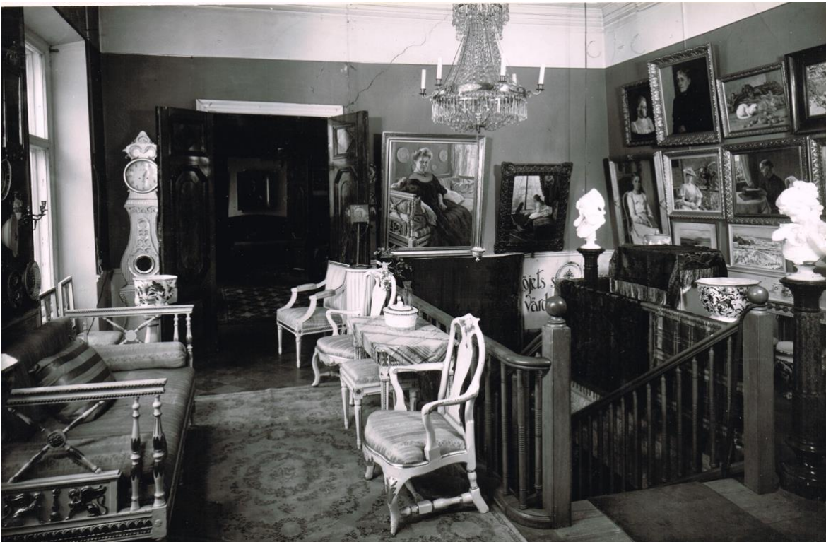
Kuva 3: Hämeenkatu 30 vuonna 1954.