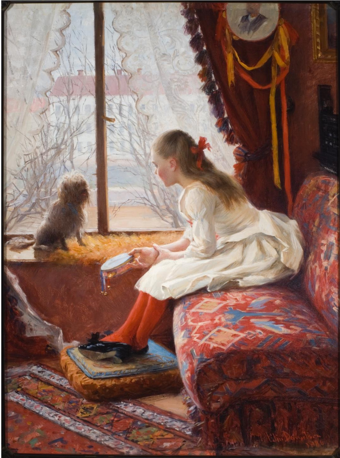
Kuva 1: Elin Danielson-Gambogi. Walborg Jacobssonin muotokuva 1890. Öljy kankaalle. 76,5 x 57,5cm. Ett Hem -museo, Turku.