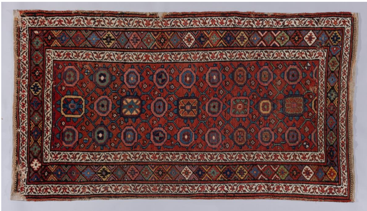
Kuva 5: Hélénen huoneen matto. Ett Hem -museo, Turku.