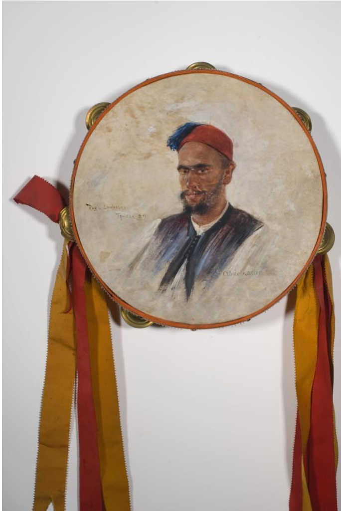
Kuva 6: Tamburiini. Maalannut Robert Lundberg. 5,0 x 27,0 cm. Ett Hem -museo, Turku.