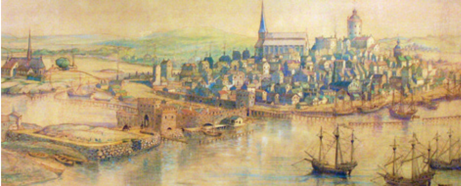
Kuva 3: Liikenne Turun ja pääkaupunki Tukholman välillä oli vilkasta suuren osan vuotta. Advokaattien piti välillä hakea lykkäystä jutuille päämiestensä ja -naistensa matkojen vuoksi. Tältä Tukholma näytti 1570-luvulla flaamilaisen Frans Hogenbergin (1535–1590) etsauksen pohjalta tehdyssä maalauksessa.