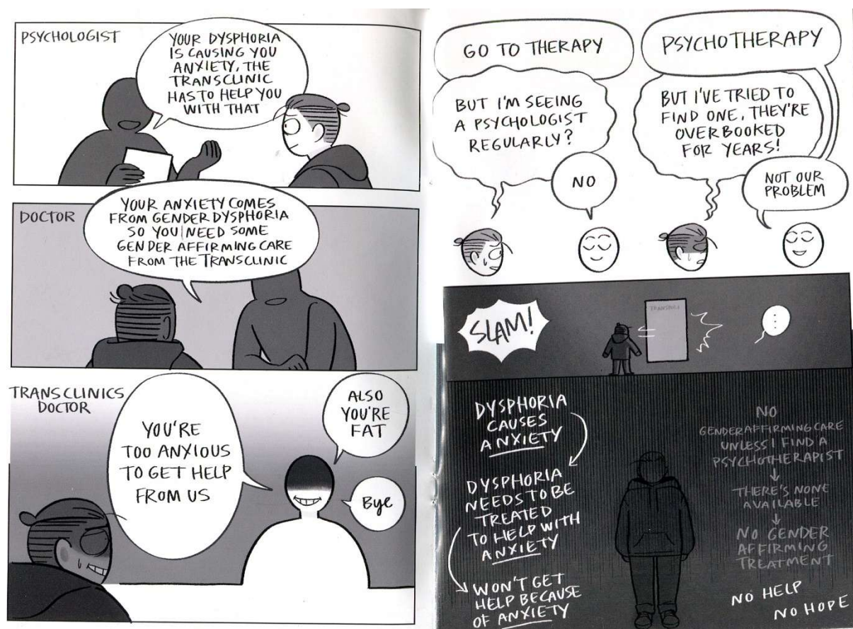
Kuva 4. Uolevi Äikkään teoksesta Cisn't. Kuva julkaistu tekijän luvalla.

Myös Äikäs kuvittaa sarjakuvassaan transpolin ja diagnoosin hankkimisen vaikeuksia. Asialle on omistettu sarjakuvassa useita sivuja tai ruutuja pitkin sarjakuvaa. Otan tarkemman tarkastelun alle seuraavan aukeaman Äikkään teoksesta.