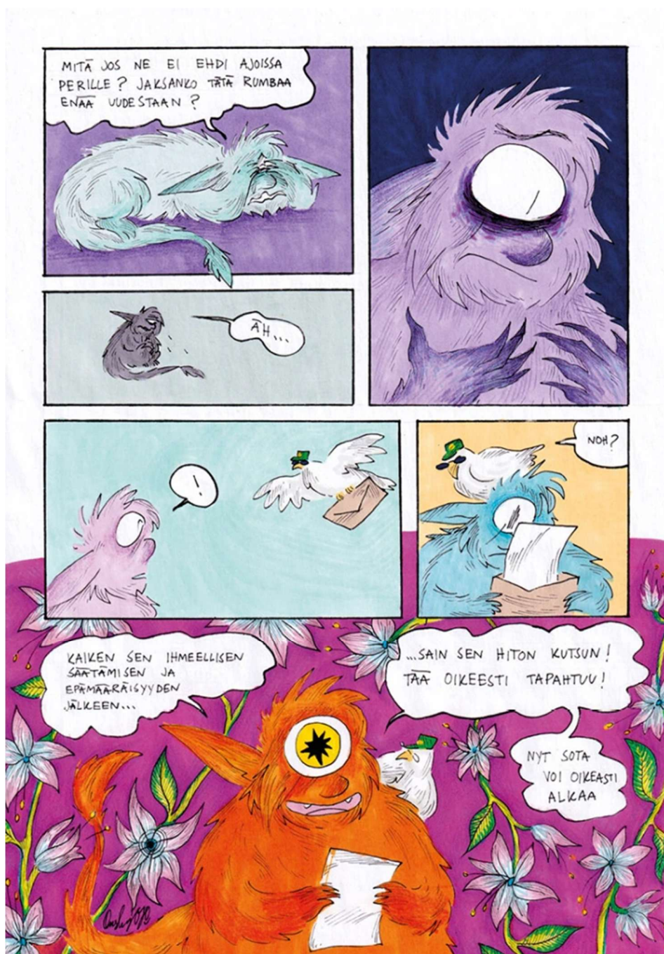
Kuva 6. Onsku Franckin teoksesta Lahden Setan Zine 2021. Kuva julkaistu tekijän luvalla.

Franckin teos on poikkeava Äikkään ja Tiilikan teoksiin nähden, sillä Franckin teos keskittyy erilaisiin transpolin lähetteen hankkimisen monimutkaisuuden aiheuttamiin tunnetiloihin ja kuvaakin niitä värikkäästi ja jopa vauhdikkaasti. Peikkohahmolla on yleensä vain yksi silmä, mutta joissain ruudussa silmät lisääntyvät tai silmä alkaa valua päästä irti itkemisen takia.