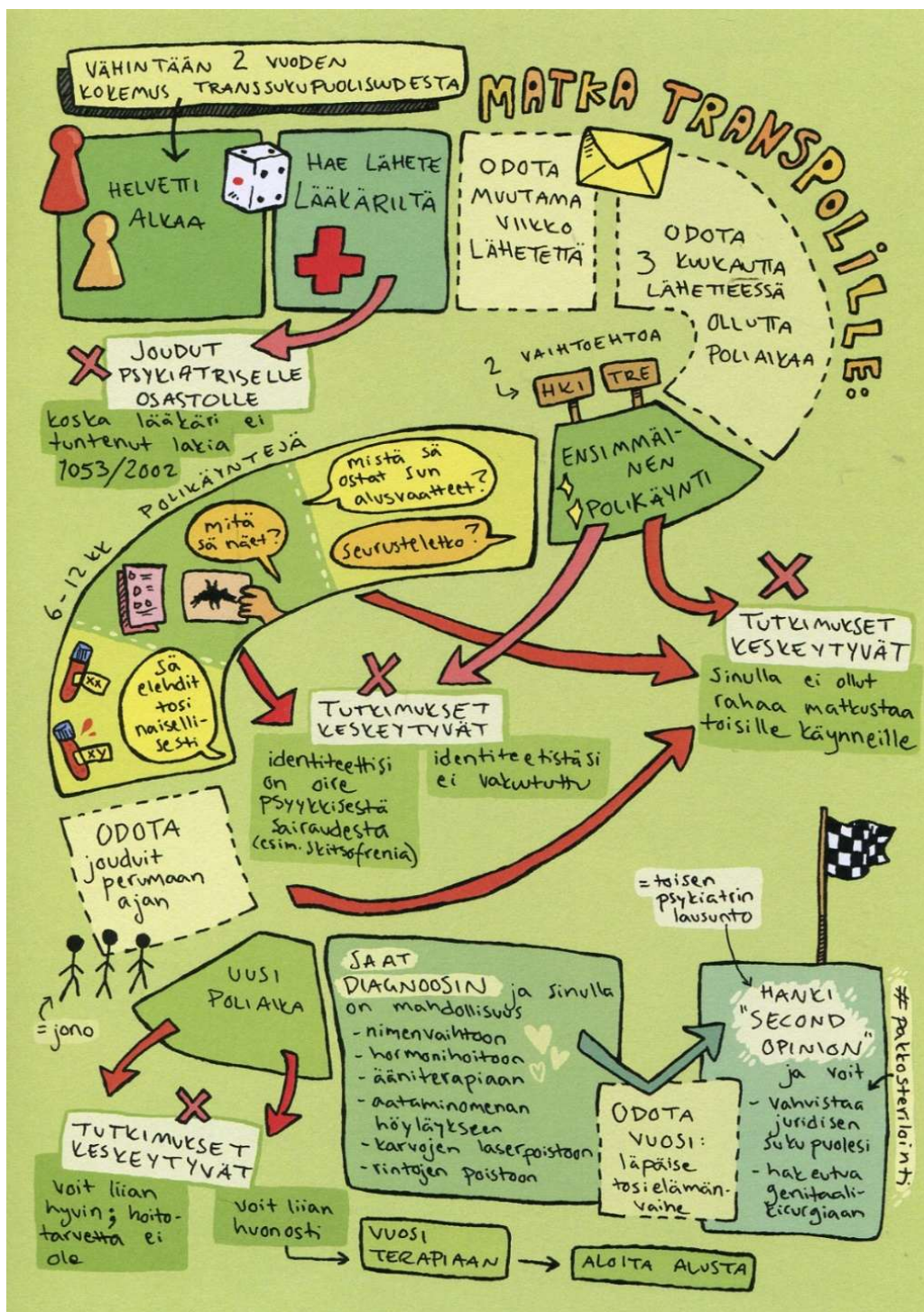
Kuva 3. Rasmus Tiilikan teoksesta ...mutta sehän on pojan nimi. Kuva julkaistu tekijän luvalla.

Tiilikan sarjakuvan sivussa erilaiset nuolet risteilevät eri suuntiin ja tekstit limittyvät luoden hankalasti seurattavan useamman mahdollisen lopputuleman sisällään pitävän aikajan. Lautapelimäinen kuvitus muistuttaa enemmän infografiikkaa, kuin sarjakuvaa ja se erottuu siksi Tiilikan teoksen muuten perinteisestä sarjakuvan estetiikasta. Tämä korostaa transpolin monimutkaisuutta ja kliinisyttä. Infografiikkamainen kuvitus ilman sarjakuvan hahmoja näyttää instituution epäinhimillisen puolen.