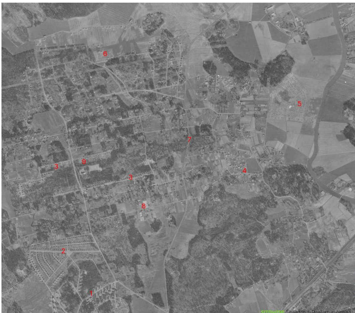
Kuva 2: Pakila vuonna 1950.