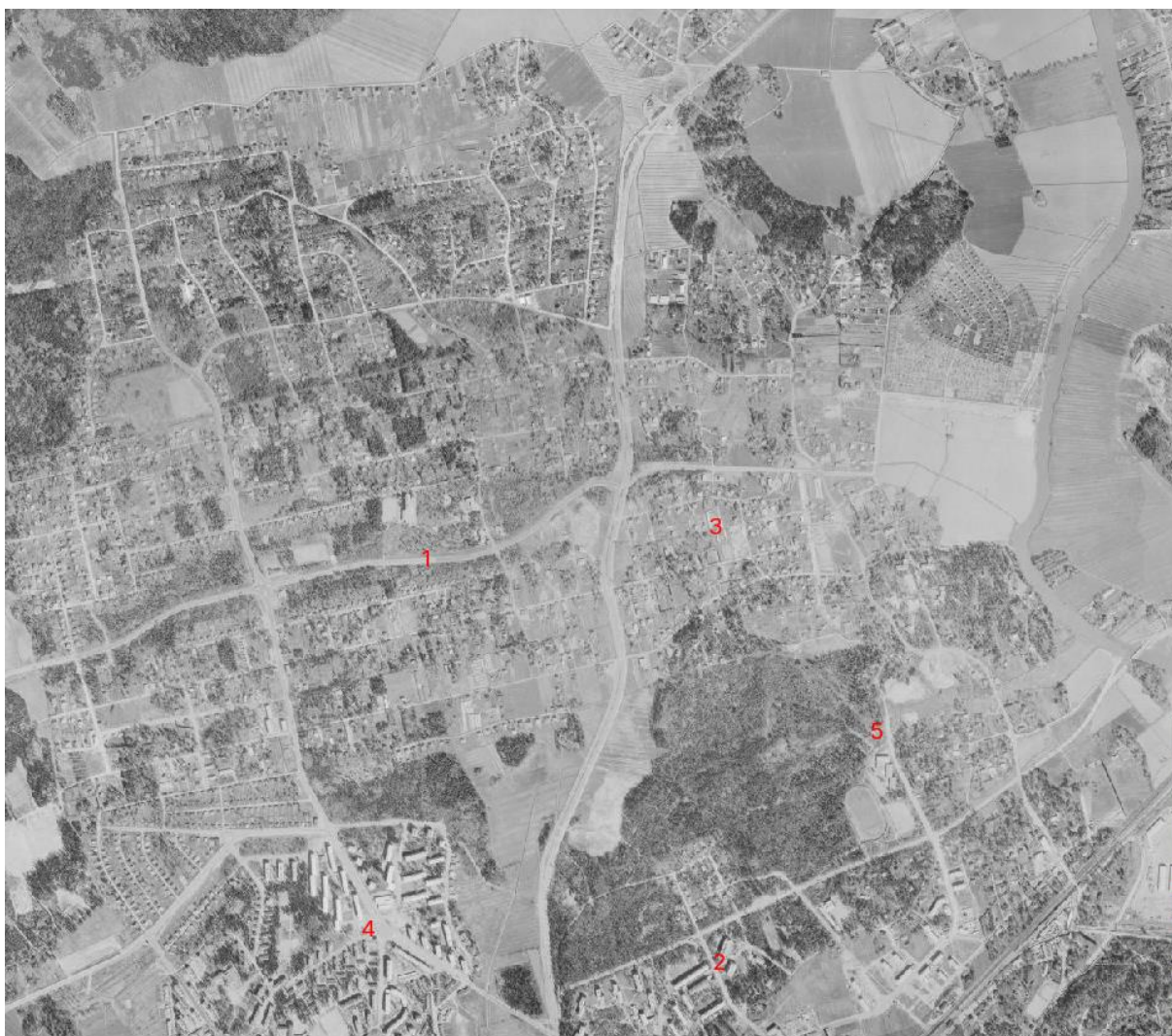
Kuva 3: Pakila vuonna 1964.