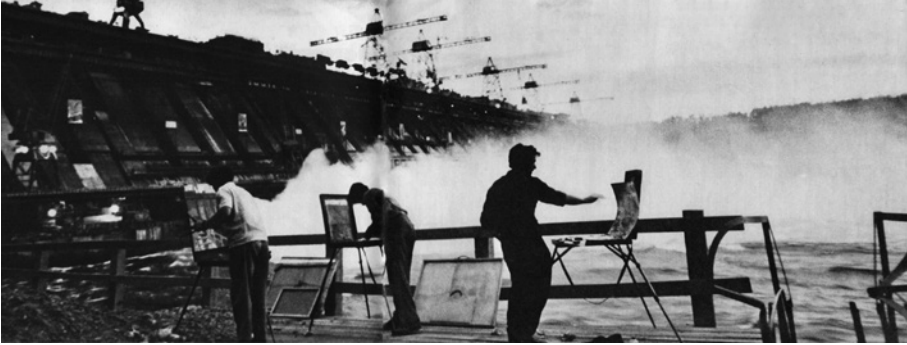
Kuva 1. Moskovalaiset taidemaalarit työn tiimellyksessä Bratskin voimalaitostyömaalla.