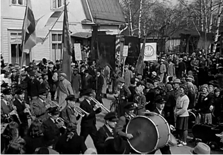
Kuva 5. Vappu 1945 -elokuvassa musiikki poimitaan etualalle, kun kuvamateriaalin johtava elementti on Kymin vappukulkueen kärjessä marssinut puhallinorkesteri.

Kolmas käyttöyhteys, jossa usein nostetaan musiikki äänikuvan keskiöön, juhlistaa työn tekemistä valkokankaalla tapahtuvana toimintana. Kun valkokankaalle vyörytetään työnäkymiä, estetisoiden työläisten harjaantuneita liikkeitä ja keskittyneisyyttä, musiikki korvaa usein selittävät kielelliset kommentit ja toisaalta myös työstä oletettavasti lähtevät äänet. Nämä kuvat ovat usein teollisuuslaitoksista, mutta myös naisten työpaikkoja; naisten tehokasta, osaavaa työskentelyä voidaan kuvata musiikin kannattelemana, rytmittämänä ja estetisoimana. Tämä on jossain määrin ominainen piirre ajan työväenliikkeen elokuvien musiikinkäytölle.