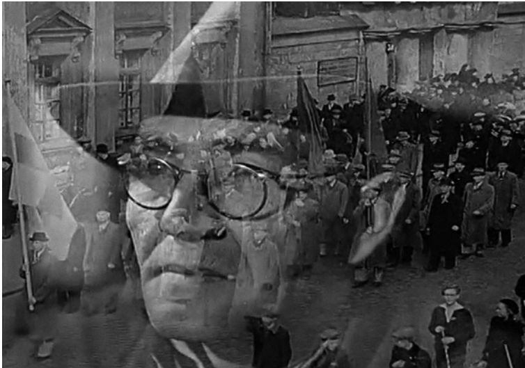
Kuva 4a ja 4b. Asuntopula-elokuvaa kehystää kaksi marssia. Aloituksessa soi saksalainen, natsijoukkojen marssiin filmillä tarkasti synkronoitu sotilasmarssi. Loppujakson äänimaisemaa määrittää suomalainen Työväen marssi, jonka soidessa suomalaista työväkeä kuvataan omissa rytmisään kulkuvina, itsenäisesti ajattelevina ja isänmaallisina toimijoina.