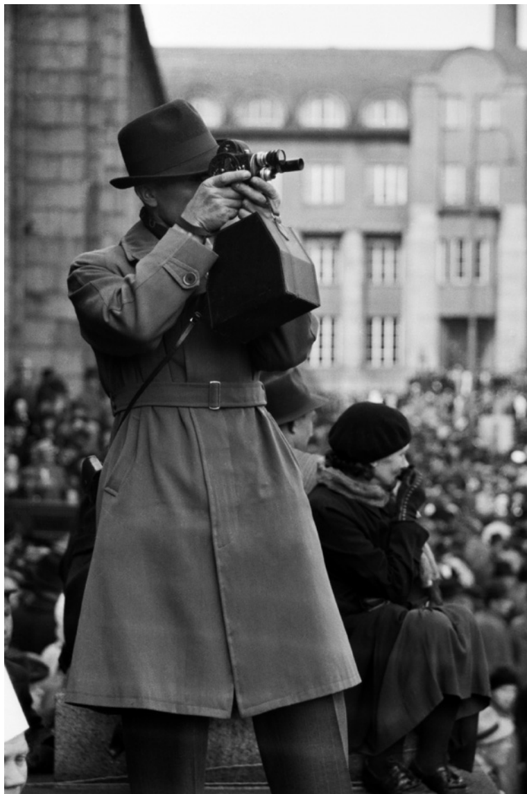
Kuva 1. Elokuvaaja työssään tallentamassa vasemmistopuolueiden liittoutuneiden voiton kunniaksi järjestämää rauhanjuhlaa 10. toukokuuta 1945 Helsingin Rautatientorilla.