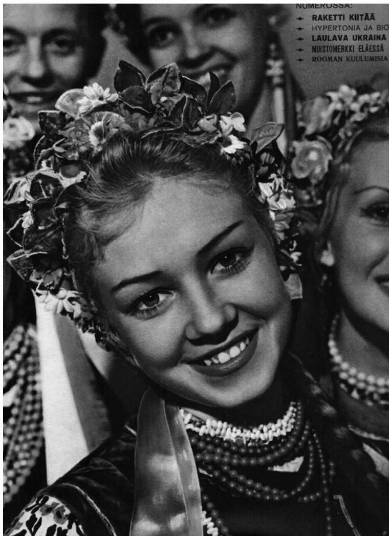
Kuva 6. Yksityiskohta Neuvostoliitto-lehden kannesta. Valokuvassa esiintyjä Ukrainan kolmansilta kirjallisuus- ja taidepäiviltä Moskovasta.