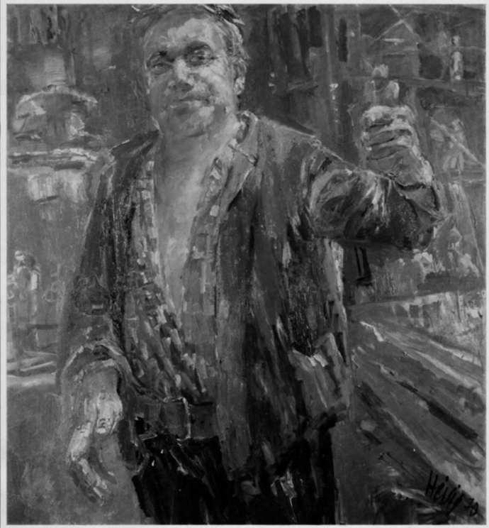
Kuva 2. DDR-Revuen kannessa on Bernhard Heisigin maalaus työn sankarista (Prikaatinvastaava, 1970). Lähde: DDR-R 10/1973.