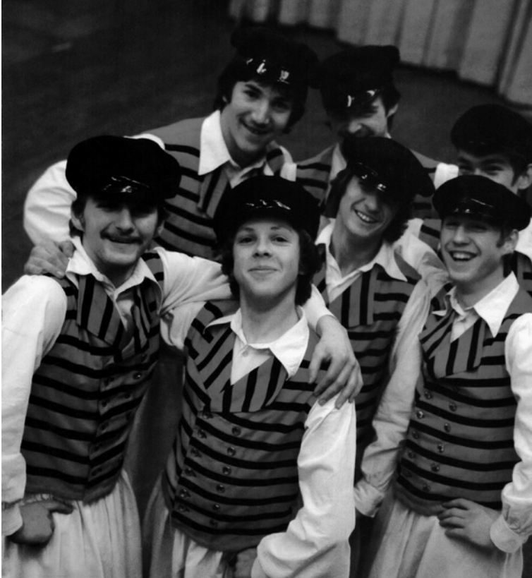
Kuva 5. DDR-Revuen kanssa hymyilee Ribniz-Damgartenin kuitulevytehtaan tanssiryhmä Mönchsgutin kalastaja-asuissa.

Myös Neuvostoliitto -lehden taiderepresentaatioissa titteli ”kansantaiteilija” toistuu tämän tästä. Esimerkiksi sosialistisen maiden taidenäyttelyn vuonna 1959 avaa ”Neuvostoliiton kansantaiteilija S. Konenkov”, valkopartainen, valkoihuksinen, tietäjän olinen vanha mies. 56 Termin käyttö poikkeaa DDR-Revuen vastaavasta kuitenkin siinä, että Neuvostoliitossa ”kansantaiteilija” oli arvonimi virallisen taide- ja kulttuurihallinnon näkökulmasta