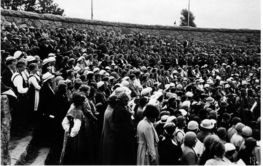
Kuva 2. Harjoitukset sekakuoroille Suomen Työväen Musiikkiliiton laulujuhlassa Viipurissa 1935.