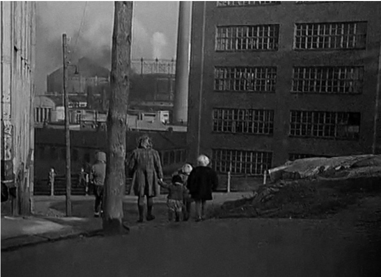
Kuvat 3a ja 3b. Katsoja johdatetaan Asuntopula-elokuvan haastavimmassa kohdassa räikeään epätasa-arvoisten asumisolojen äärelle häiritsevän äänekkäällä symbolin iskulla yhtäikää animoidun valkokankaan ”särkemisen” kanssa.