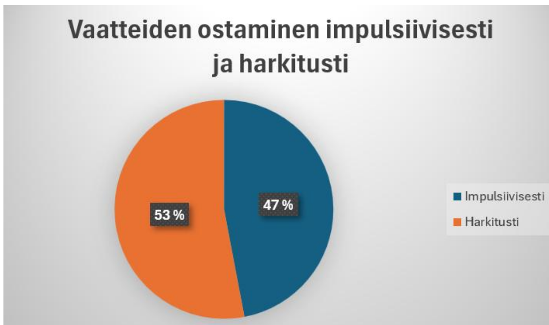
Kuvio 3. Vaatteiden ostaminen impulsiivisesti ja harkitusti (N=17).

Kuvio 3 havainnollistaa, että vastaajien ostokäyttäytyminen jakautui melko tasaisesti impulsiivisen ja harkitun ostamisen välillä. Hieman yli puolet vastaajista ilmoittivat ostavansa vaatteita harkitusti, kun taas lähes puolet tunnustivat ostavansa myös impulsiivisesti. Tämä viittaa siihen, että vaikka budjetti ohjaa opiskelijoiden valintoja, kaikki ostokset eivät kuitenkaan ole täysin ennalta suunniteltuja. Opiskelijat joutuvat tasapainottamaan tarpeitaan, halujaan sekä taloudellisia rajoitteitaan, mikä tekee ostokäyttäytymisestä monimuotoista.