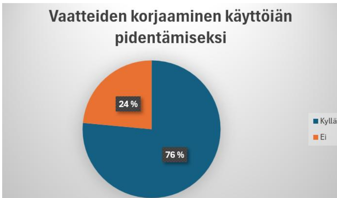
Kuvio 4. Vaatteiden korjaaminen käyttöiän pidentämiseksi (N=17).

Kuvio 4. osoittaa, että vaatteiden korjaaminen oli kuitenkin yleistä opiskelijoiden keskuudessa. Suurin osa vastaajista kertoi korjanneensa omia vaatteitaan, esimerkiksi paikkaamalla rikkiäisiä kohtia pidentääkseen vaatteiden käyttöikä. Pienet korjaukset nähtiin luonnollisena ratkaisuna, joka auttaa säästämään rahaa ja minimoimaan turhaa kulutusta. Tällaiset toimenpiteet tukevat kestävästä pukeutumisesta, sillä ne mahdollistavat vaatteelle pitkän käyttöiän ja vähentävät ostamisen tarvetta. Vaatteiden korjaaminen ja muokkaaminen voidaan nähdä osana opiskelijoiden strategioita yhdistää taloudellisuus, tyyli ja käytännöllisyys.