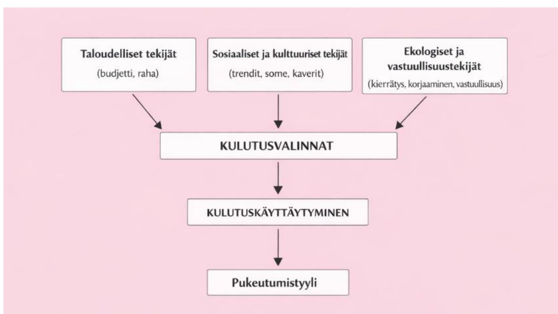
Kuvio 1. Kulutusvalintojen muodostuminen

Teoreettinen viitekehys osoittaa, että opiskelijoiden pukeutuminen rakentuu monista erilaisista tekijöistä. Taloudelliset rajoitteet ohjaavat valintoja, mutta samalla vastuullisuus ja yksilöllisyys nousevat vahvoiksi arvoiksi. Käytettyjen vaatteiden ostaminen, käsityö ja vaatteiden korjaaminen tarjoavat keinoja pukeutua edullisesti ja kestävästi, mutta samalla rakentaa omaa identiteettiä. Opiskelijapukeutuminen ei siis ole pelkästään selviytymistä pienellä budjetilla, vaan myös luovuutta, arvojen näkyväksi tekemistä ja kestävästä kulutuskulttuurin ylläpitämistä arjen tasolla.