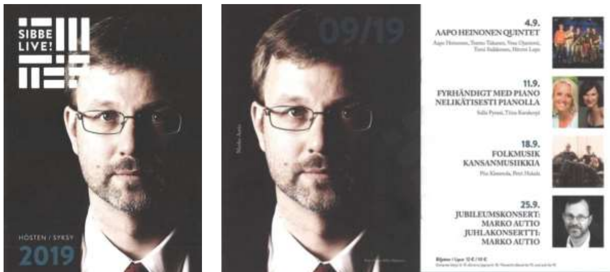
Kuva 7. Sibelius-museon syyskauden 2019 esitteen kansi ja sisäaukeama.