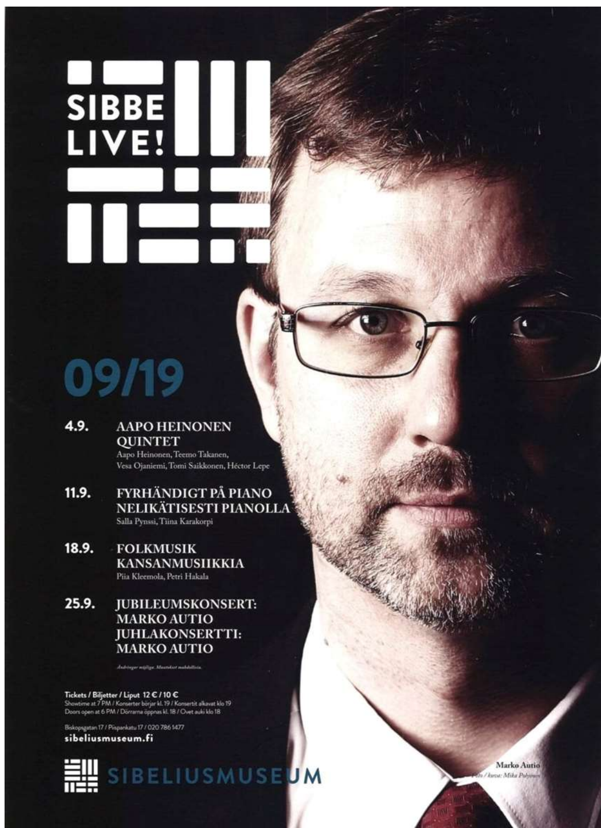
Kuva 1. Sibelius-museon Sibbe live! -konsertisarjan syyskauden 2019 mainosjulistetta koristi Marko Aution kuva. Mainosjuliste: Sibelius-museo.