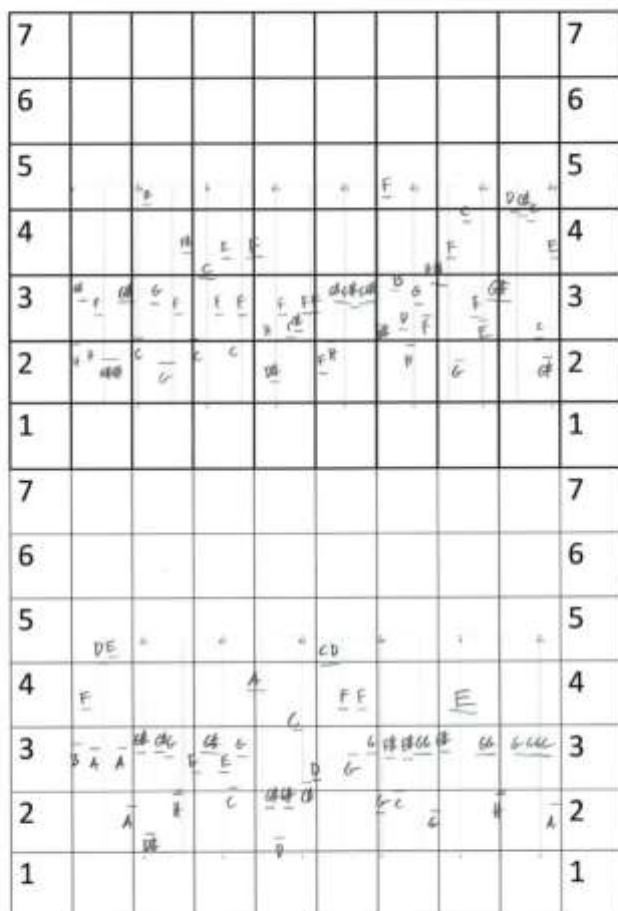
Äänidiagrammi 2. ”Kaupungin linnut”. Suurkaupungin melu.