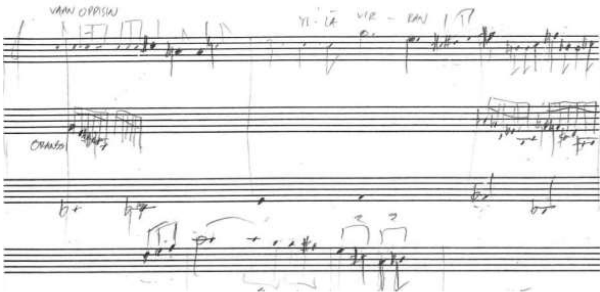
Nuottiesimerkki 2. "Vuoksi". Käsinkirjoitettua nuottihahmottelua.