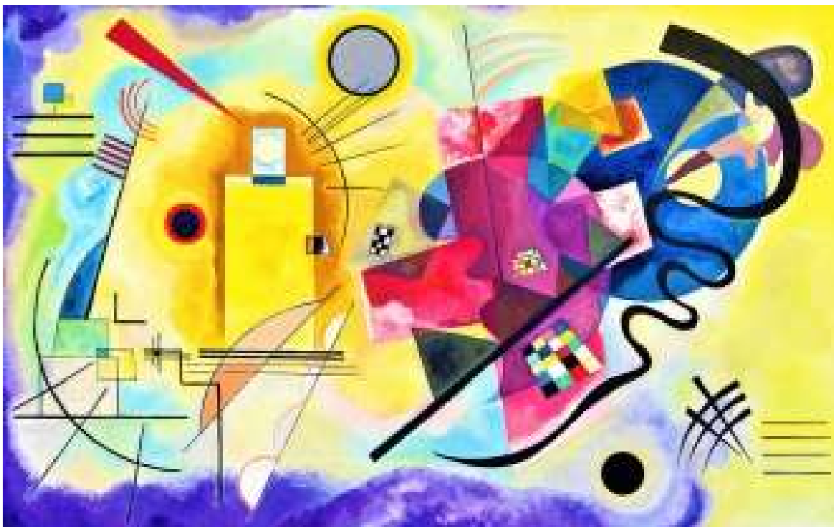
Kuva 3. Wassily Kandinskyn (1866–1944) maalaus vuodelta 1925. ”Keltainen - punainen – sininen” (”Gelb – Rot – Blau”).