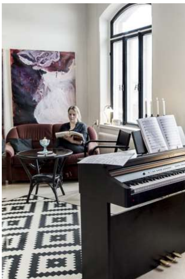
Kuva 5. Työhuoneeni Turun Barkerilla.