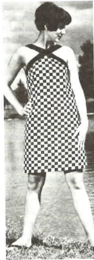
Puolalaisia vaatteita neuvostoliittolaisessa Zhurnal Mod-lehdessä (2/1967).

Neuvostoliittolaisia vaatteita arvostettiin neuvostokuluttajien parissa vähiten. Neuvostokuluttajat olivat kenties kaikkein tyytymättömiä kotimaisesta kulutustavaratuotannosta juuri