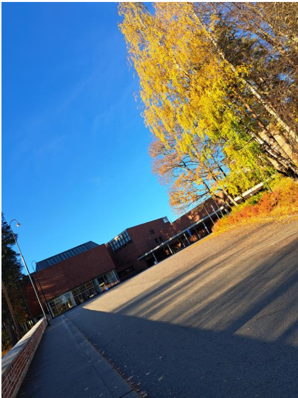
Kuva 1. Jyväskylän yliopisto.

Seitsemännet valtakunnalliset, Suomen Historiallisen Seuran luotsaamat Historiantutkimuksen päivät järjestettiin lokakuun puolivälissä Jyväskylässä. Ympyrä siis sulkeutui, sillä Jyväskylä oli myös ensimmäisten HiTu-päivien järjestäjäyliopisto vuonna 2010. Noin 300 historioitsijaa kokoontui tänä vuonna samalla juhlistamaan 150-vuotiaasta Suomen Historiallista Seuraa.