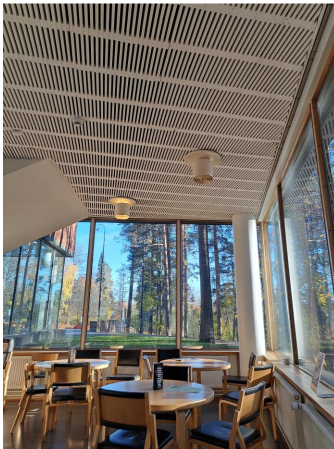
Kuva 8. Yliopiston päärakennuksen aulassa voi ihailia Alvar Aallon arkkitehtuuria ja ulkona kohoavia mäntyjä.

Perjantain lopuksi kokoonnuimme konferenssi-illalliselle Paviljongissa. Paikalle kannatti tulla ajoissa, mikäli halusi mieleisensä pöytäseurueen, sillä väkeä oli paljon ja istumajärjestys vapaa. Ilta oli onnistunut yhdistelmä maukasta ruokaa, historiasta inspiroitunutta musiikkia ja hyvää seuraa.