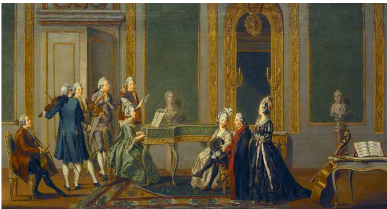
Gustaviansk interiör med musicerande sällskap, målat av Per Hilleström 1779.

hade varit svenskt sändebud i Paris 1742–1743 och blev sedermera riksråd och en av frihetstidens sista kanslipresidenter. Av hans kassabok framgår att han spelade gamba redan under sina studier i Halle på 1720-talet. Han fortsatte med detta livet ut, och gamban dyker med jämna mellanrum upp i hans brevväxling.