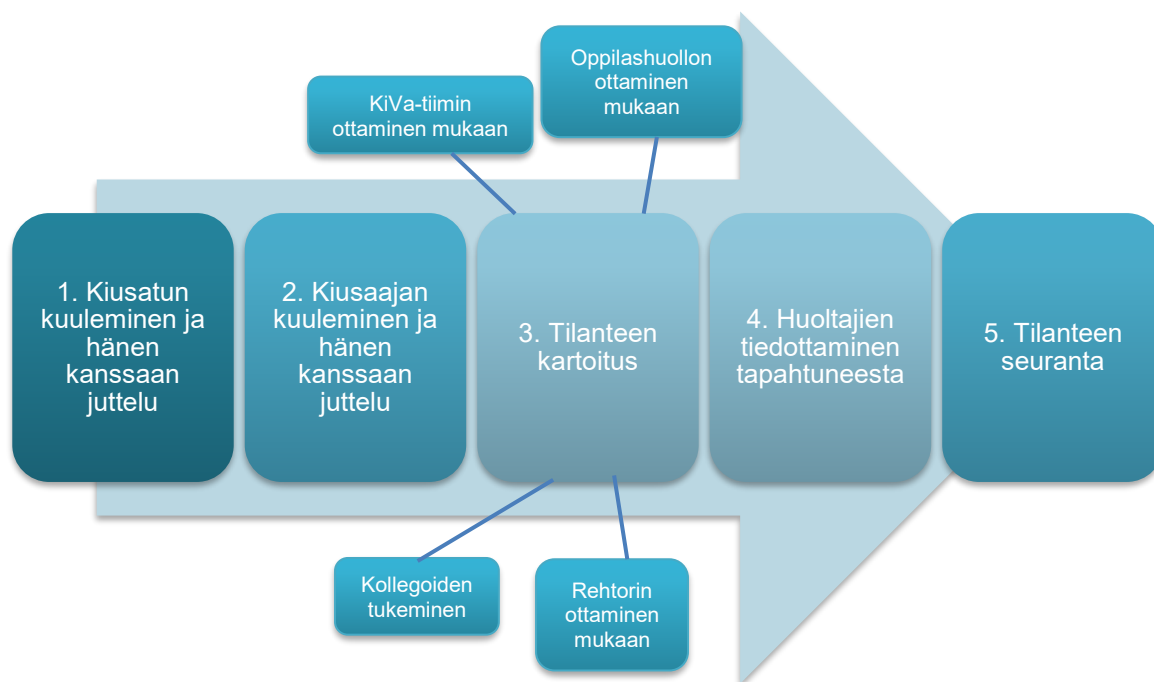
Kuvio 3. Kiusaamistilanteen toimintamalliesimerkki

Kuvio on mukaelma haastateltavien vastausten, Kiva Koulun sekä tutkijoiden omien pohdintojen pohjalta.