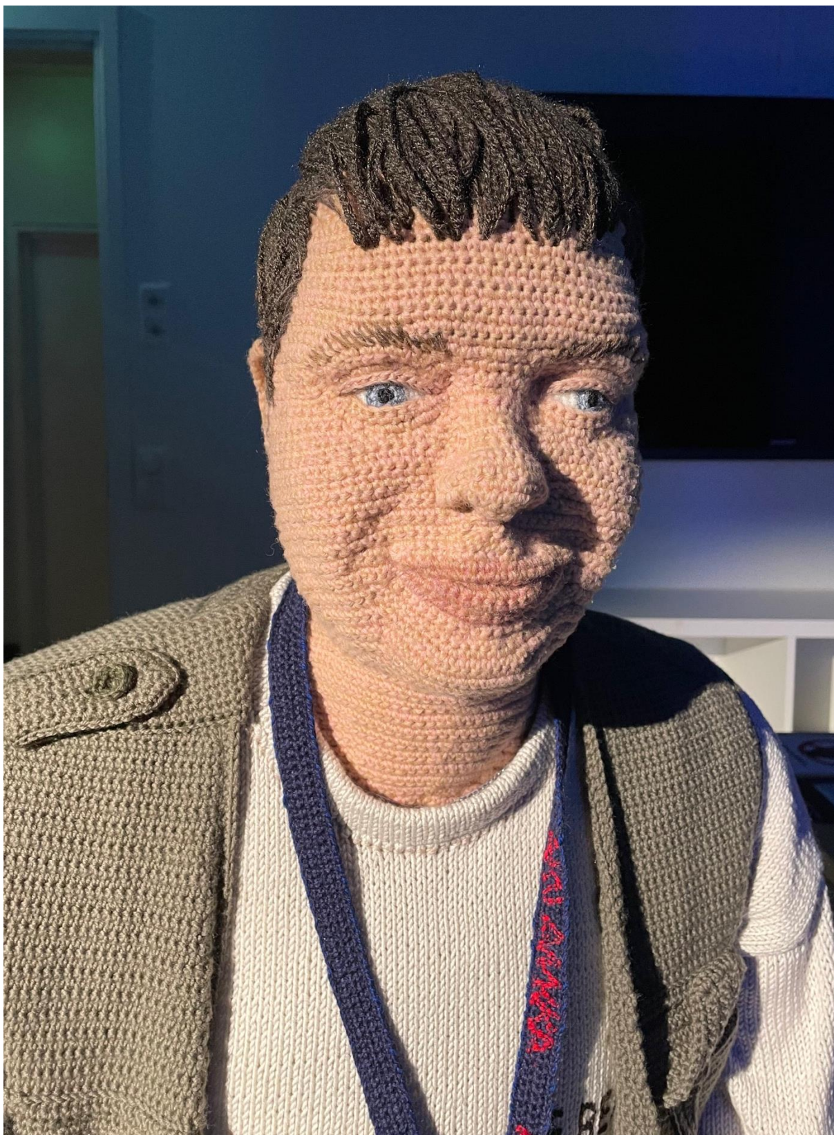
Kuva 1. Hietanen, Liisa, yksityiskohta teoksesta Mikko , 2024. Virkkaus, neulonta ja kirjonta, 135 x 60 x 85 cm.