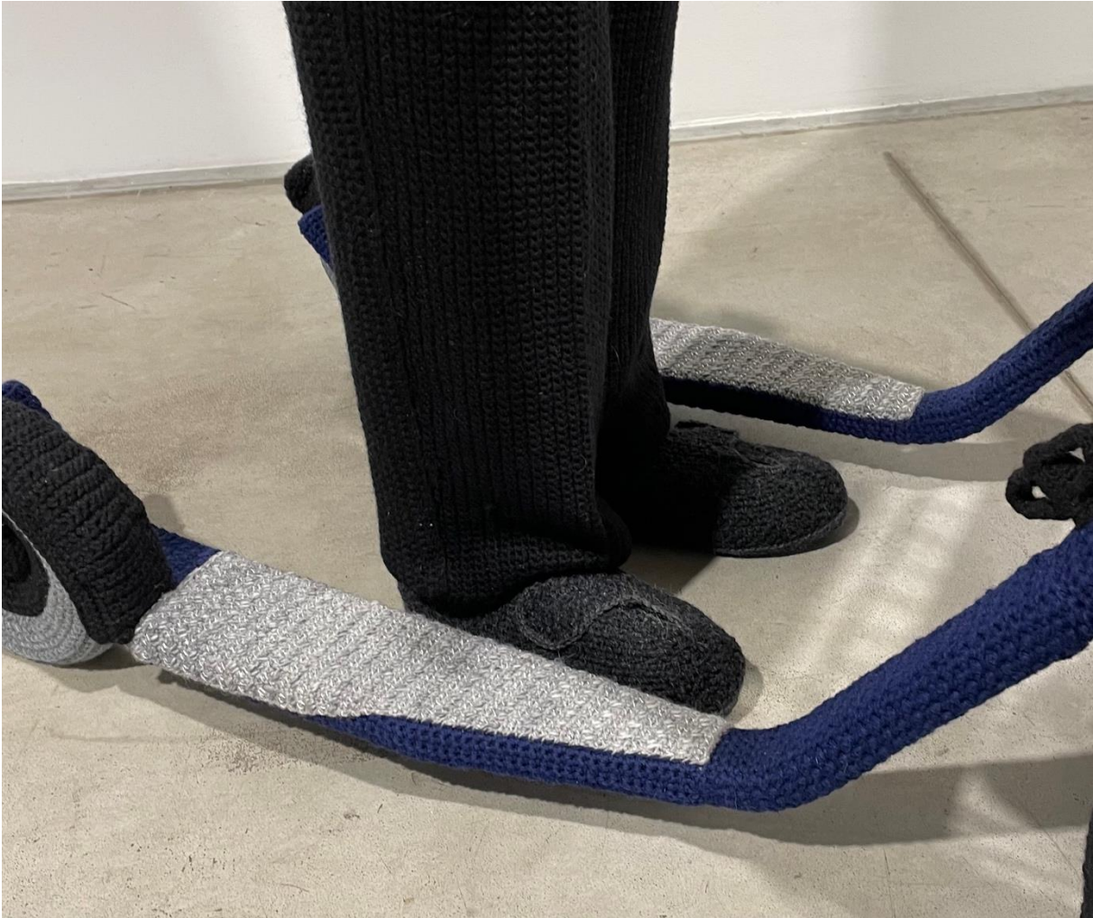
Kuva 12. Hietanen, Liisa, yksityiskohta teoksesta Aulis , 2020. Virkkaus, neulonta ja kirjonta, 170 x 60 x 120 cm.

Aulis poseeraa potkupyörän kanssa, mikä tuo hyvin esiin ikääntymisen todellisuuden. Valinta sisällyttää potkupyörä teokseen kertoo paljon. Potkupyörä on tärkeä osa Auloksen tämänhetkistä elämää. Potkupyörä muistuttaa paljon rollaattoria, mikä myös osoittaa ikääntymisen todellisuuden. Potkupyörä voi myös kuvata sen tuomia mahdollisuuksia. Se on kuitenkin suunniteltu auttamaan liikkuvuudessa. Tämän lisäksi Auliksella on kuulokoje (kuva 13), joka on yleinen apuväline ikääntyneillä. Molemmat apuvälineet ovat kuitenkin arkisia asioita, jotka auttavat ikääntymisen myötä tulleiden vaivojen kanssa elämisessä.