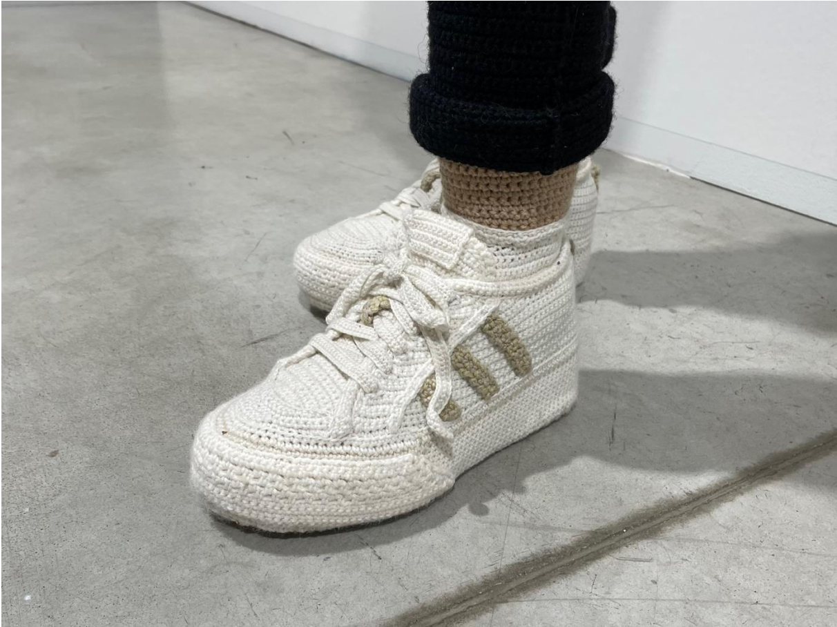
Kuva 2. Hietanen, Liisa, yksityiskohta teoksesta Dilara , 2023. Virkkaus, neulonta ja kirjonta, 160 x 50 x 50 cm.

Tekstiiliteollisuuden liitetään ympäristö- ja työolosuhdeongelmat, minkä vuoksi Wellesley-Smith kokee materiaalin harkinnan tärkeäksi osaksi hidasta tekstiiliteollisuutta. Hän huomauttaa, että suurimmat tekstiiliteollisuuden ongelmat ovat pikamuodin syy eikä tekstiiliteollisuus. Hän kuitenkin korostaa, että on silti tärkeää tarkastella myös käsitöihin ja tekstiiliteollisuuteen käytettyjen materiaalien alkuperää. (Wellesley-Smith 2015, 17.) Hietanen pohtii teoksissa käytetyn materiaalin eettisyyttä, mutta hän ei juurikaan käytä teoksissaan kierrätysmateriaaleja, jolloin ekologisuuden mielikuvaa voidaan kyseenalaistaa. Hietanen kuitenkin pyrkii hankkimaan materiaaleja vain sen verran kuin teoksiin tarvitsee. Hän ei heitä lankoja hukkaan, vaan pyrkii hyödyntämään yli jääneitä lankoja. Teokset jokseenkin viestivät ekologista ajattelua ja kulutuskriittisyyttä. Erityisesti hidaskäsi viestii kulutuksen hidastamisesta. (Myllyniemi 2016, 138.) Käytännössä materiaalivalinnoissa voisi kuitenkin tehdä ekologisempia valintoja. Väri- ja materiaalivalinnoissa vaikuttaa Hietasen valitsemiin materiaaleihin, sillä ihmishahmojen realismi ja uskottavuus ovat suuresti väri- ja materiaalivalinnoista kiinni (mt. 52).