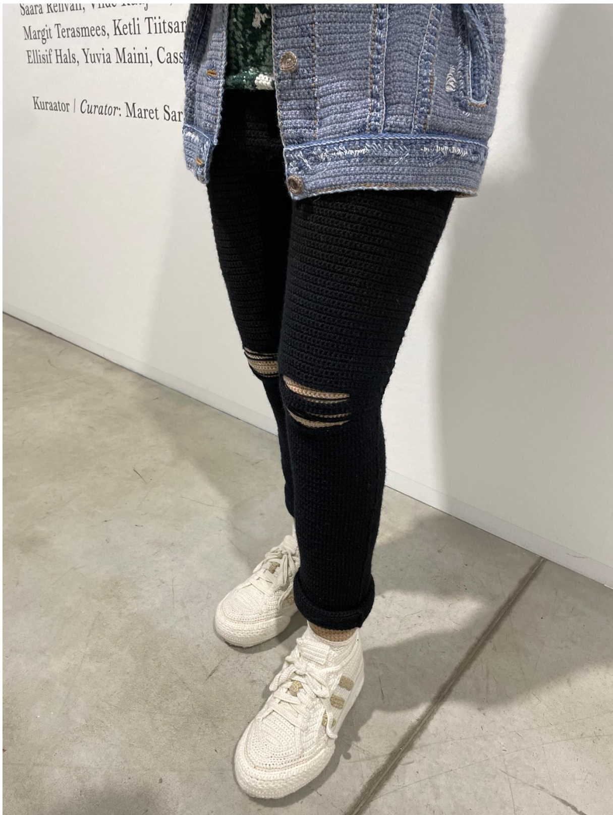
Kuva 24. Hietanen, Liisa, yksityiskohta teoksesta Dilara , 2023. Virkkaus, neulonta ja kirjonta, 160 x 50 x 50 cm.