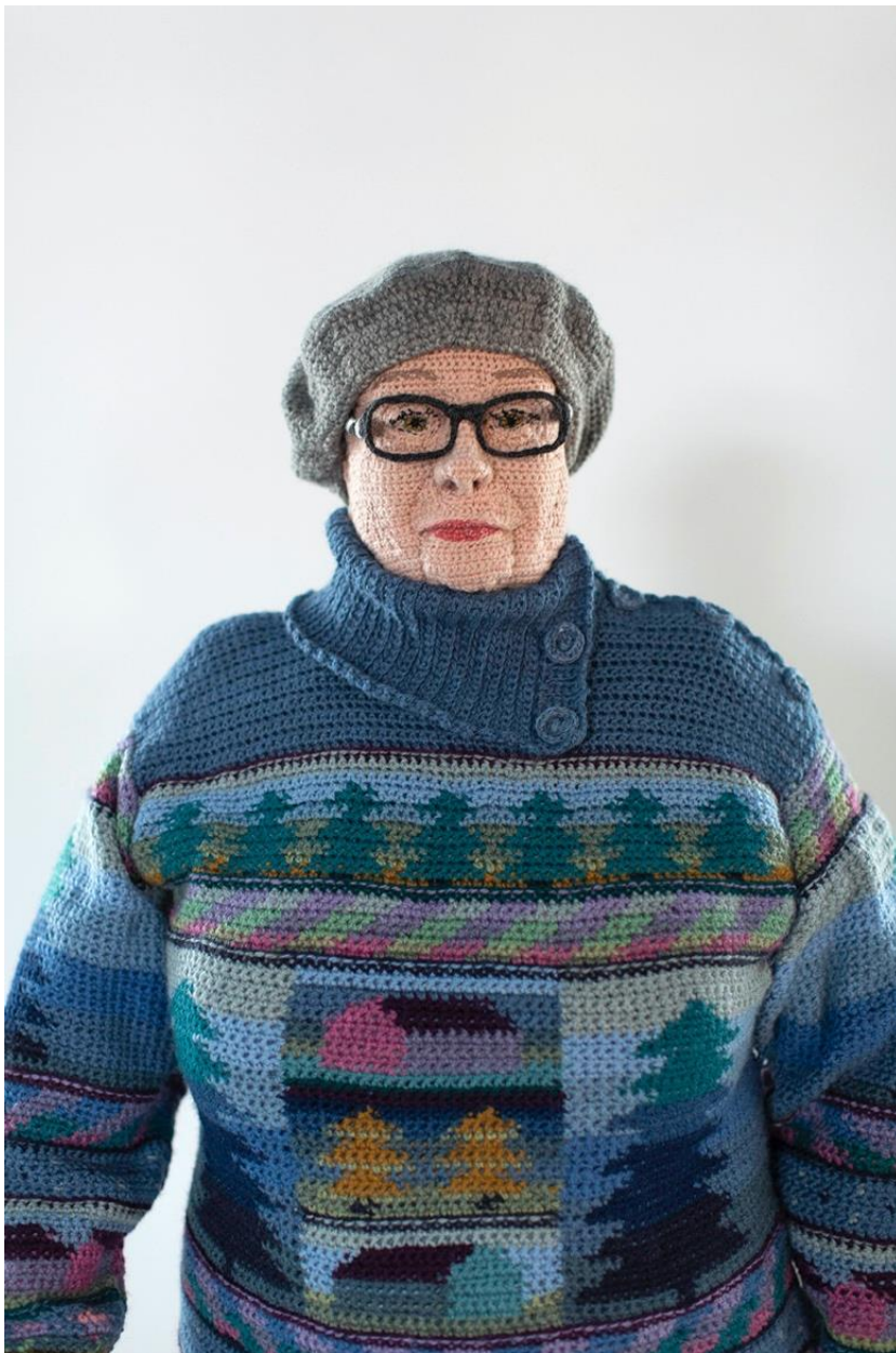
Kuva 8. Hietanen, Liisa, yksityiskohta teoksesta Raija , 2018. Virkkaus, neulonta ja kirjonta, 150 x 70 x 100 cm. Kuva: Marjaana Malkamäki. "Raija". Liisa Hietanen www.sivu.fi . & Könönen, Sirkka, Pihapuu sininen . Villapaidan neuleohje.

syytä, kuten laittautuminen johonkin tapahtumaan, se voi nostaa itsevarmuutta, se voi olla vakiintunut osa päivärutiinia tai vain mukava ajanviete tai tapa. On myös mahdollista, että huulipuna korostaisi koiralenkin merkittävyyttä Raijan päivässä tai, että koiralenkin aikana tapahtuu jotain muuta merkittävää. Todennäköisesti kuitenkin meikkaaminen on tehty päivän muita tapahtumia varten, minkä vuoksi se on päällä myös koiralenkillä. Toisaalta huulipuna kuluu melko hyvin päivän aikana, minkä vuoksi sitä on saatettu lisätä ennen koiralenkkiä. Arkeen panostaminen ja sen arvon korostaminen meikkaamisen kautta korostaa myös teoksien arjen arvostusta.