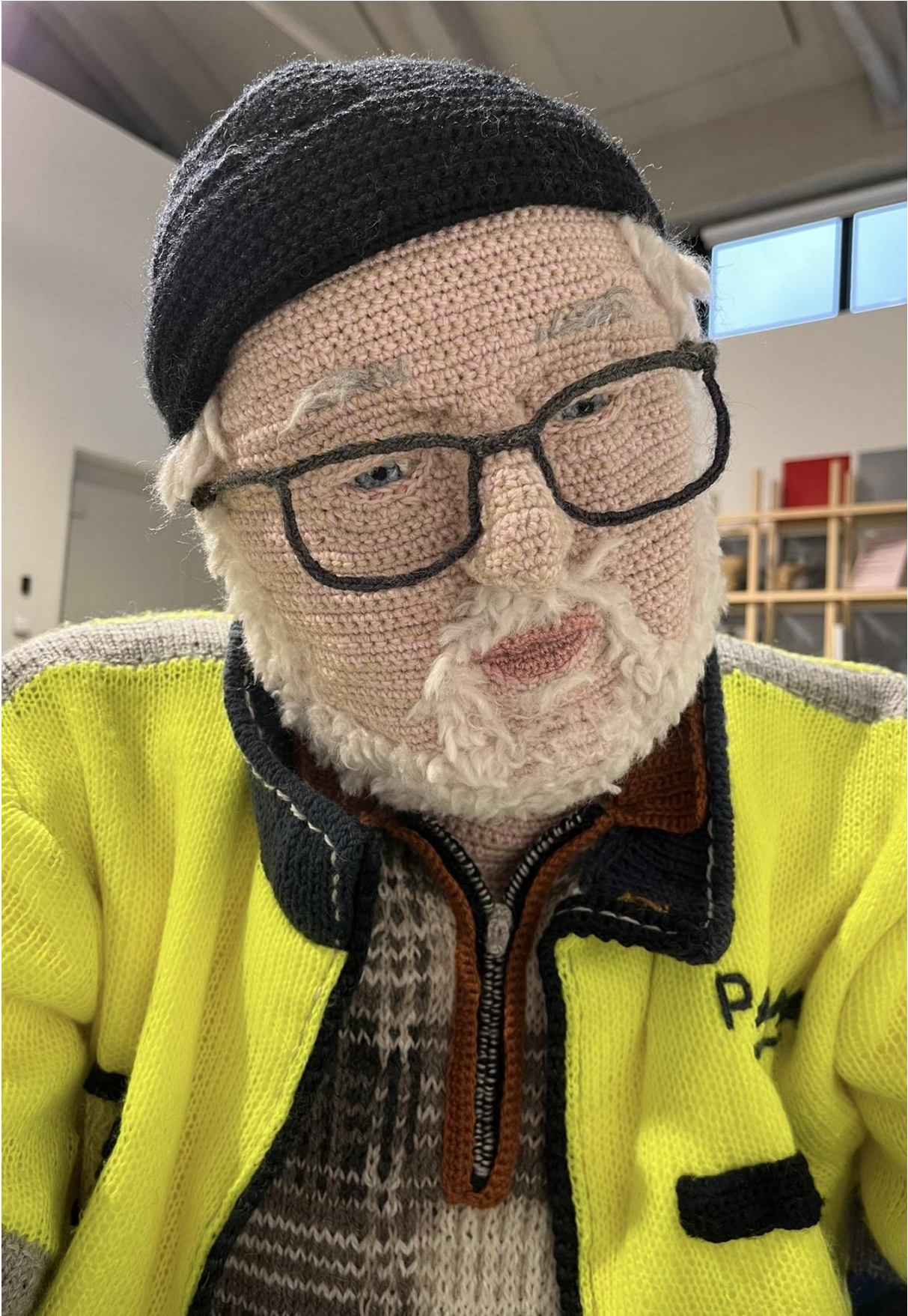
Kuva 3. Hietanen, Liisa, yksityiskohta teoksesta Weijo , 2016. Virkkaus, neulonta ja kirjonta, 125 x 65 x 90 cm.