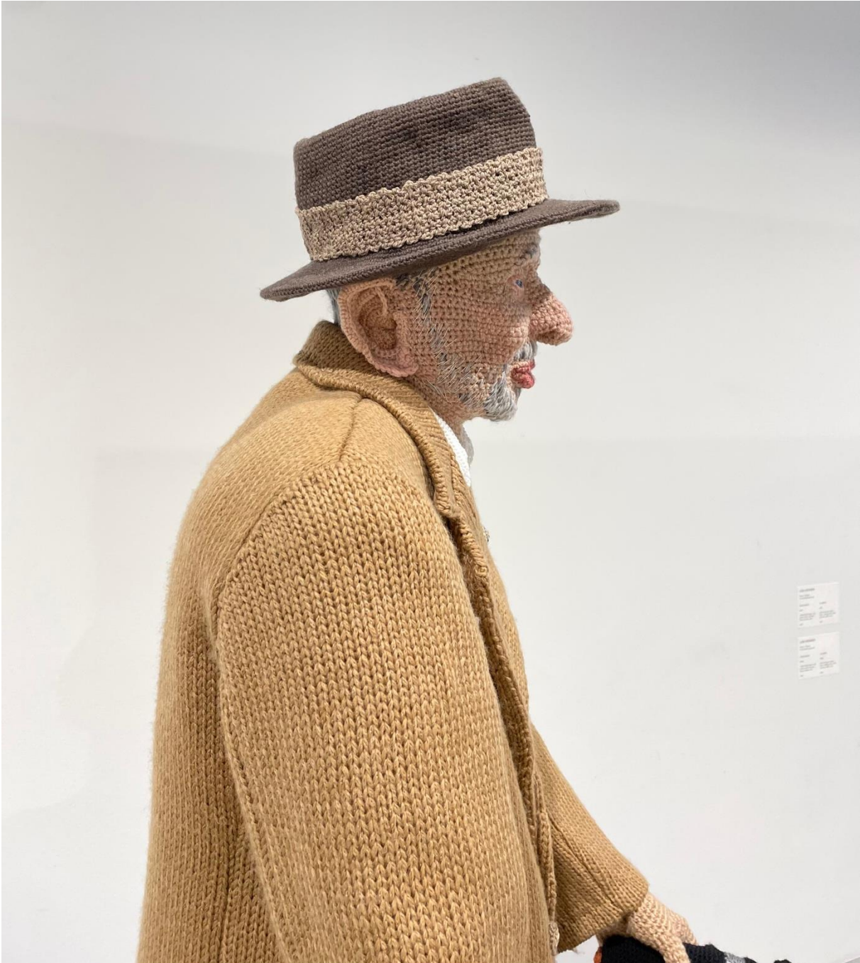
Kuva 4. Hietanen, Liisa, yksityiskohta teoksesta Aulis , 2020. Virkkaus, neulonta ja kirjonta, 170 x 60 x 120 cm. Kuva: Assi Aromaa.

Tuomalla ikääntyneitä esiin ja erityisesti tuomalla heidät osaksi kyläyhteisöä tässä määrin korostetaan heidän asemaansa. Hoivan roolia teoksissa korostaa tekstiilien pehmeiden myötä tulevat tuntemukset hoivasta ja hellyydestä. Teoksista on ainakin tulkittavissa, että ikääntyneitä arvostetaan, sillä heidät koetaan muotokuvaan taltioimisen arvoisiksi. Ikääntyneet tuodaan aidosti ja arkisesti esiin teoksissa, peittelemättä heidän luonnettaan.