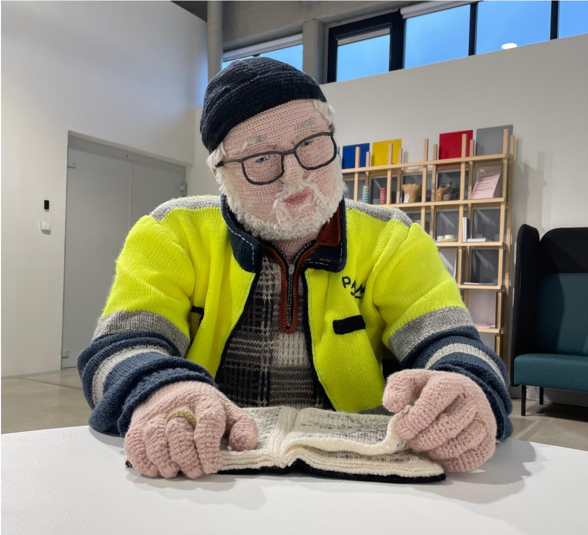
Kuva 6. Hietanen, Liisa, yksityiskohta teoksesta Weijo , 2016. Virkkaus, neulonta ja kirjonta, 125 x 65 x 90 cm.

Kaikki Kyläläiset on kuvattu hyvin luontevantuntuisesti. Tähän vaikuttaa se, että Hietanen pyrkii kuvaamaan teoksien mallit heti heidän suostuttuaan malliksi, mikä luo luonnollisen asetelman, sillä malli ei pysty etukäteen valmistumaan tilanteeseen. Taiteilija pyrkii myös jäljentämään heidän asentonsa ja vaatteensa todenmukaisesti. (Hietanen 2.6.2025.) Tämä tulee etenkin Weijossa hyvin esiin, sillä hänen asentonsa on hyvin luonnollinen. Etenkin lukemiseen syventyminen luo todellisuuden tuntua.