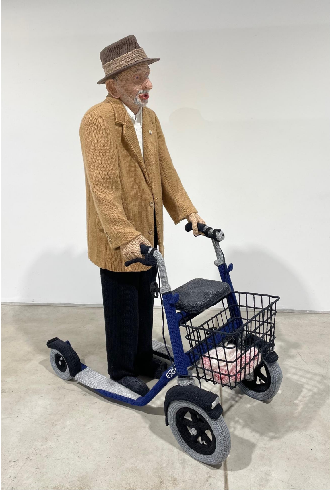
Kuva 11. Hietanen, Liisa, Aulis , 2020. Virkkaus, neulonta ja kirjonta, 170 x 60 x 120 cm.