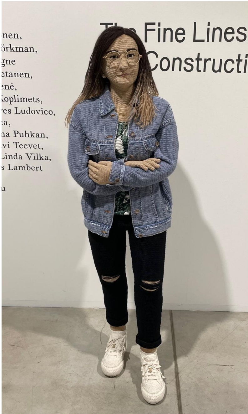
Kuva 19. Hietanen, Liisa, Dilara , 2023. Virkkaus, neulonta ja kirjonta, 160 x 50 x 50 cm.

sekä Anna ja Edith -teoksien kohdalla lapset erottuvat selkeästi lapsiksi heidän kokonsa vuoksi.