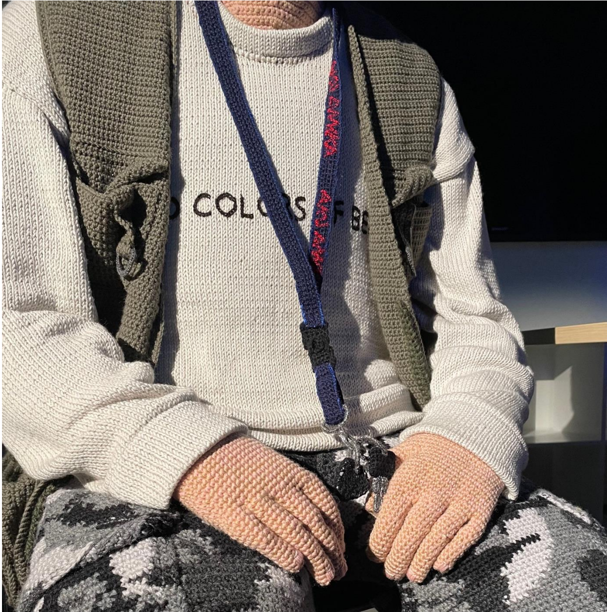
Kuva 23. Hietanen, Liisa, yksityiskohta teoksesta Mikko , 2024. Virkkaus, neulonta ja kirjonta, 135 x 60 x 85 cm.

Kuitenkin avainnauha kaulassa viestii kuvaa varttuneesta työntekijästä. Avainnauhan pitäminen kaulassa on käytännöllistä esimerkiksi työpaikoilla, joissa liikutaan lukituista tiloista toiseen päivän mittaan. Tällöin avaimet ovat aina mukana ja helposti saatavilla. Aku Ankka teemainen avainnauha luo Mikosta kuitenkin nuorempaa kuvaa. Mahdollisesti avainnauha voi olla humoristinen tai nostalginen valinta, jolloin tiedostetaan piirretyn lapsekkuus ja viitataan ironisesti tähän. Avainnauhan kautta teoksen tulkintaan vaikuttaa myös Aku Ankka hahmona ja persoonana. Koska hän on niin tunnettu hahmo, hänen persoonallisuutensa on helppo yhdistää teokseen. Hahmona Aku Ankka on hauska ja hänen