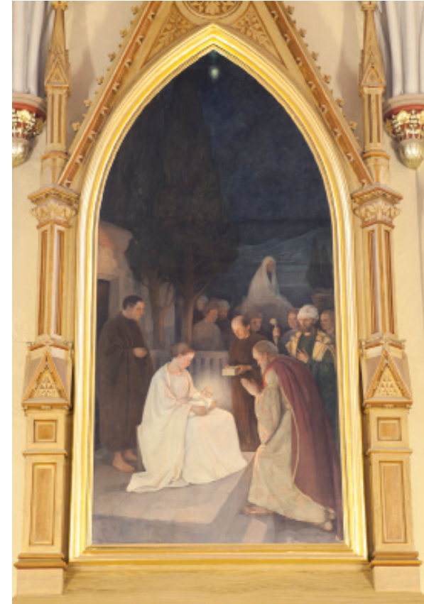
Kuva 2. Pekka Halonen, Kuninkaitten kumarrus , 1900. Öljymaalauk, 550 x 235 cm. Kotkan ev. lut. seurakunta, Kotka.

Esimerkiksi Pekka Halosen vuonna 1900 valmistuneesta Kotkan alttaritaulusta voi löytää yhteyden niihin kuvastoihin, joita kierrätettiin spiritualistisessa ja psyykkiseen tutkimukseen liittyvässä kirjallisuudessa. Taulun vasemmassa laidassa häilyy läpikuultava hahmo, joka näyttää materialisoituneen todellisuuden henkisemmiltä tasoilta kristillisen vapahtajan syntymää todistamaan.