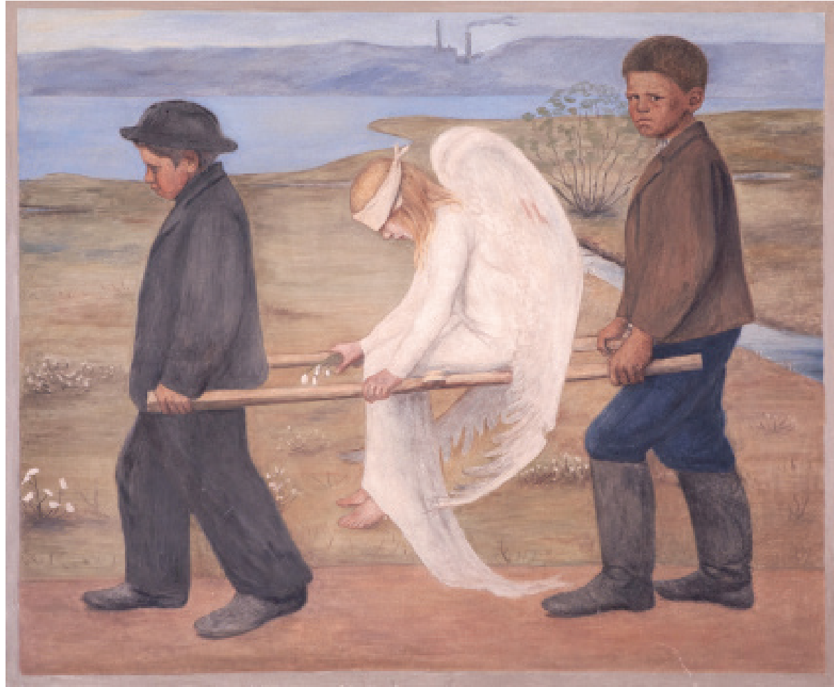
Kuva 1. Hugo Simberg, Haavoittunut enkeli, 1906. Fresko, 158 x 185 cm. Tampereen tuomiokirkko, Tampereen seurakunnat.

Tutkimuksessani osoitan Gallen-Kallelan, Halosen ja Simbergin taiteen henkisyttä koskevien käsitysten ja teosten kietoutuvan monisyisesti esoteerisuuteen. Mutta mitä taiteen yhteys esoteerisuuteen tässä oikeastaan tarkoittaa?