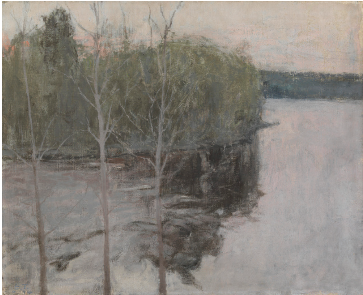
Image 3. Ellen Thesleff, Kevätyö / Spring Night , 1894. Collection Herman ja Elisabeth Hallonblad / Ateneum Art Museum.

At the turn of the 20th century an artwork created with only a few “non-colours” was a bold move: imagine a landscape painted with only black, brown and white. To produce a painting without colour must have been as shocking as Gauguin’s use of deep purple, bright vermillion and chrome yellow. For example, the achromatic scale inspired artists to explore greyish tonality in works imitating fresco, landscapes appearing from the mist and innovative portraits. Interestingly, artists did not imitate Puvis de Chavannes’ allegorical murals or his Christian subject matter. However, they adapted his tonal grey scale technique to small sized paintings.