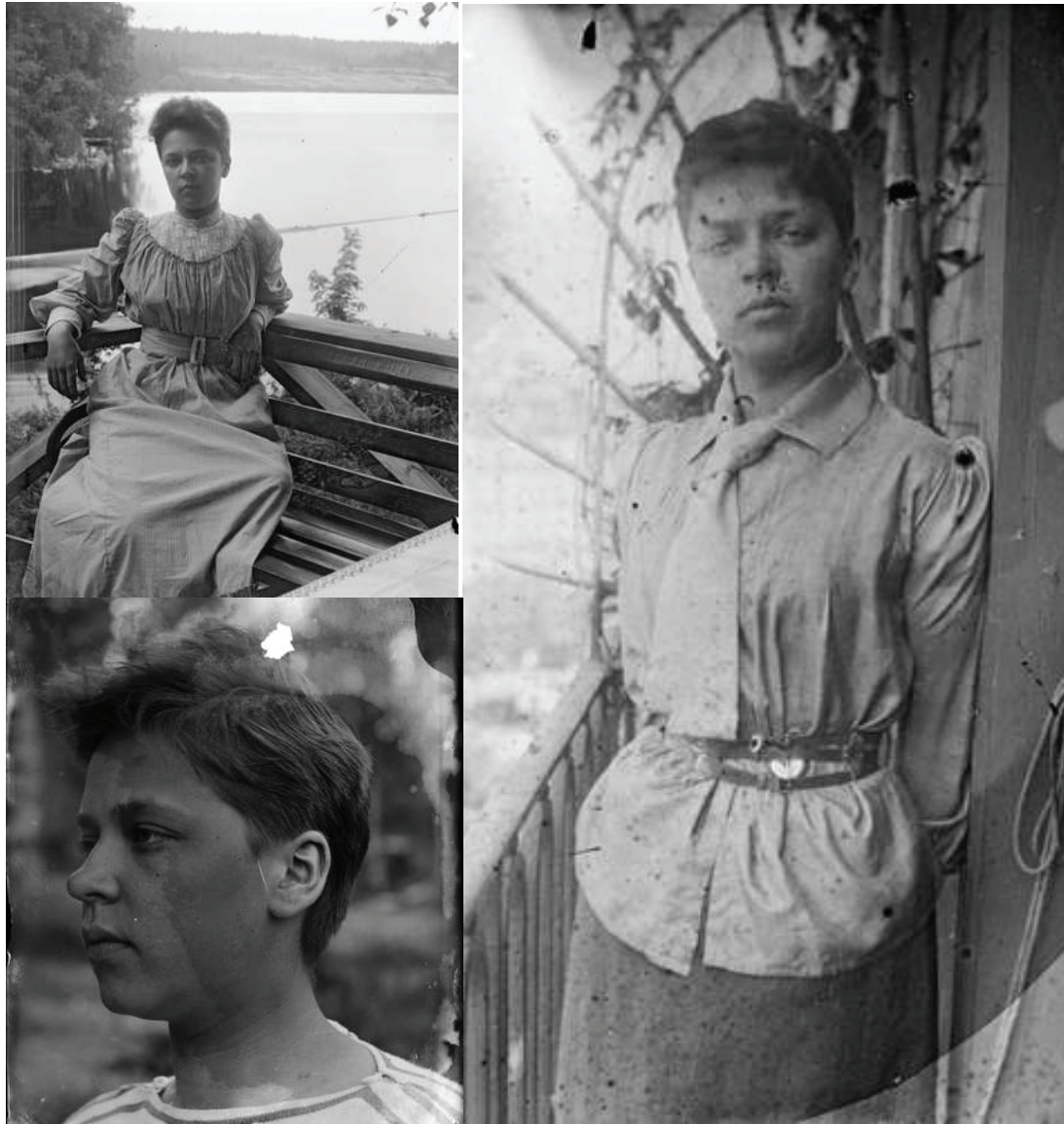
Kuvat 1–3. Ellen Thesleff 1890-luvun alussa. Svenska litteratursällskapet 959.

Thesleffin valokuvissa näkyvät lyhyet hiukset olivat tuona aikana naiselle epäkonventionaalinen ele. 1800-luvun kulttuurissa miesten ja naisten ulkonäkö ja käyttäytyminen oli normien säätelemää ja sukupuoliero pyrittiin näyttämään. 28 Samaan aikaan kuitenkin Thesleffin aikalaisnaiset, ja myös edellisen sukupolven naisasialiikkeen naiset, niin Suomessa kuin Euroopassakin, leikkasivat hiuksiaan kapinallisena eleenä julkisissa naisasiaa ajavissa mielenosoituksissa. Juliet McMasterin mukaan naisten taistelussa