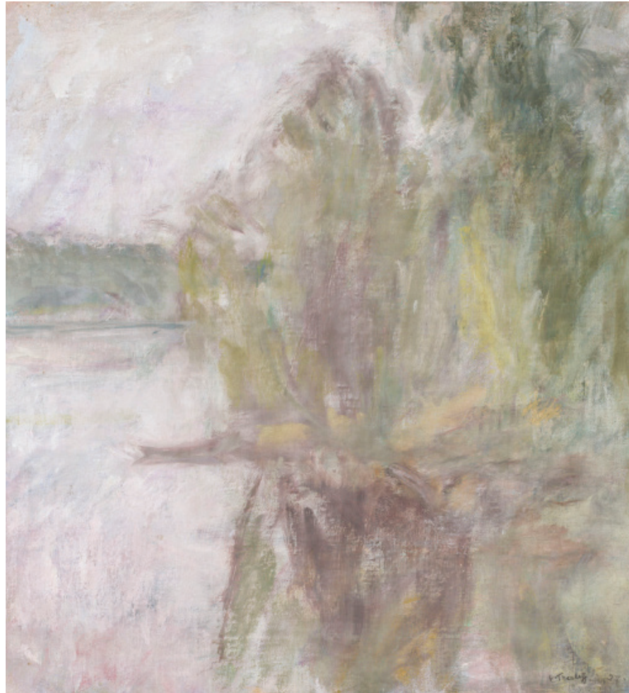
Image 6. Ellen Thesleff, Järvimaisema / Lakeside Landscape , 1937. Ateneum Art Museum / Finnish National Gallery.

Furthermore, the extreme restraint in her paintings created an almost matterless, music-like experience. The dissolution of form or modern vaporousness is evident in her landscapes which seem to live in a world of their own. Contrary to those of other artists, Thesleff's paintings were full of gentleness and harmony, which many critics saw to be feminine art. From the outset, Thesleff's concept of Symbolism was an original one. Even though she was influenced by the movement and used themes which can be seen as being symbolist, Thesleff adopted such elements as musicality, spirituality and introspection quite freely in her portraits, never even mentioning "Symbolism" in her letters. 77 Thus Thesleff's colour ascetic work is individualist and in its immaterialness unique. In the end colour formed the frame for her painting. and as we have seen here, for Thesleff both tonalism and indistinctness certainly lived further than her symbolistic period.