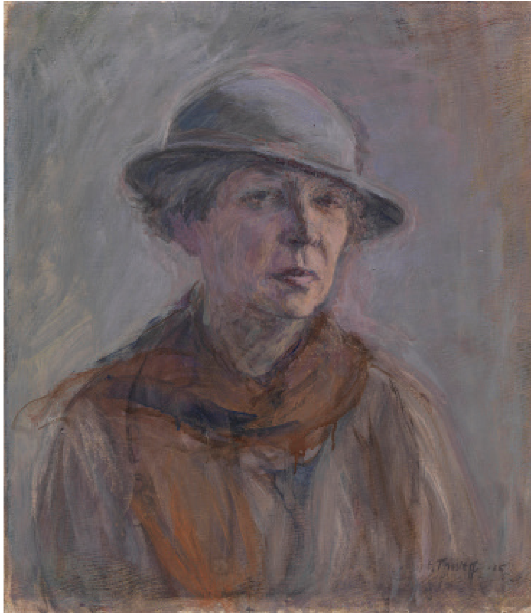
Image 5. Ellen Thesleff, Omakuva / Self-Portrait with Hat , 1935. Ateneum Art Museum / Finnish National Gallery.

In Thesleff's works from the 1890s two distinct colour techniques can be seen; one is a palette based mainly on brown, black and white, the other the harmonisation of a tonal palette of white and grey. The first technique points to Carrière, the second to Puvis de Chavannes and Whistler. Mostly Thesleff painted using the second technique, an ascetic tonal palette which is toned by one colour (white or grey), 76 derived from the mural art technique developed by Puvis de Chavannes. The harmony achieved with gentle shades softened with white or light grey was unusual and personal. In Aspens (1893) and Spring Night (1894) the artist has, with a light tonal palette, created the colour scale of the entire work. Particularly in the opaline grey painting Spring Night she has concentrated solely on different shades of grey to create the mystical atmosphere of the shimmering evening dusk. The painting