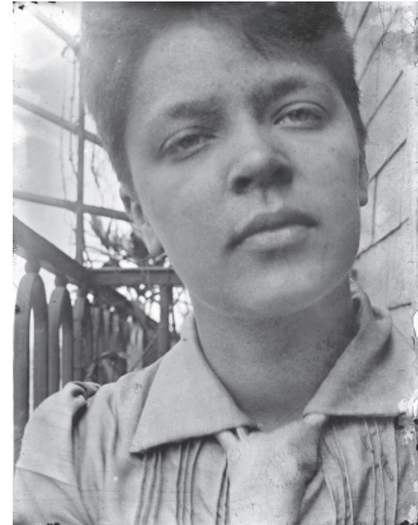
Kuva 11. Ellen Thesleff 1890-luvulla.