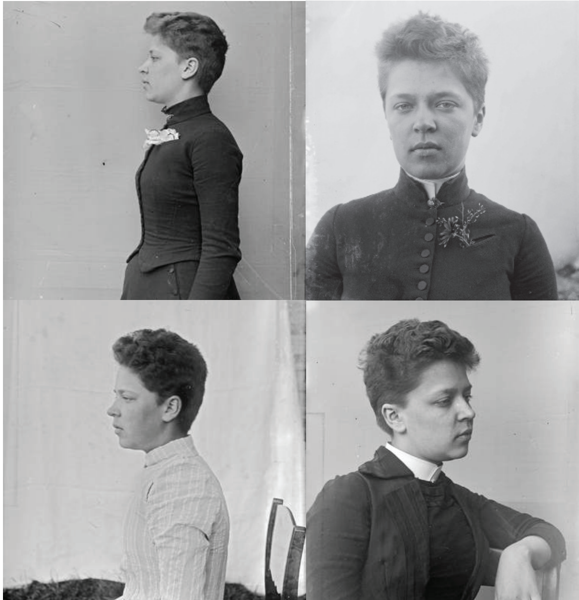
Kuvat 4-7. Ellen Thesleff 1890-luvulla.

Sexualis -teoksen (1886) mukaan naisen maskuliinisuuden ilmenemismuotoja olivat muun muassa halu esiintyä lyhyissä hiuksissa ja miesten vaatteissa (tai miesten mallin mukaisesti leikatuihin vaatteisiin). Krafft-Ebingin ajattelussa naisen seksuaalisuuden epäluonnolliset eli miesmäiset ilmenemismuodot eivät olleet niin hälyttäviä kuin miesten, koska naisen homoseksuaalisuus ei ollut rangaistava teko. Gynandria eli naisen miesmäisyys oli kuitenkin vaikein ja epäluonnollisin naisen homoseksuaalisuuden muodoista. 35 Krafft-Ebingin tutkimuksen tapaus numero 165 kuvasi 38-vuotiasta gynandriasta kärsivää naista: lyhyeksi leikatut hiukset, miesten kravatti, ”miesmäinen” puvun leikkaus, karkeat tavat ja luonteenpiirteet sekä ankara ja hieman syvä ääni. Nainen piti lukemisesta ja oli haaveillut opettajan ammatista. 36