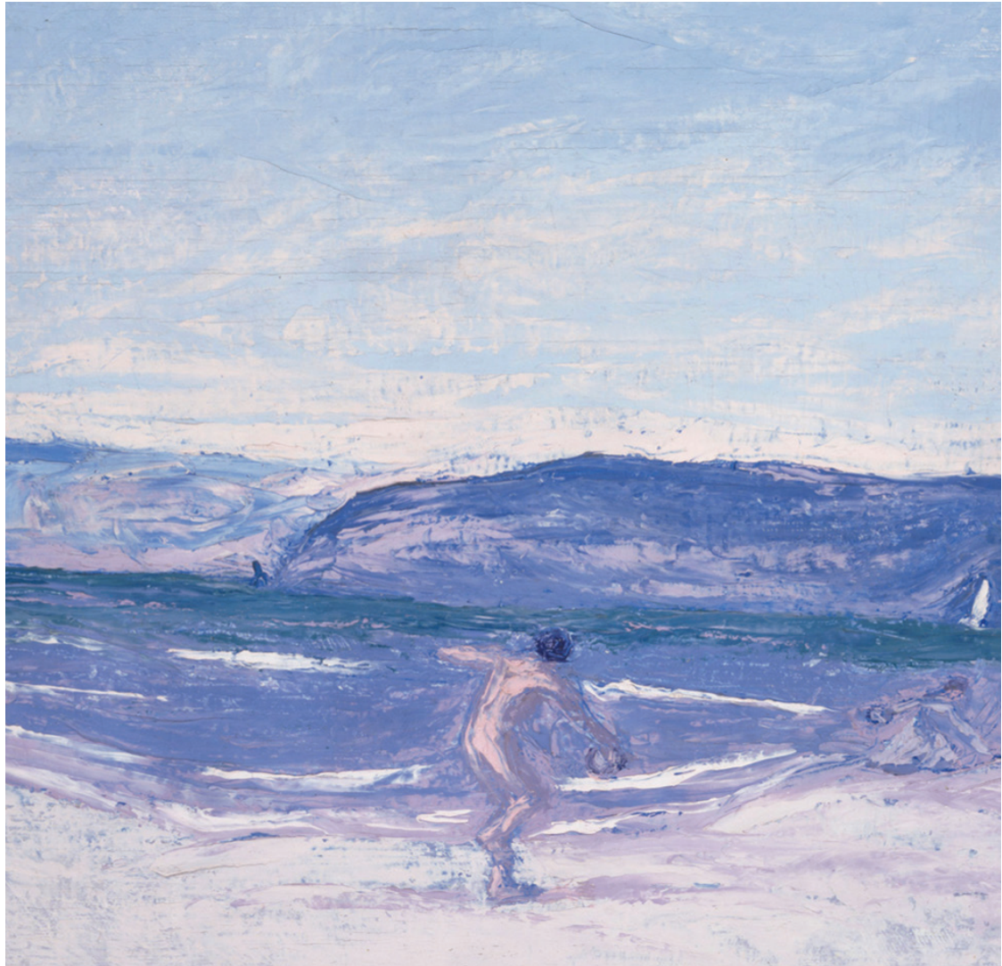
Kuva 2. Ellen Thesleff, Palloveli (Forte dei Marmi) , 1909. Öljyväri kankaalle, 44 x 42 cm.

Pallopelissä , samoin kuin muissa saman aikakauden maisema-aiheissa, valo ja väri muodostavat erottamattoman symbioosin: väri on valoa ja valo on väriä. Utuisen autereinen, sokaisevan kirkas tai vahvoja varjokontrasteja muodostava valo nousee teosten kantavaksi voimaksi. Vaikka itse auringon kehää ei niihin yleensä olekaan kuvattu, tuovat Thesleffin aurinkoa säkenöivät maisemat silti ajatuksellisesti mieleen Edvard Munchin samoihin aikoihin maalaaman aurinkoteosten sarjan. Munchin teoksissa, joista yhden hän liitti osaksi Oslon yliopiston juhlasalin seinämaalausten sarjaa (1911), hehkuva aurinko on kuvattu kaiken elämän lähteenä. Sen säteet lankeavat prismoina maan ja taivaan ylle sitoen koko maailman-kaikkeuden kosmiseen yhteyteen. Vitalistiseen ajatteluun sisältyi usein myös panteistinen ulottuvuus, jossa juuri aurinko saattoi edustaa luonnon jumalaista luomisvoimaa. 20 Uudenlainen henkisyys, joka 1800-luvun lopulta alkaen valtasi alaa, hylkäsi ajatuksen kristinuskon persoonallisesta Jumalasta, mutta ei kuitenkaan kiistänyt jumaluuden läsnäoloa luonnossa. Jumaluus ikään kuin