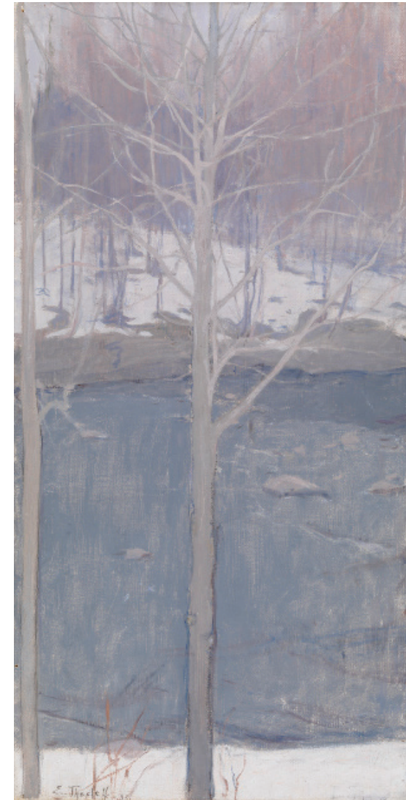
Image 1. Ellen Thesleff, Haapoja / Aspens , 1893. Ateneum Art Museum / Finnish National Gallery.

During his studies in Paris at the beginning of the 1890s Thesleff's friend Magnus Enckell enrolled at the Académie Julian. It was around this time that he painted the small, grey-brown-toned Self-portrait (1891) which became the first example of his new symbolist art 48 and also his first colour ascetic painting 49 . The portrait shows a young, serious, perhaps shy artist looking into the distance. The palette is sparse; only white, brown and black are used. This radical re-