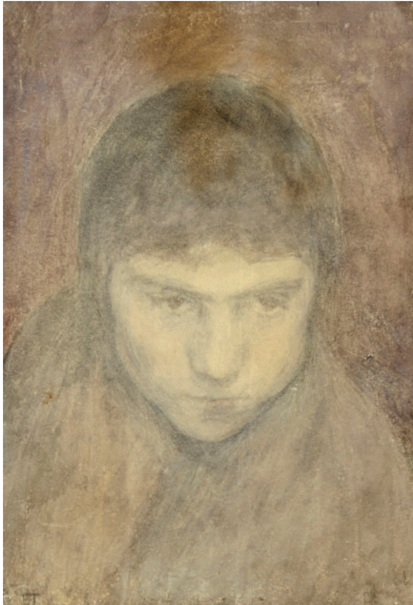
Image 2. Ellen Thesleff, Pojan pää / Head of a boy, 1894. Ateneum Art Museum / Kansallisgalleria.

sitional emphasis not on the performer of the music but rather on the listener, who seems able to transport herself beyond the confines of her Victorian interior. Later Khnopff works are much more explicit in summoning nostalgia and in forming organic links with the past as a place to which one might actually connect: With Grégoire Le Roy. My Heart Weeps for Other Times (1889), 54 the title of which is taken from a Le Roy poem about nostalgia, shows a woman attempting to create an attachment with a veiled or mirrored image of a past city (probably Bruges) with her kiss. 55 Particularly for symbolists, hearing one's inner voice in deep contemplation was the aim. This we can witness in the tonalist works of Khnopff, Carrière and Thesleff.