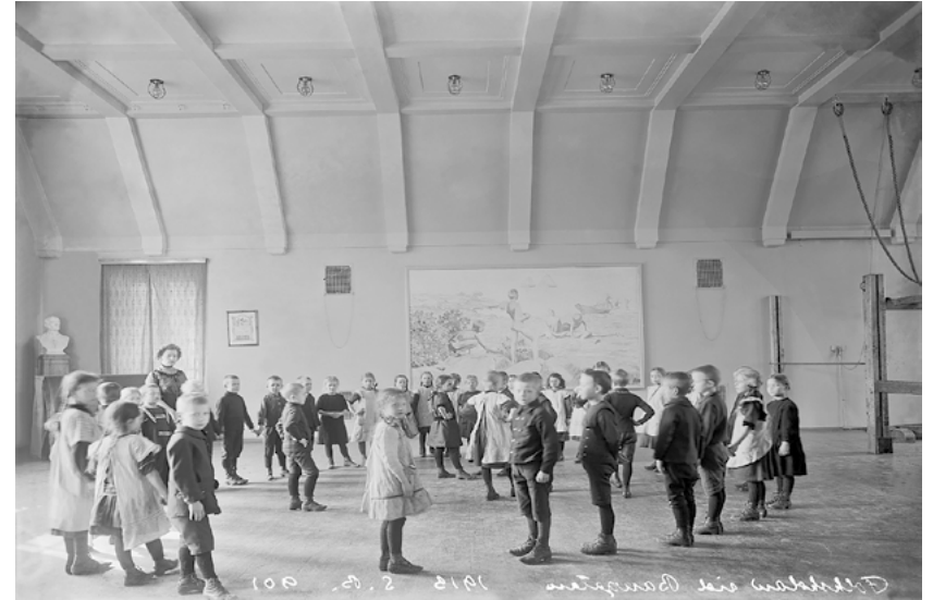
Kuva 2. Helsingin ruotsinkielisen kansakoulun (Ratakatu 6) oppilaita leikkimässä piirileikkiä voimistelutunnilla 1913. Kipsinen Uno Cygnaeus seuraa oppituntia nurkasta.

Muistojuhla pyritään yleensä järjestämään paikalla, jolla on yhteys muisteltavaan tapahtumaan tai henkilöön. Tapahtumapaikat ovat tärkeitä varsinkin sotien, katastrofien ja onnettomuuksien uhrien muistamisen kulttuurille, mutta pyhillä paikoilla on merkitystä myös esimerkiksi henkilö­kultteille. Merkkihenkilön muistamisen paikaksi soveltuu hautausmaahan lisäksi julkiset muistomerkit, henkilön entiset asuin- ja työpaikat sekä mu-