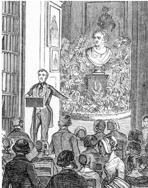
Kuva 4. Yksityiskohta Goethen syntymäpäiväjuhllaisuuksia esittävästä piirroksesta Carl Fredrik I:n kirjastossa Weimarissa 1849.

patsaan äärellä puheita ja lausua runoja. Varsinkin Goethen 100-vuotissyntymäpäivää vietettiin näyttävästi vuonna 1849. (Safrinski ym. 2017) Helsingin Havis Amanda -patsaan vuosittainen lakitus voidaan nähdä tämän saman perinteen jatkajana – sekin on ainakin osittain koulun juhla.