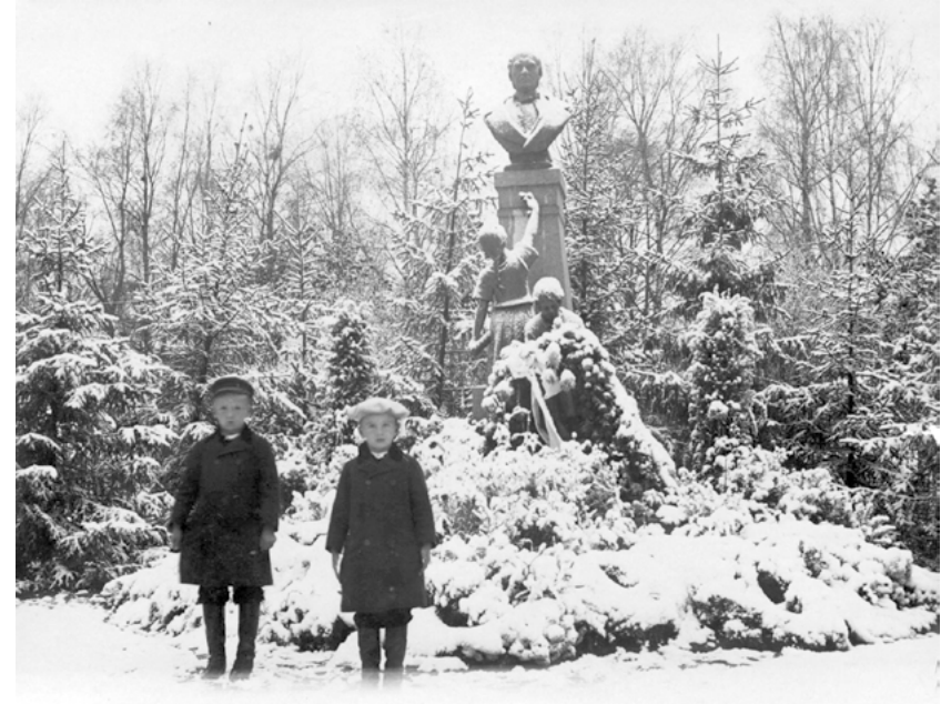
Kuva 3. Lapsia Jyväskylän Cygnaeus puistossa 13.10.1910. Edellisenä päivänä lasketut seppeleet olivat peittyneet yöllä sataneeseen lumeen.

Vuonna 1872 Jyväskylän seminaarin miesosaston liikunta- ja juhlasaliin järjestetyn kansakoulukokouksen näyttämö oli varmasti pysäyttävä näky. Salissa oli esillä varsinainen kipsisten rintakuvien kavalkadi: jalustoiltaan juhlijoihin katselivat koristellut H. V. W. Furuhelmien muoto- ja rintakuvat sekä Aleksanteri II:n, E. Lönnrotin, H. G. Porthanin, F. Paciuksen ja J. L. Runebergin kipsiset rintakuvat (Sallinen 2024, 17). Henkilögalleria saattaa vaikuttaa sattumanvaraiselta, mutta yhdessä niiden oli tarkoitus muistuttaa kansallisen kulttuurin ja historian merkityksestä. Muotokuva oli tärkeässä roolissa myös Tammisaaren seminaarin kymmenvuotisjuhlassa; tilaisuutta vietettiin koristellun Cygnaeuksen öljyvärimuotokuvan äärellä. Uudenkaarlepyyn seminaari teetti itselleen Cygnaeusta esittävän öljyvärimaalauksen, mikä otettiin mukaan koristeltuna vuoden 1883 vuo-