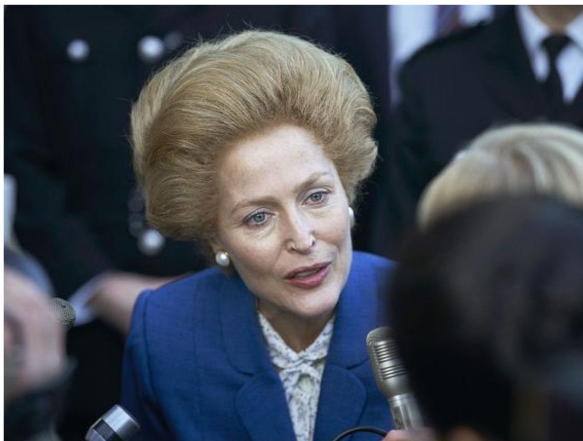
Rautarouvan varjossa. Margaret Thatcherin (Gillian Anderson) johtamistyyli ei jää epäselväksi The Crown -sarjan katsojille.

”Tv-sarjoissa nähdään yllättävän vähän peiliä rautanyrkillä hallitseville kovaotteisille naistyranneille. Yksi syy voi olla se, että länsimaiden historiasta vastaavia merkkihahmoja löytyy niukasti. Moraalisesti pahoille naisjohtajille olisi todennäköisesti kuitenkin nyt tilausta.”