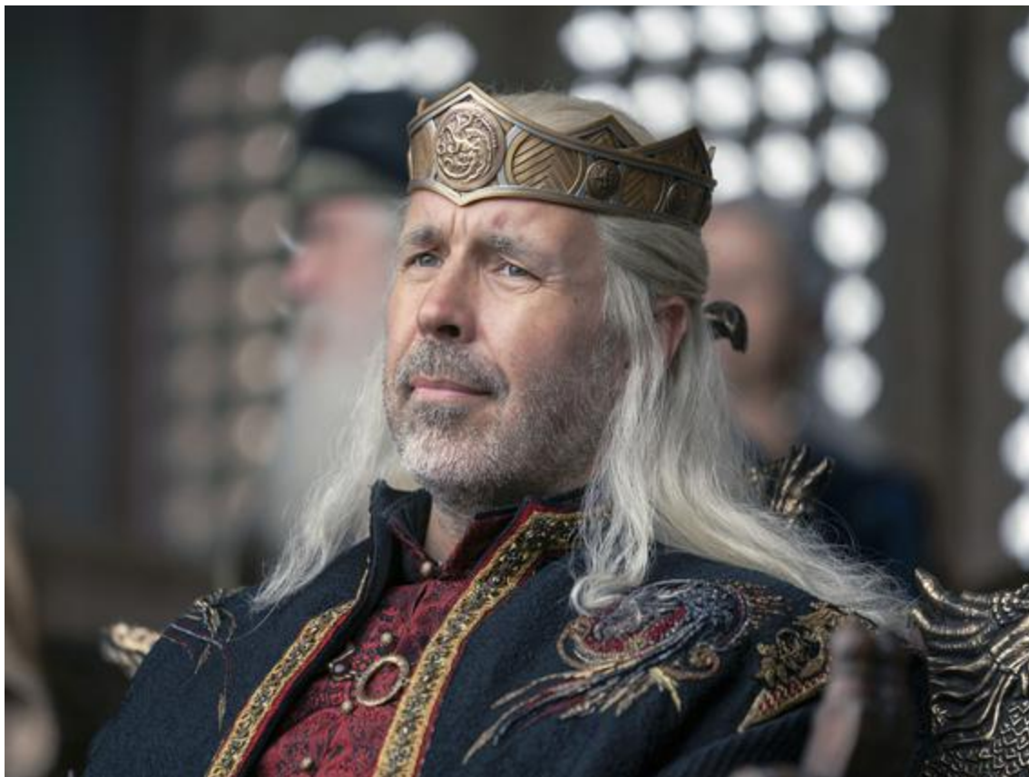
Särkynyt itsevaltias. House of the Dragonin kuningas Viserys Targaryen tuskailee läheisten menettämisen ja päätöksenteon vaikeuden kanssa.

Rhaenyra itse kasvaa sarjan ensimmäisen kauden aikana vastentahtoisesta perijästä kovaotteiseksi ja karismaattiseksi johtajaksi. Lohikäärmesukua edustavalla Rhaenyrolla on vahva ja nuori lohikäärme. Isä-Viserysin lohikäärme on menehtynyt jo ennen tarinan alkua. Tämä on metafora Viserysin vallan sirpaloitumiselle.