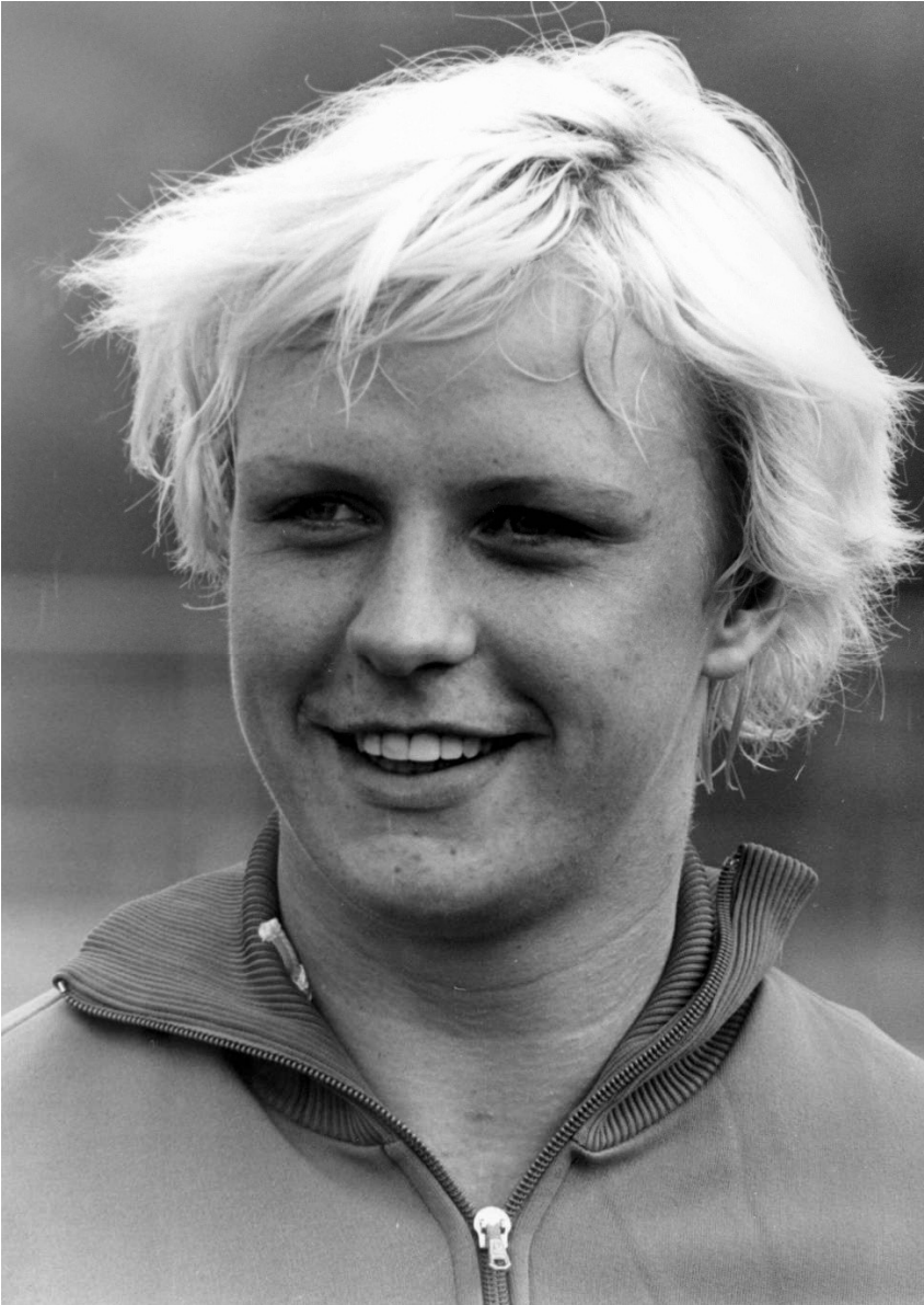
Kuva 1. DDR:n kuulantöytäjä Ilona Slupianek kuvattuna Euroopan mestaruuskisoissa 1976.

Slupianek oli ensimmäinen DDR:n urheileva nainen, joka jäi kiinni dopingista. Urheilijan dopingin käyttö paljastui jo vuonna 1977, mutta tuolloin hän sai vain lyhyen, vuoden mittaisen kilpailukiellon. Moskovan olympiakisoissa vuonna 1980 hän voitti kultaa. Lehtikirjoituksessa nostettiin esille naisten huomattava osuus positiivisen testinäytteen jättäneistä. Huolestuttavana pidetään paljastuneiden suurta määrää, vaikka informaatiota oli aineiden vaaroista varsinkin naisille jaettu jo vuosia. Myös lännen urheilijoiden dopingista kerrottiin, mutta itäblokin suhtautumista lääkkeisiin arvosteltiin liian myötämieliseksi ja sallivaksi. 46 Idän urheilijoiden epäilyttävät keinot nostettiin usein esiin, jopa