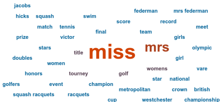
Kuva 1: Aineiston pohjalta luotu sanapilvi

Vuonna 1932 The New York Times issä julkaistiin 832 artikkelia, jotka täyttivät asettamani hakukriteerit eli niissä mainittiin urheilun (sports) lisäksi seuraavista hakusanoista ainakin yksi: tyttö (girl/girls) tai nainen (female, woman/women). Kaikki hakukriteerini täyttävät artikkelit eivät kuitenkaan ole yhtä merkityksellisiä tutkimuksen kannalta eikä jokaisen artikkelin lukeminen läpikotaisin ole käytännöllistä aineiston laajuuden ja läpikäyntiin vaadittavan ajan vuoksi. Kyseinen aineisto voi kuitenkin kaikessa laajuudessaan olla hyödyllinen ennen kuin analysoidaan tarkemmin yksittäisiä artikkeleja. Kyseiset 832 artikkelia pitävät sisällään myös olympiauutisoinnin, joka oli yksi vuoden 1932 urheilu-uutisoinnin merkittävimmistä asioista. Koko vuoden aikana järjestettiin kuitenkin lukuisia kilpailuja niin paikallisesti, kansallisesti kuin kansainvälisestikin, joista uutisoitiin sanomalehdessä. Nämä artikkelit sisältävät vääjäämättä tutkimukselle merkittävää sisältöä, jolloin niiden analysointi on tarpeellista. Havainnollistaakseni laajemman aineiston sisältöä ja löytääkseni tarkemmalle analyysille relevanttia sisältöä olen hyödyntänyt Gale Digital Scholar Lab -työalustaa, jossa olen aineistoni pohjalta luonut Ngram-ohjelmistoa hyödyntäen sanapilven. 163